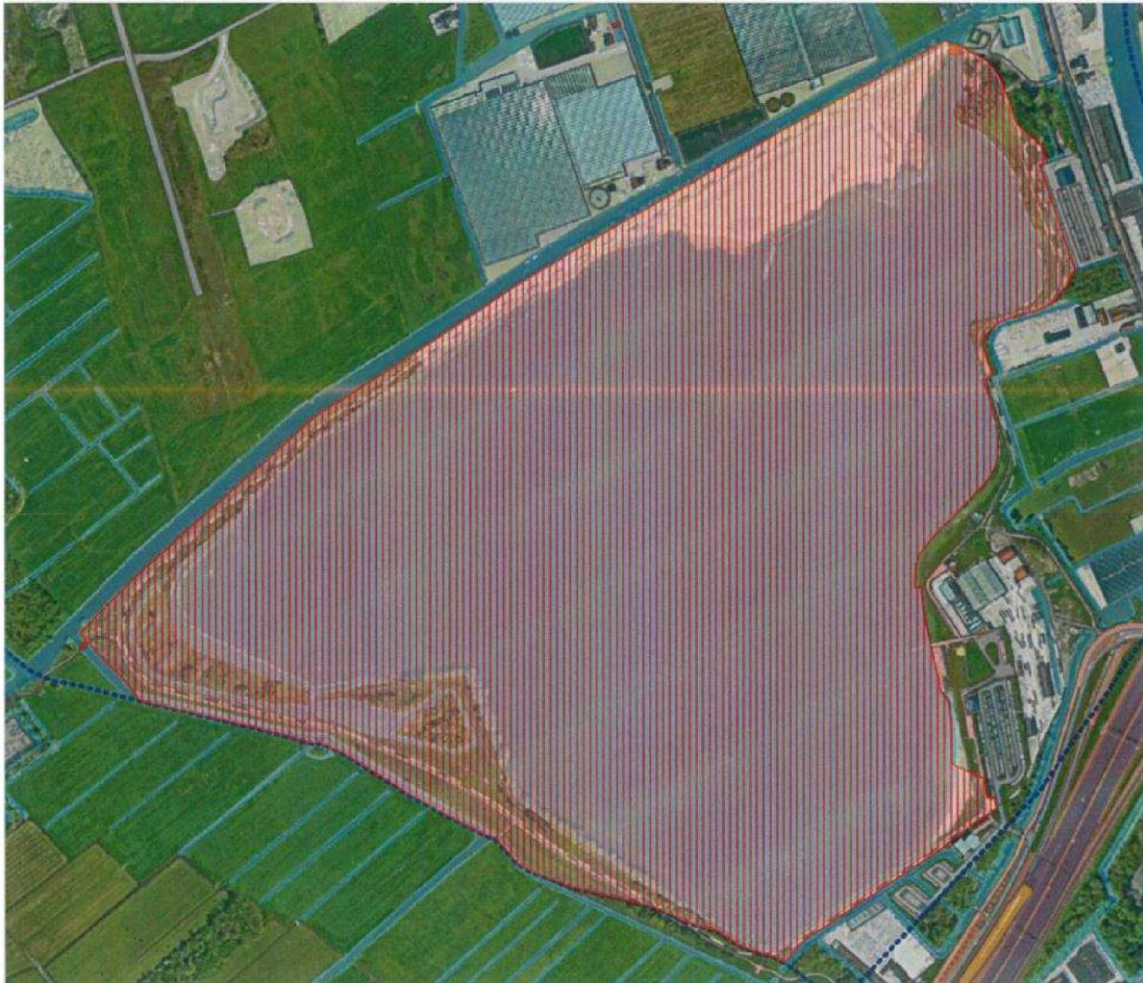
Kaart huidige noodverordening Valkenburgse Meer