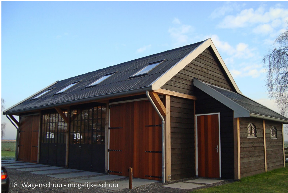
18. Wagenshuur- mogelijke schuur