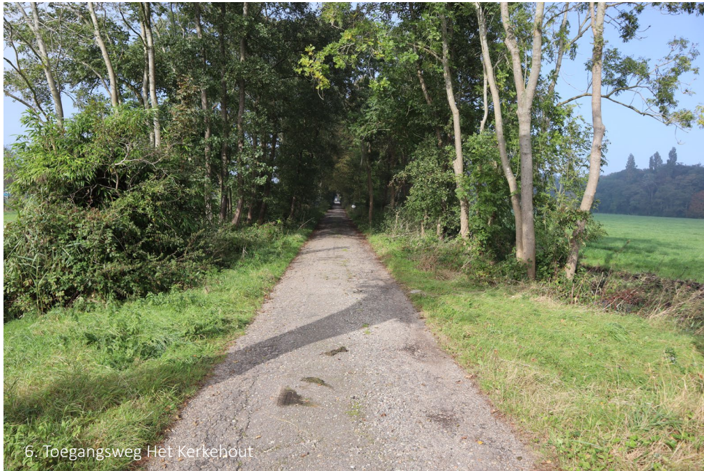
6. Toegangsweg Het Kerkehout