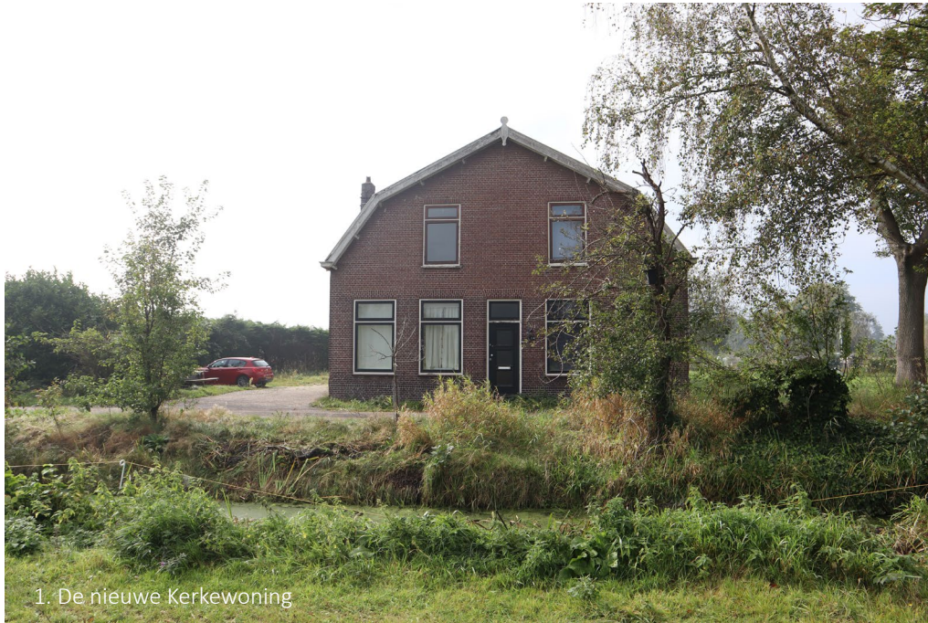
1. De nieuwe Kerkewoning