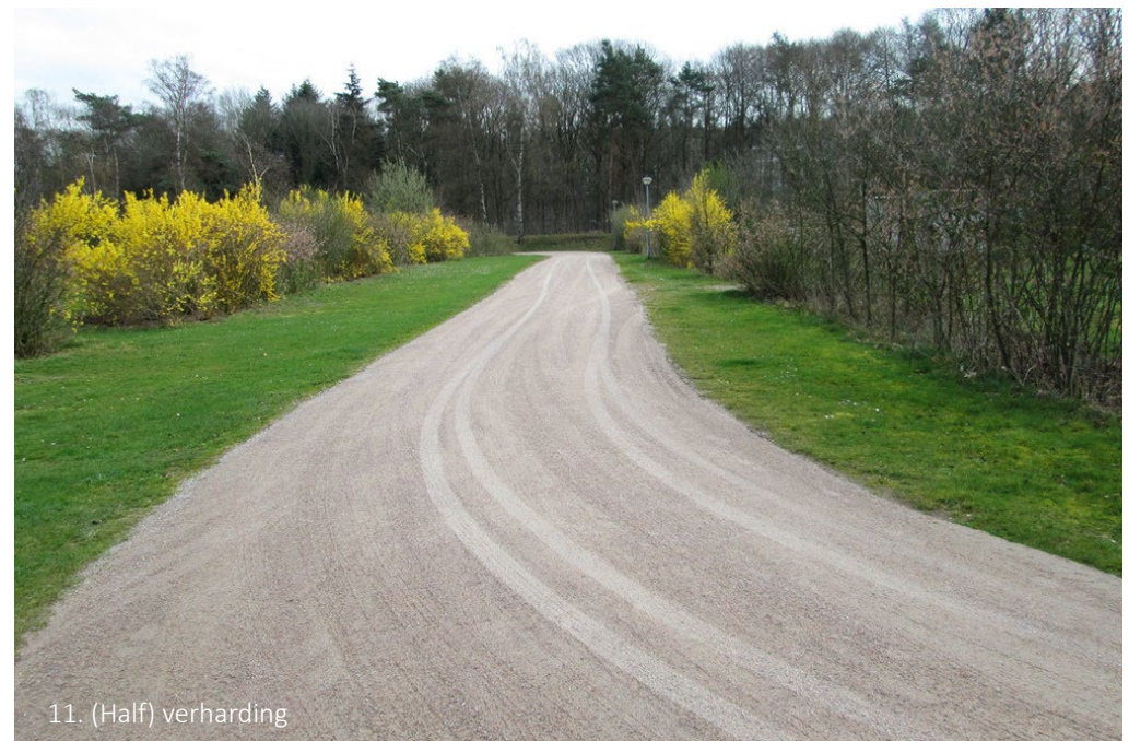
11. (Half) verharding