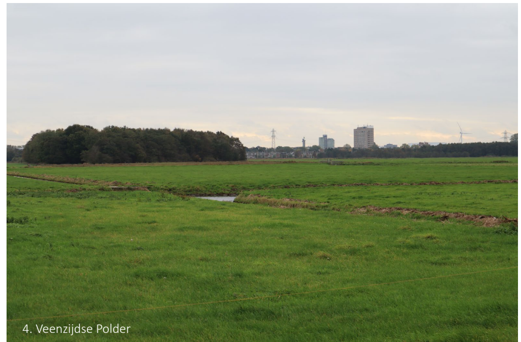
4. Veenzijdse Polder

De wijk Kerkehout bestaat uit een kern met voornamelijk kleine eengezinswoningen. Aan de randen van de wijk staan de grote villa's met veel bos.