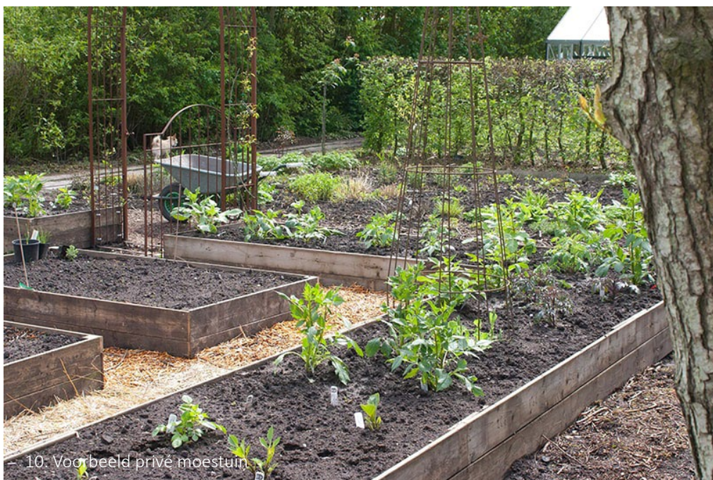
10. Voorbeeld privé moestuin