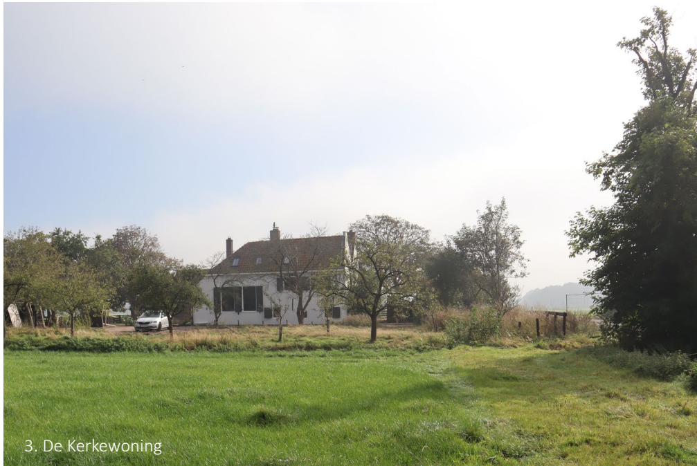
3. De Kerkewoning