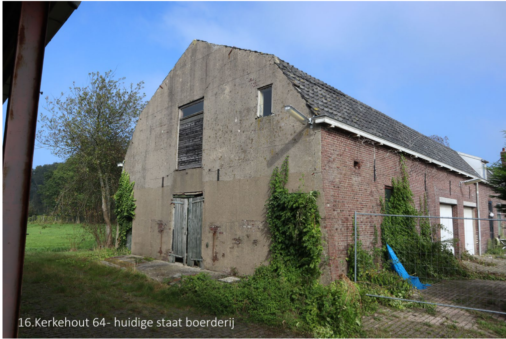
16. Kerkehout 64- huidige staat boerderij