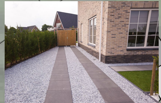
Oprit voorzien van grind