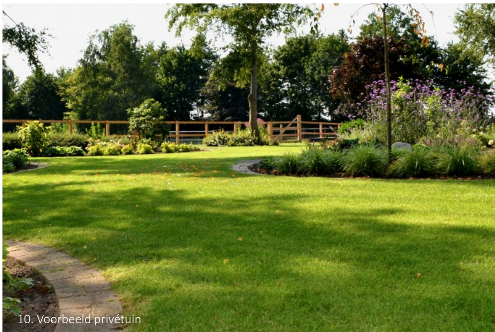
10. Voorbeeld privétuin