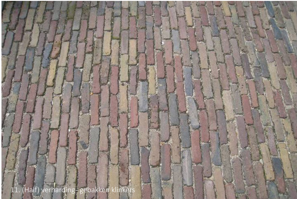
11. (Half) verharding- gebakken klinkers