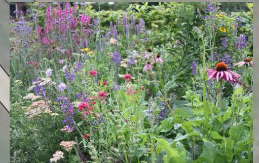
Melange van inheemse bloemen- en plantensoorten