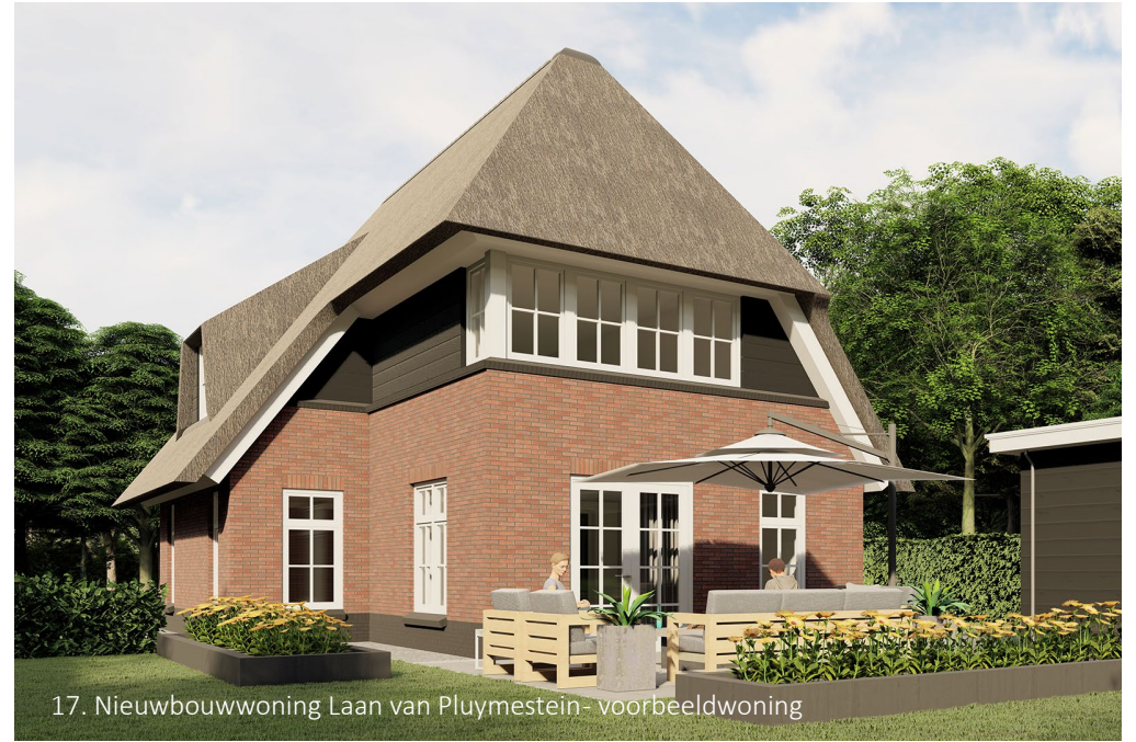
17. Nieuwbouwwoning Laan van Pluymestein- voorbeeldwoning