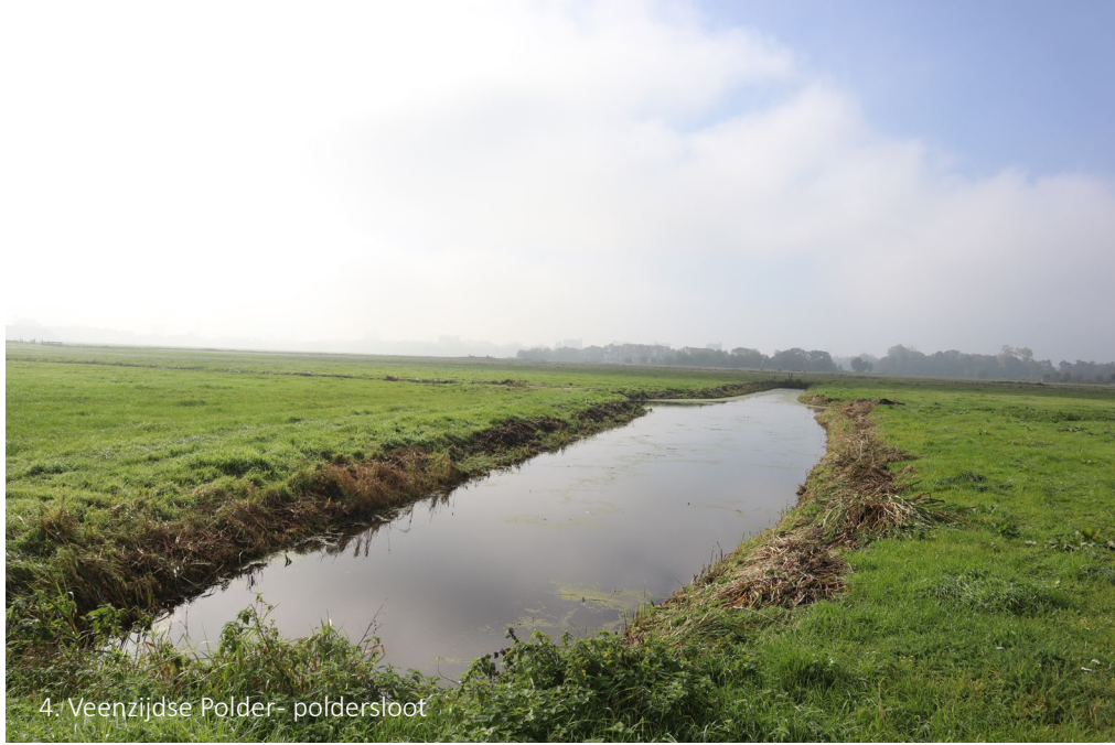
4. Veenzijdse Polder- polderstoot