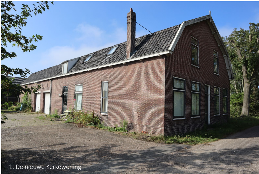
1. De nieuwe Kerkewoning