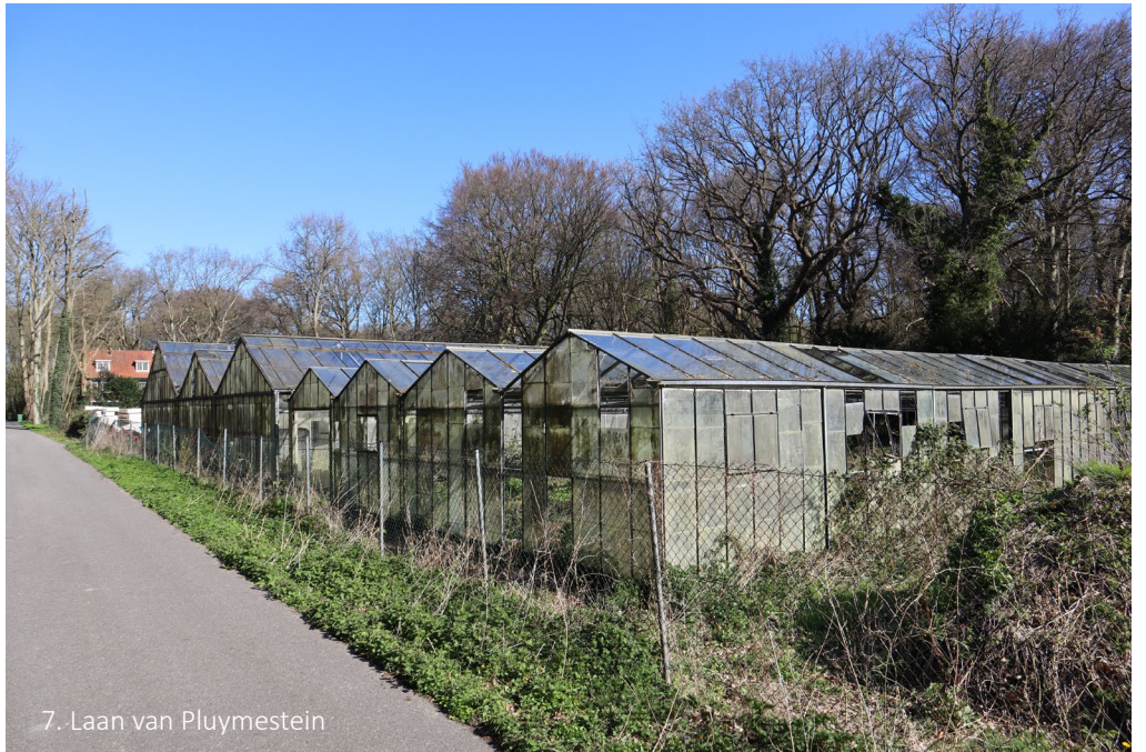
7. Laan van Pluymestein