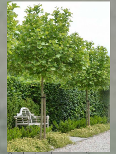
Beplanting langs oprit