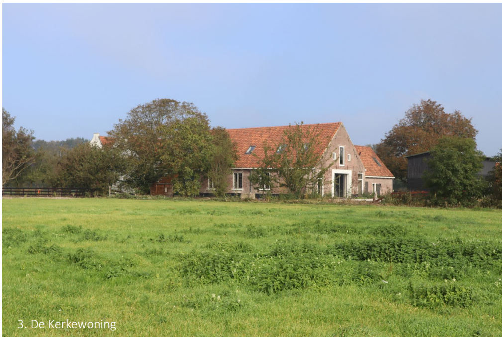
3. De Kerkewoning