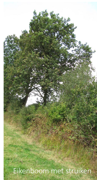
Eikenboom met struiken