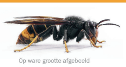
Op ware grootte afgebeeld

Lees in het kader rechts wat u het beste kunt doen als u een voorjaarsnestje van de Aziatische hoornaar aantreft.