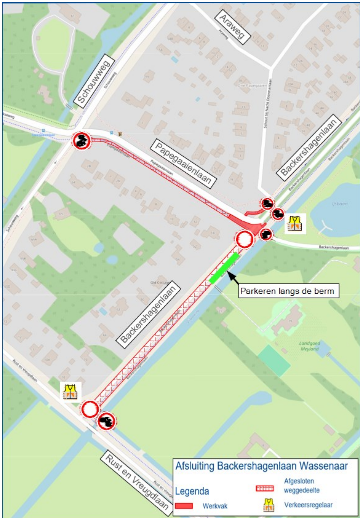
Figuur 1 Afsluiting fase 1