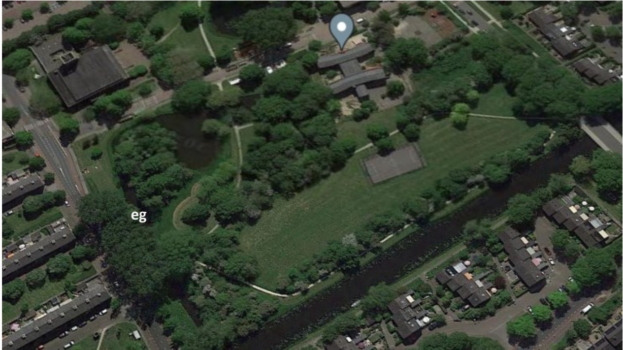
Figuur 1. Luchtfoto Westelijk deel park Deijleroord..

Het zoekgebied is gevonden in het westelijk deel van park Deijleroord en wordt begrensd door Van Groeneveltlaan, Burmanlaan, Van Cranenburchlaan en de Zijlwating. Zie ook paragraaf 3.2.