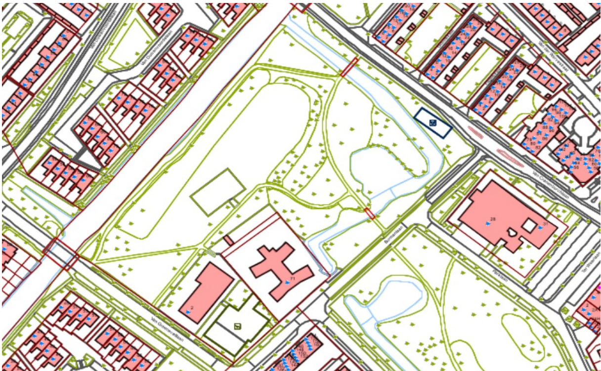
Figuur 2. Uitsnede kadastrale kaart.