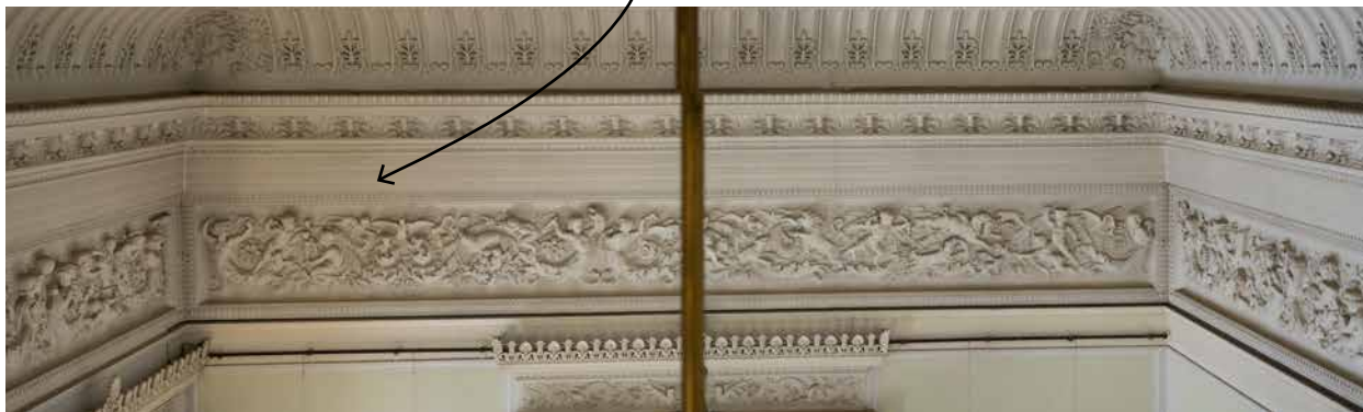
HET STUCFRIES IN DE GROOTE ZAAL VAN DE PAAUW, 1858

HUGO BÜRKNER, ARCHITEKTURMUSEUM, TECHNISCHE UNIVERSITÄT BERLIN, INV.NR. F 9108