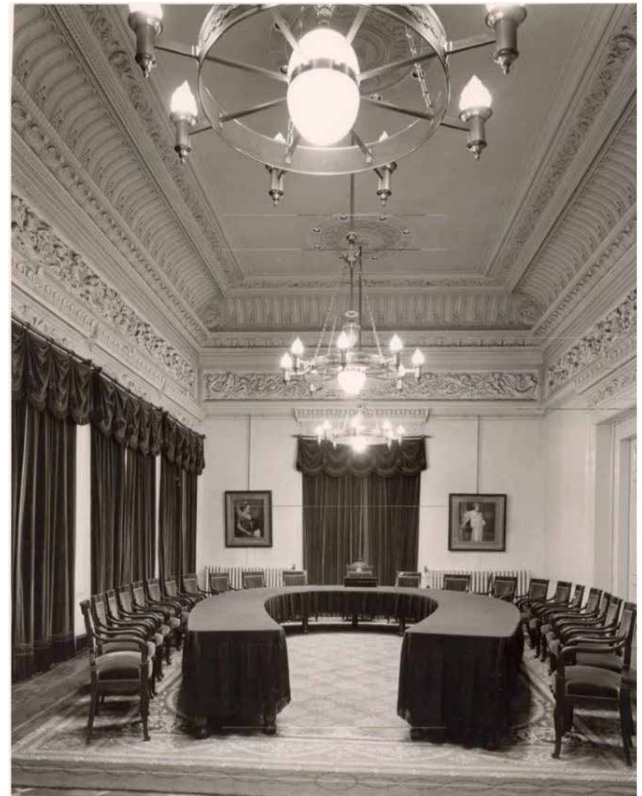
DE RAADZAAL IN 1962. GEMEENTEARCHIEF WASSENAAR, INV.NR. 02523