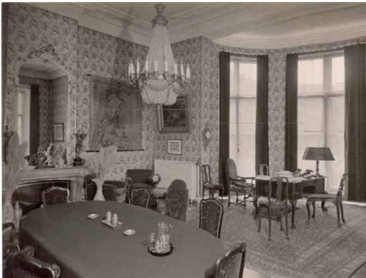
DE BURGEMEESTERSKAMER ROND 1935. GEMEENTEARCHIEF WASSENAAR, INV.NR. 02518

De Paauw beschikte over genoeg representatieve vertrekken: de vestibule, de voormalige balzaal (raadzaal), en de werkkamer van de prins (de burgemeesterskamer). De overige ruimten werden op pragmatische wijze als kantoren ingericht. Dit kwam de uitstraling van de monumentale ruimten niet altijd ten goede. Zo was de huidige tuinzaal met tussenwandjes als kantoor in gebruik. De voormalige adjudantenkamer werd opnieuw ingedeeld als gang, pantry en bodekamer. Na de bouw van het nieuwe gemeentekantoor op de Johan de Wittstraat in het midden van de jaren '80 kreeg het gebouw weer wat meer 'lucht' en werden enkele representatieve vertrekken hersteld en ingericht als expositieruimte.