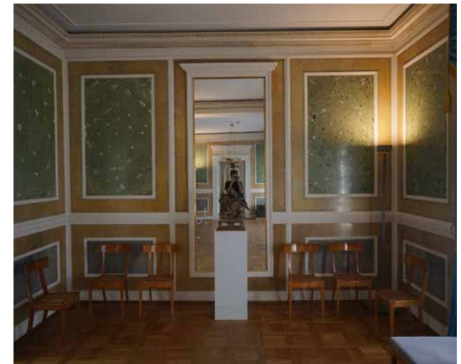
SCHLOSS BRANITZ, BRANITZ