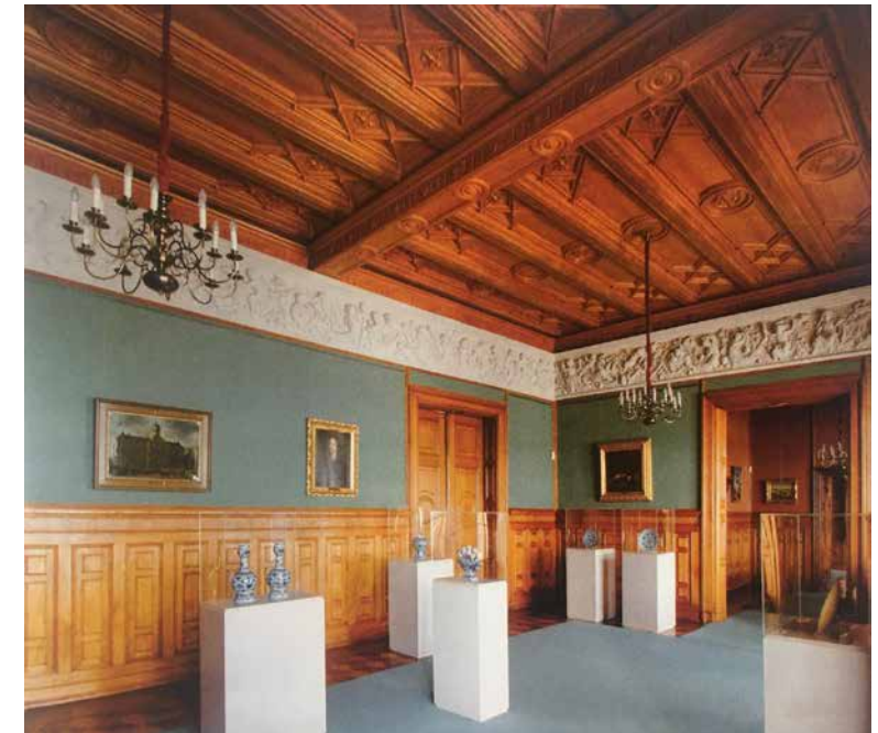
DE BILLARDZIMMER IN SCHLOSS SCHWERIN, 1855