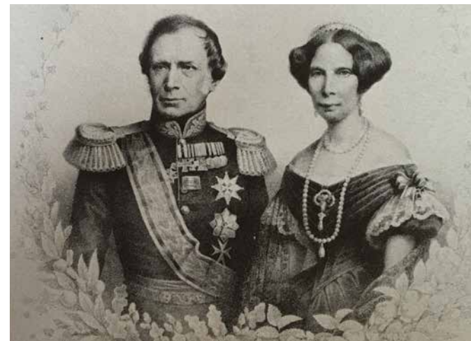
prins Frederik (1797-1881)

Het feit dat deze Pruisische bouwwerken alle tot Unesco Werelderfgoed zijn aangewezen, benadrukt het internationale kaliber van De Paauw.