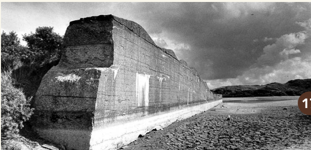
17. De tankmuur in De Pan van Persijn in 1998. Rondom de muur is nu meer begroeiing.

Hier ben je aan het andere uiteinde van de tankgracht. Aan beide zijden van de gracht werd een strook van 200 meter breed vrijgehouden van begroeiing. De Duitsers hadden zo een vrij schietveld en de vijand kon zich niet verschansen. In de oorlog liep de gracht iets verder door en sloot aan op een tankmuur en drakentanden in het duingebied Berkheide. Aan de overzijde van de tankgracht ligt het voormalige vliegveld. Lees er meer over op het informatiepaneel.