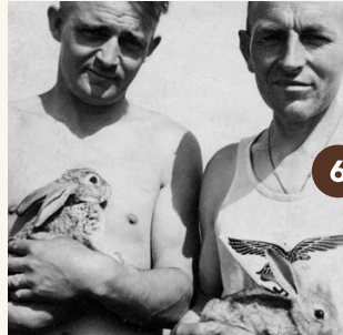
6b. Duitse soldaten met door hen gefokte konijnen (1941).