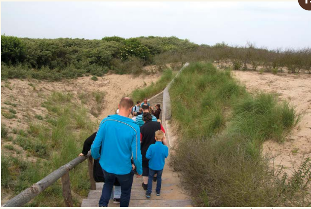
13. De ingang van de vleermuisbunker aan de Wassenaarseweg (2018).