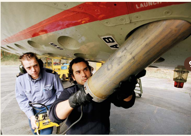
9. Het plaatsen van een sonarboei aan de onderzijde van de Lockheed P-3C Orion (1994).