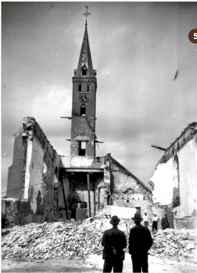
5. De Hervormde Kerk na de capitulatie van Nederland (mei 1940).

Ga verder op het fietspad aan de noordzijde van de Ir. Tjalmaweg (N206). Sla bij fietsknooppuntbord 89 linksaf de Broekweg op en volg deze tot aan het Castellumplein.