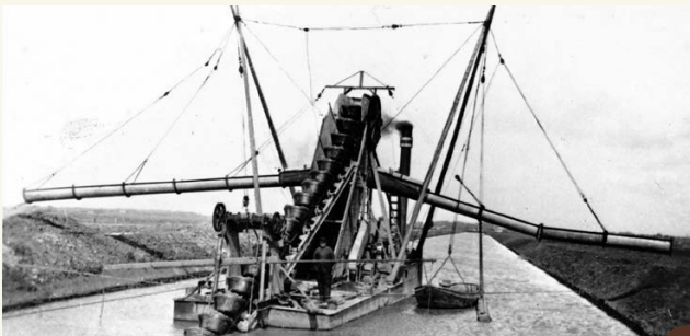
16. De tankgrachten werden met enorme baggermolens in een paar maanden tijd gegraven.

vrouwen op de hoek van de Katwijkseweg en Ruigelaan een tentenkamp in. Ze bleven er veertien dagen. Met hun protest wilden zij de Nederlandse regering ervan overtuigen dat de Orions geen atoombommen moesten gaan uitvoeren. De vrouwen vonden dat juist zij dit protest moesten voeren omdat vrouwen in oorlogstijd vaak slachtoffer zijn. Hun protest was in die tijd een van de vele protesten tegen atoombommen in Nederland.