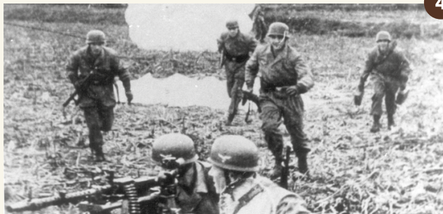
4. Meidagen 1940: Duitse parachutisten zijn op en rond het vliegveld geland.

De herinnering aan Vliegfeld Valkenburg en haar rijke geschiedenis levend houden, dat is wat Stichting Historie Vliegfeld Valkenburg wil. Gebouw 250 op het voormalige marinevlieggkamp verandert in een bezoekerscentrum met een permanente expositie, thema-exposities, een veteranencafé en lesmogelijkheden. Kijk voor openingstijden op www.vliegveldvalkenburg.nl .