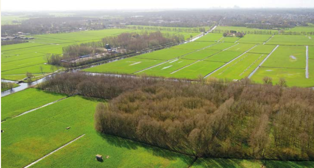
11b. De tankgracht, ooit bedoeld om vijandelijke tanks tegen te houden, vormt nu een verbinding tussen de natuurgebieden Berkheide en de Ommidijkse polder (2020).

zakten tot aan hun assen in de drassige grond. De volgende groep week daarom uit naar het strand. Nog dezelfde dag heroverden Nederlandse soldaten het vliegveld. De overwinning was van korte duur, een paar dagen later capituleerde ons land. Na de oorlog werd op deze plek nog meer geschiedenis geschreven toen het vliegveld een van de marinevliegkampen van de Marineluchtvaartdienst werd. Links zie je een tankgracht. Die moest voorkomen dat de geallieerden het vliegveld konden oprijden en de Stützpunktgruppe Katwijk zouden binnendringen. De gracht was onderdeel van de Duitse verdedigingswerken van de Atlantikwall . Hitler gaf in 1941 opdracht om deze 5000 kilometer lange verdedigingslinie langs de kust van Noorwegen tot aan de Frans-Spaanse grens te bouwen. In het bos voor je liggen bunkers verscholen. Een paar liggen rechts in het weiland. In de verte is de verkeerstoren te zien. Kijk op het informatiepaneel om meer te weten te komen.