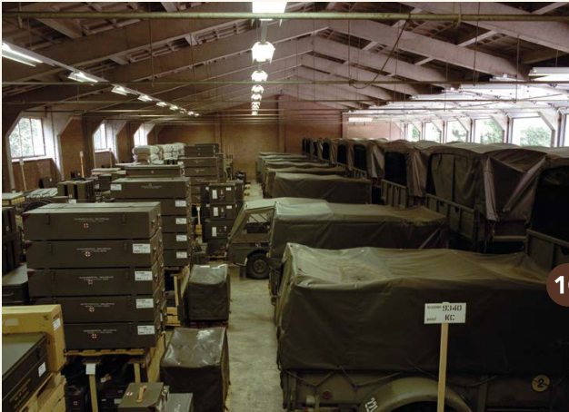
10. Een met Maaldrift vergelijkbaar mobilisatiecomplex in Mijdrecht (1992).

Op de foto zie je hoe zo'n boei via de onderzijde in het vliegtuig werd geplaatst. Daarna controleerde de monteur het contact met de boei. Was dat in orde, dan was de boei klaar om tijdens de vlucht te worden uitgeworpen. Er waren dertien Orions op het Marinevliegkamp Valkenburg gestationeerd.