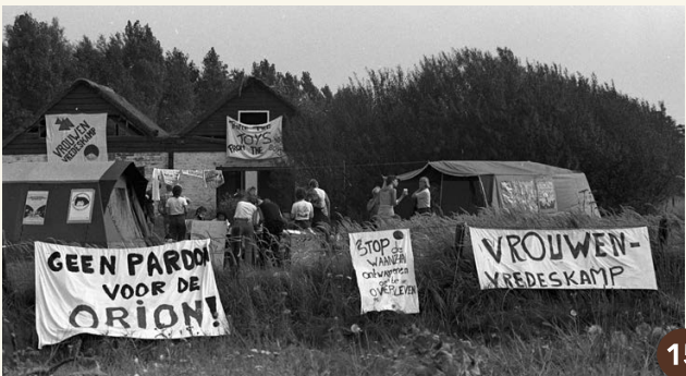
15. Vrouwen richten vlakbij het vliegveld een Vrouwen Vredeskamp in (1982).

Na 1996 zijn de bollenbedrijven verplaatst. Het gebied is veranderd in een glooiend terrein met beken en plassen. Er zijn al meer dan honderd soorten vogels waargenomen. Naast de hier uitgezette Schotse Hooglanders en Koniks paarden komen hier reeën, vossen en hazen voor. Je kunt er wandelen over het speciaal aangelegde graspad. Het natuurgebied is zó bijzonder dat het op Europees niveau wordt beschermd in het Natura 2000-programma.