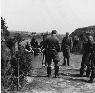
6a. Badtijd voor de honden (1941). De Duitsers hielden ze als huisdieren. Op de achtergrond een Duits jachtvliegtuig.

Ga voor het Castellumplein rechtsaf naar de Kruisweg en sla rechtsaf naar de Burg. Lotsystraat. Ga op de T-splitsing rechtsaf naar de Marinus Poststraat. Sla op de T-splitsing linksaf en bij de volgende T-splitsing rechtsaf en volg de Achterweg. Steek de Ir. Tjalmaweg (N206) over, sla linksaf en blijf de Achterweg volgen. Ga bij de T-splitsing rechtsaf de Zonneveldslaan in.