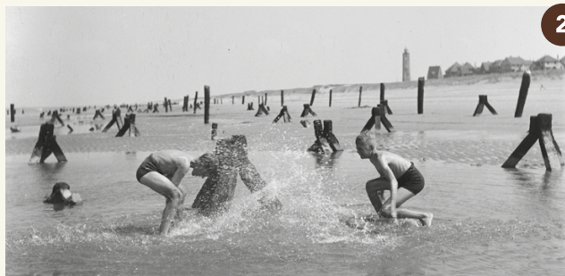
2. Tetraëders op het strand vlak na de oorlog (1945).

Je staat hier op de 'Brink', het centrale deel van het Barakkendorp. Hier waren in de Tweede Wereldoorlog Duitse militairen gelegerd die op het vliegveld werkten. De Duitsers ontwierpen de barakken met opzet als gewone huizen en boerderijen zodat het militaire complex vanuit de lucht op een dorp leek, waardoor geallieerde vliegers werden misleid. Lees er meer over op het informatiepaneel.