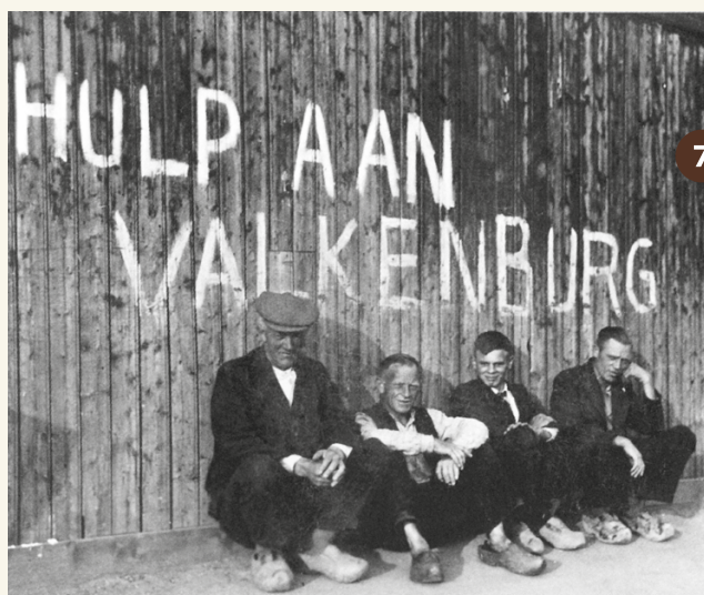
7. Na de gevechten in de meidagen van 1940 wordt voor de zwaar getroffen Valkenburgers een noodactie opgezet (1940).

Baggermolen waarmee de tankgrachten werden gegraven (1942-1943).