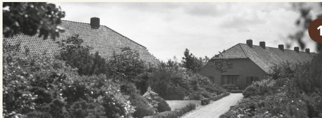
1. Doorkijk in het Barakkendorp (rond 1950).