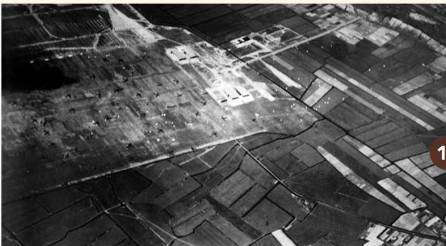
11a. Vliegveld Valkenburg in de meidagen van 1940, bezaaid met gestrande Duitse transportvliegtuigen.

De meeste van de MOB-complexen stammen uit de tijd van de Koude Oorlog. In de periode 1951-1961 zijn er in heel het land ongeveer honderd gebouwd.