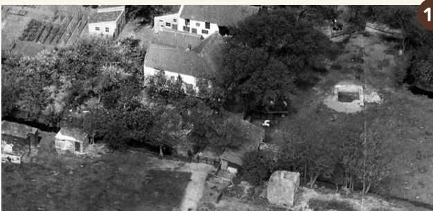
12. Rondom de boerderij liggen Duitse verdedigingswerken (circa 1955).

In de kom van de Kokshornlaan en Oostdorperweg is honderd meter van de weg af vlakbij boerderij Bellesteyn een kleine bakstenen manschappenbunker voor zes man te zien. Het oorspronkelijk met aarde bedekte bunkertje maakte deel uit van een geschutsbatterij van de Duitse landmacht. Het is nu als schuurtje in gebruik. De geschutsbatterij had vier kanonnen waarmee zowel richting zee als land kon worden geschoten. In de oorlog waren er zo'n tien bouwwerken voor de 120 manschappen en hun voorraden, wapens en munitie. Ook verbleven zij in door hen gevorderde woningen. Inmiddels zijn de meeste bunkers afgebroken.