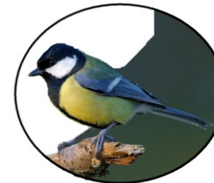
Tuin bewonende vogels