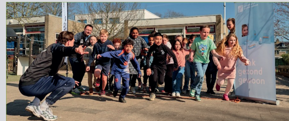
Leerlingen van de St. Jozefschool in actie

In een estafette-achtige opzet gaven leerlingen stappentellers door aan de volgende groep, waardoor het gezamenlijke aantal stappen steeds verder opliep. Met deze actie werd niet alleen ingezet op een nieuw record van 1,5 miljoen stappen, maar vooral op het vergroten van het plezier in bewegen en het belang van een actieve, gezonde leefstijl onder kinderen.