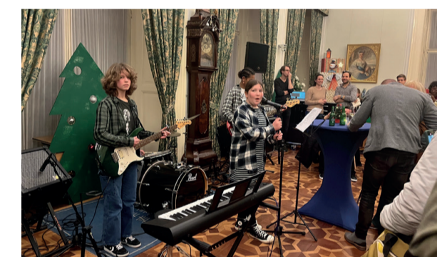
Band van het Adelbert College