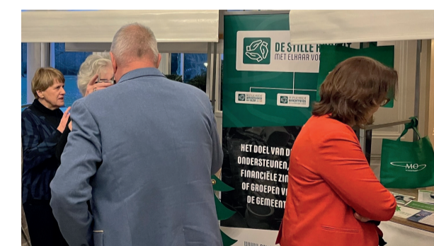
Kraampje de Stille Kracht