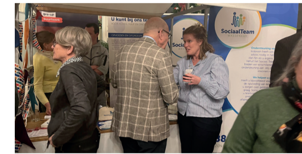
Kraampje Sociaal Team Wassenaar