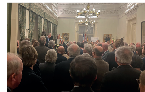
Nieuwjaarstoespraak burgemeester in volle raadzaal