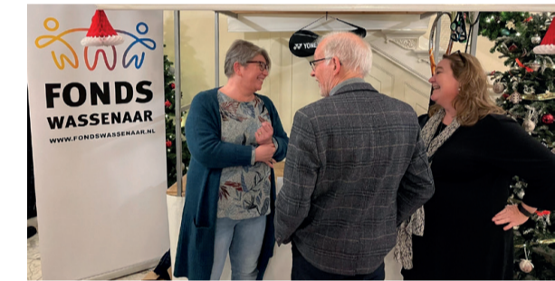
Kraampje Fondus Wassenaar