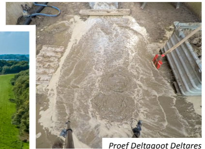
Proef Deltagoot Deltares