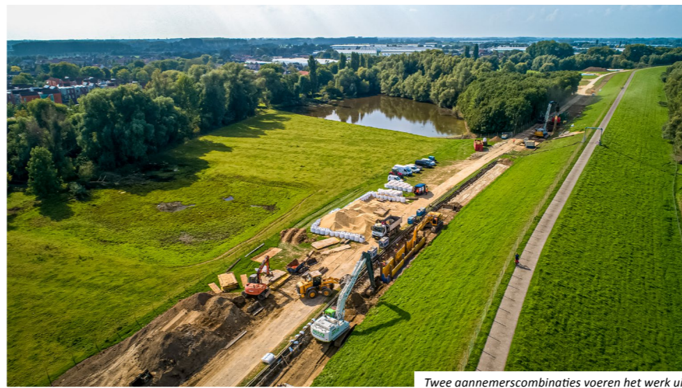
Twee aannemerscombinaties voeren het werk uit