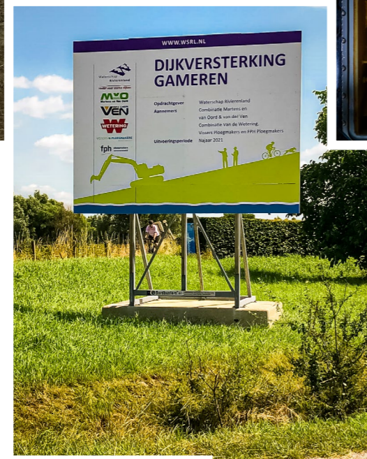
Bouwbord in Gameren