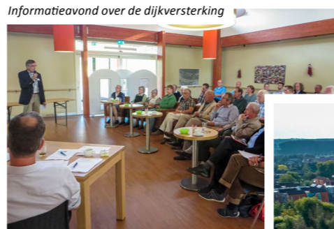
Informatieavond over de dijkversterking