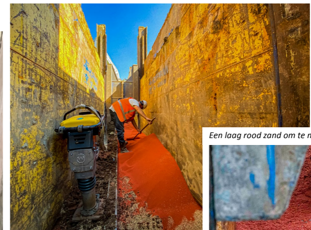
Een laag rood zand om te monitoren