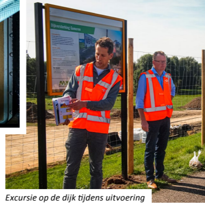
Excursie op de dijk tijdens uitvoering