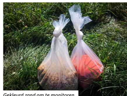
Gekleurd zand om te monitoren