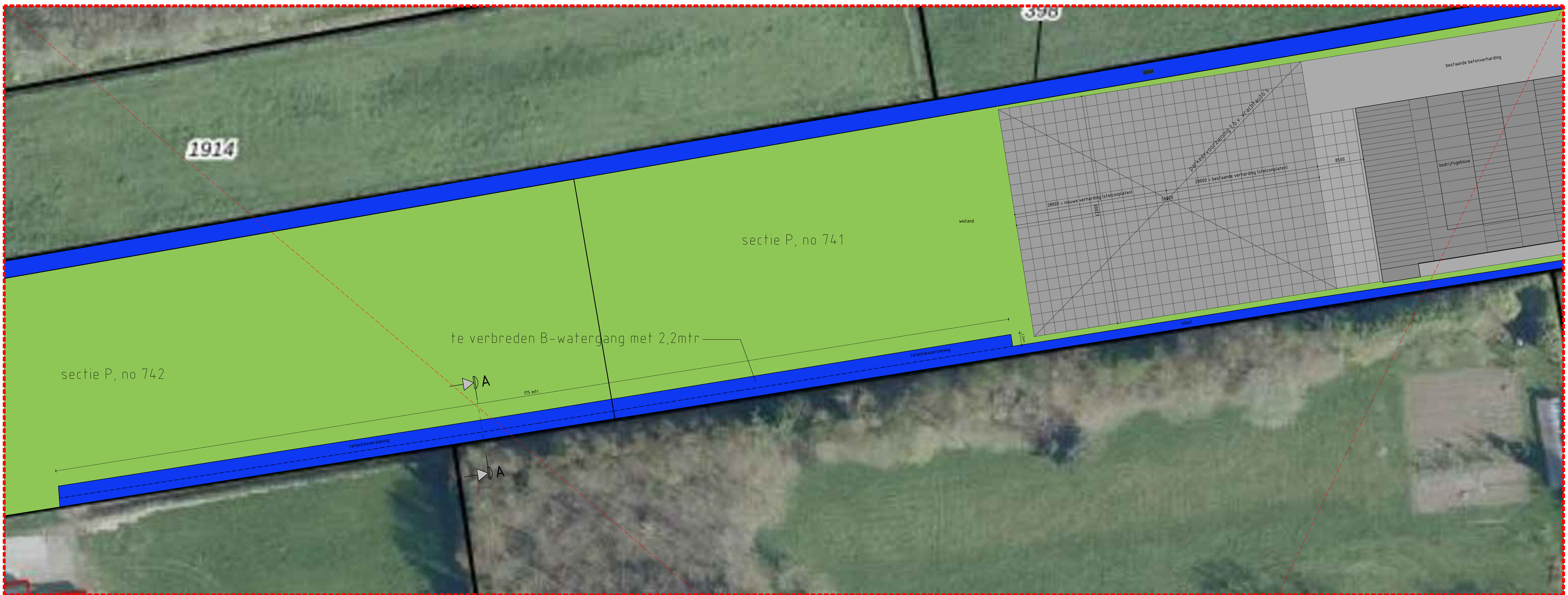
Plattegrond parkeervoorziening schaal 1 op 250