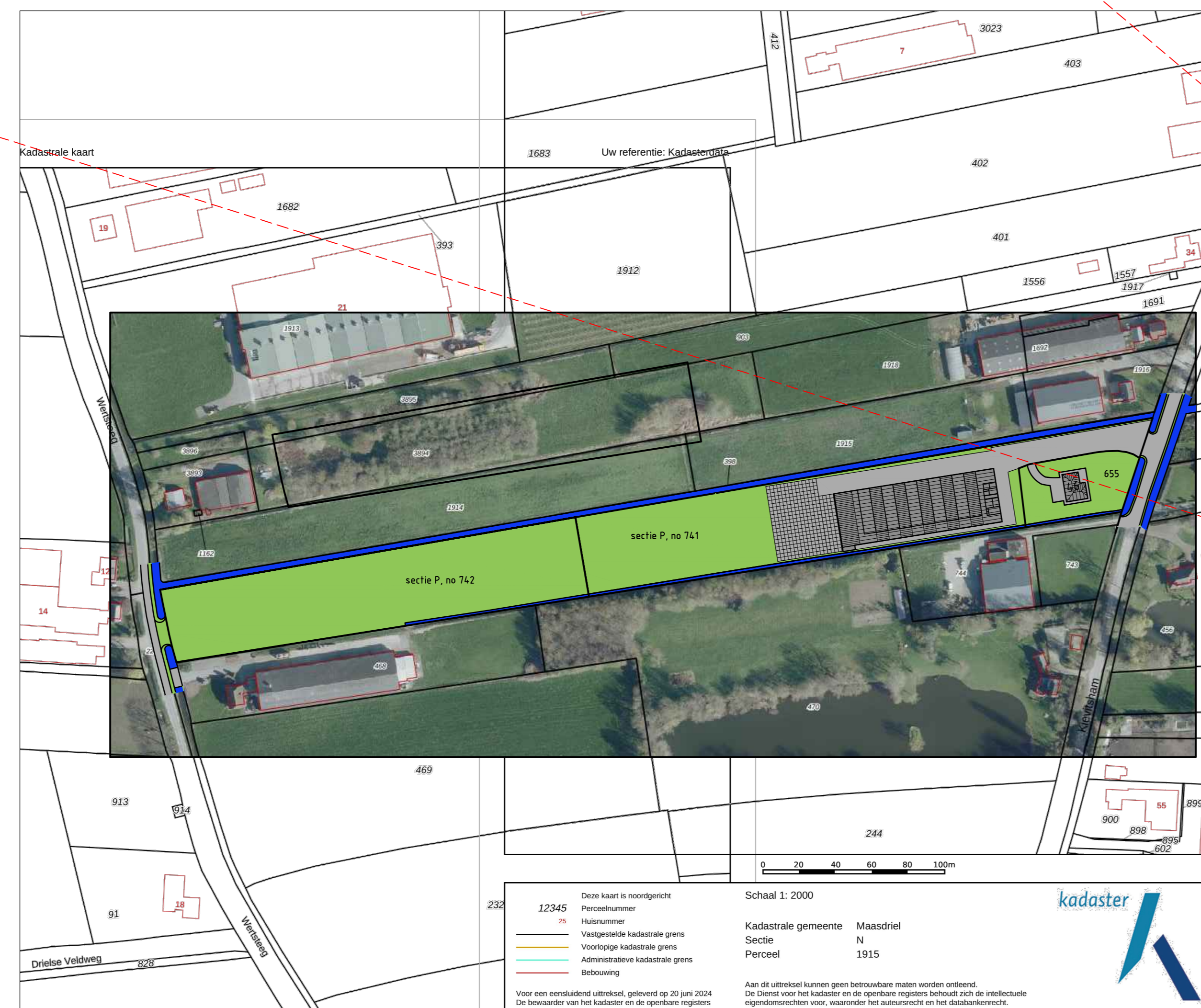
Situatieschets (bestaande situatie) schaal 1 op 2000

compensatie hemelwater totaal oppervlak parkeervoorziening 2352m 2 2352m 2 × 43,6 mm = ±103m 3 waterberging compensatie geschied d.m.v. B-watrgang aan de zuidzijde van het perceel met 2,2m te verbreden over een lengte van 170m totaal opp. van het uit te graven gedeelte = 175 × 2,2 = 385m 2 aantal te compenseren m 3 wordt berekend op basis van een peilafwijking van 30cm totaal gecompenseerde waterberging = 385m 2 × 0,3m = 115,5m 3 115,5m 3 > 103m 3 => dus voldoet