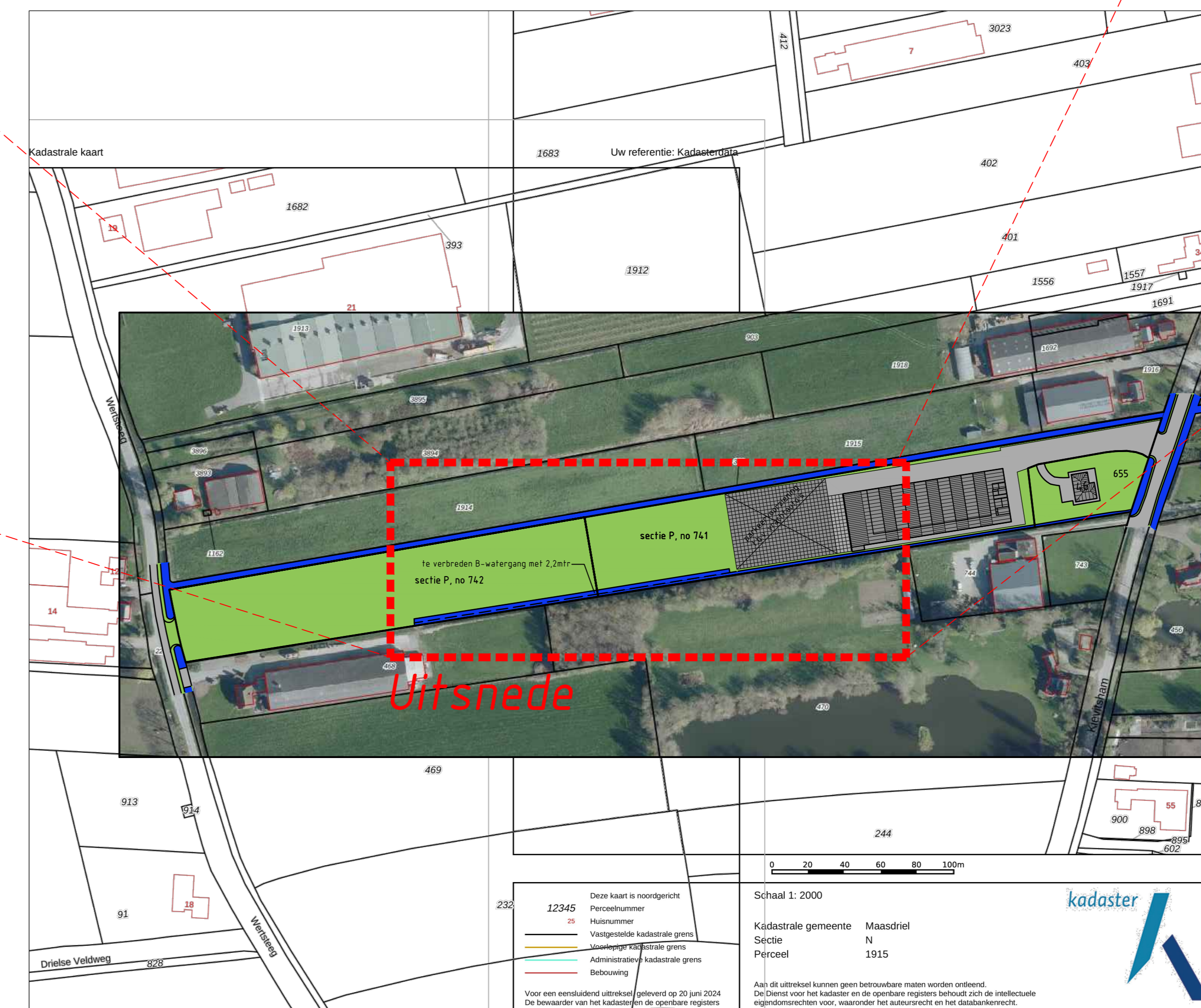
Situatieschets (nieuwe situatie) schaal 1 op 2000