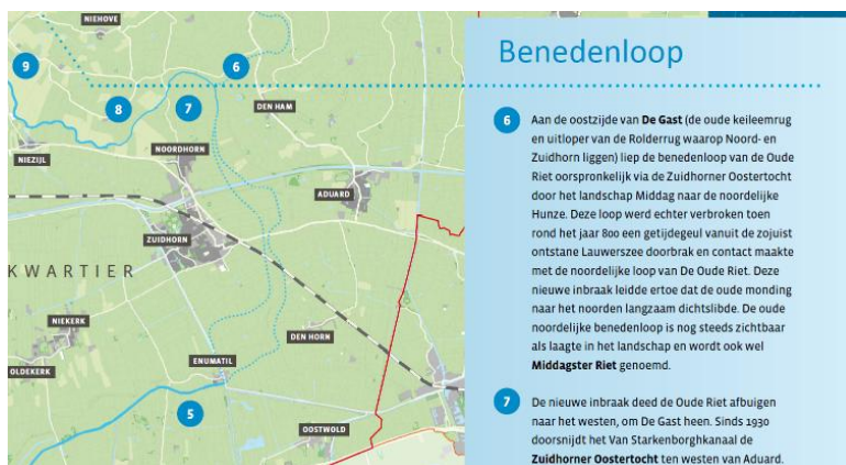
Deel van een paneel uit de tentoonstelling over de Oude Riet in het Wierdenmuseum in 2021. In lichtblauw de beide reststromen ten oosten van Zuidhorn en Noordhorn

Aanknopingspunten voor onze stichting – deze wijk komt te liggen in het voormalige Oude Riet dal. De gemeentelijke stukken zijn dubbelzinnig: enerzijds staat er dat de Oude Riet hier sinds 1990 is verdwenen, anderzijds dat in de bodem en in het reliëf de Riet nog te herkennen is. Onzes inziens zijn Zuider- en Oostertocht restanten van de Oude Riet en is er zeker sprake van het voormalige Rietdal, waar eeuwen lang zowel een beek als een zeearm stroomden. Zie bijlage 1.