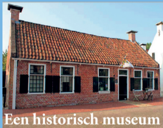
Een historisch museum

Aan de Hofstraat 45, de oudste straat van het kloosterdorp Aduard, is het kloostermuseum Sint Bernardushof gevestigd. Het museum wordt helemaal gerund door vrijwilligers. Zij leiden je rond, schenken koffie en thee voor je in, helpen mee in het museumdepot, klussen in het museum en de tuin. Zij houden het rijke verleden van Atwiduurd levend! Zij vertellen jou de verhalen en zorgen ervoor dat jouw bezoek elke keer weer een bijzondere ervaring wordt. Toppers zijn het!