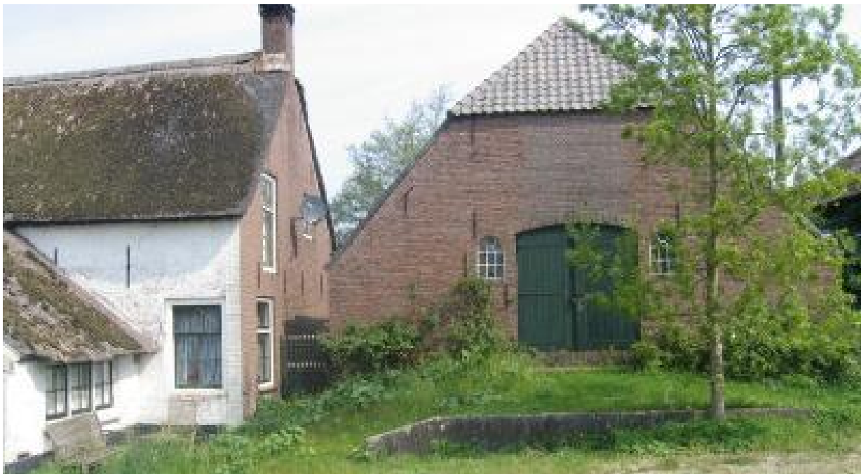
Agrarische bebouwing met karakteristieke en/of beeldbepalende waarde

Agrarische bedrijfsbebouwing in het buitengebied die zijn functie waarvoor deze eerder is bestemd, vergund en gebruikt heeft verloren of op korte termijn gaat verliezen.