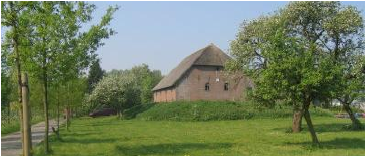
Behoud van monumentale bedrijfsgebouwen door ruime mogelijkheden voor hergebruik