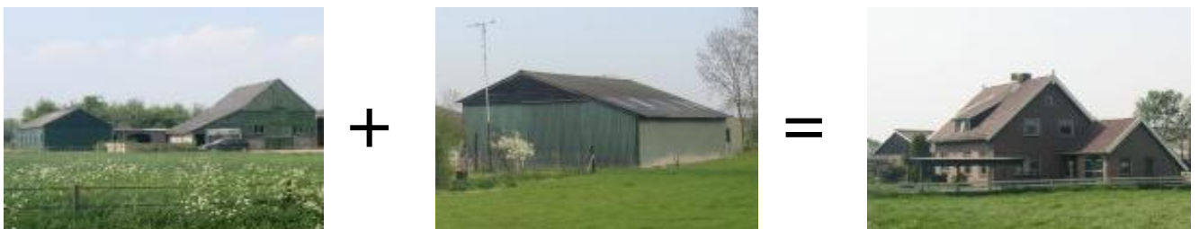
Sanering van verspreid liggende agrarische bebouwing kan een belangrijke bijdrage leveren aan het vergroten van de landschappelijke kwaliteit van het buitengebied

Gemeenten kunnen besluiten om de salderingsregeling te beperken tot een nader te bepalen maximum aantal percelen per keer, de salderingsregeling 'over de gemeentegrenzen heen' toe te staan of deze regeling in het geheel niet toe te passen.