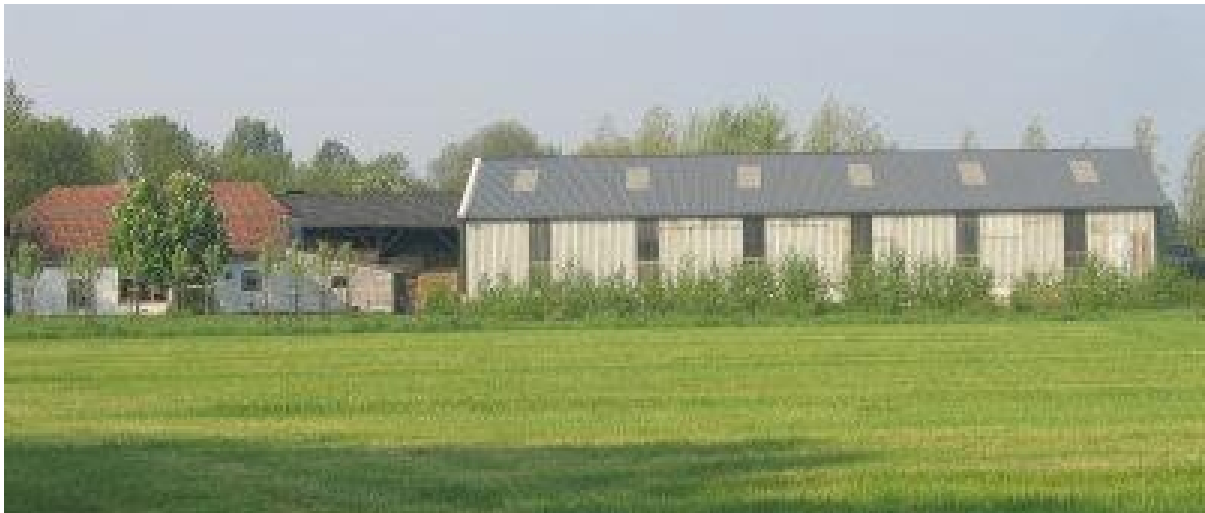
Sloopkosten van vrijgekomen agrarische bebouwing kunnen worden bekostigd uit extra te verkrijgen bouwmogelijkheden

In de paragrafen 3.2 t/m 3.6 wordt uitgebreid ingegaan op de bovengenoemde mogelijkheden. De regeling is bedoeld om waardevolle vrijgekomen agrarische bedrijfsbebouwing te behouden en landschaps-ontsierende bebouwing te saneren om zodoende de ruimtelijke en landschappelijke kwaliteit van het buitengebied te vergroten. Bij de sloop van grote hoeveelheden agrarische bedrijfsbebouwing kunnen de sloopkosten en de restwaarde van de bebouwing worden "terugverdiend" door de bouw van één of meerdere woningen. De sloop van relatief geringe hoeveelheden agrarische bedrijfsbebouwing (< 1000 m 2 ) kan worden "terugverdiend" door de verruimde mogelijkheden die de gemeenten bieden voor de bouw van extra bijgebouwen of uitbreiding van de bestaande woning.