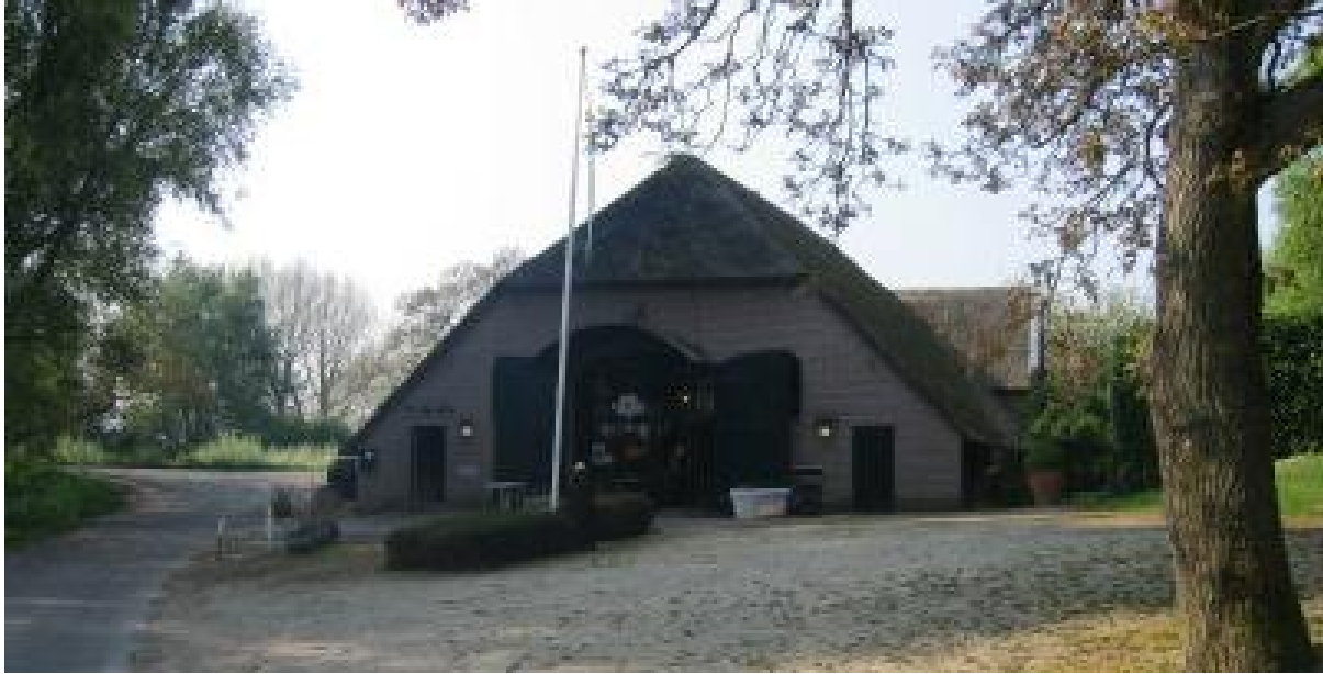
Het buitengebied is een aantrekkelijke vestigingsplaats voor bepaalde bedrijven

Daarnaast willen de gemeenten het vrijkomen van agrarische bedrijfsgebouwen ook aangrijpen voor het vergroten van de ruimtelijke en landschappelijke kwaliteiten van het buitengebied. Dat betekent dat aan hergebruik van de bedrijfsgebouwen een aantal voorwaarden wordt verbonden. Deze voorwaarden zijn: