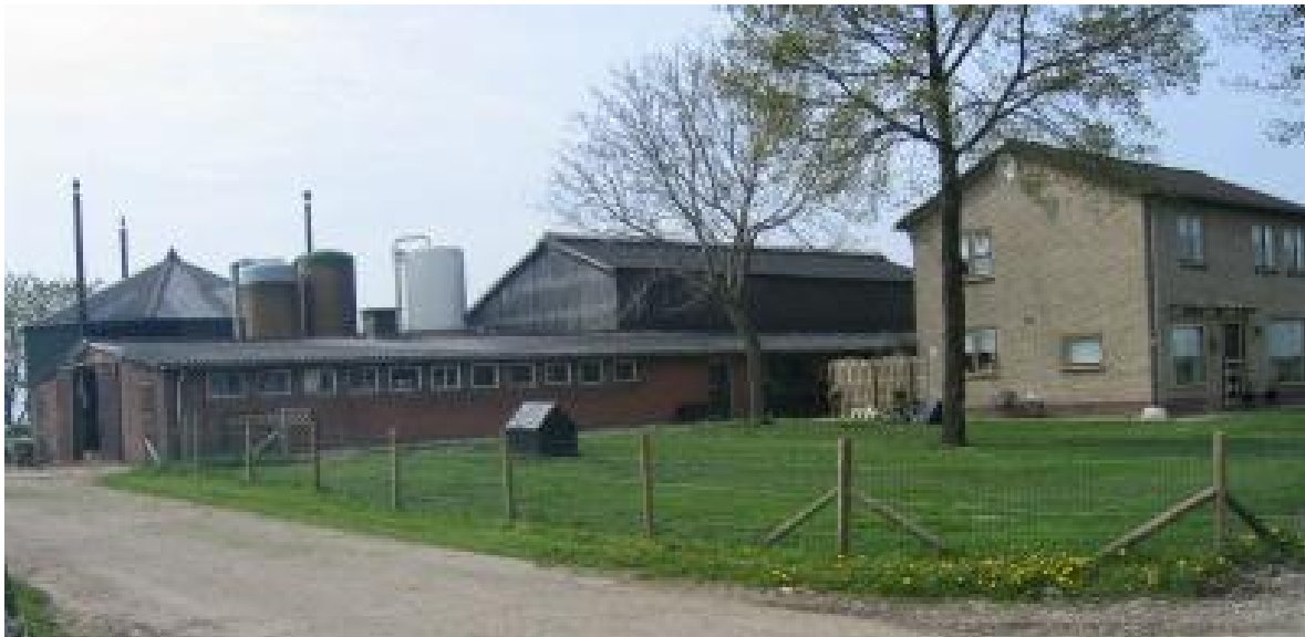
Bij functieverandering moeten alle agrarische gebouwen op het perceel gesloopt worden

Bij het berekenen van de oppervlakte van de gesloopte bedrijfsgebouwen worden overigens alleen de bedrijfsgebouwen (stallen/loodsen/glasopstanden/opslagruimtes) meegerekend. Aan de sloop van bouwwerken, bij recht toegestane bijgebouwen bij de woning, tunnelkassen en overige voorzieningen kunnen dus geen bouw mogelijkheden worden ontleend.