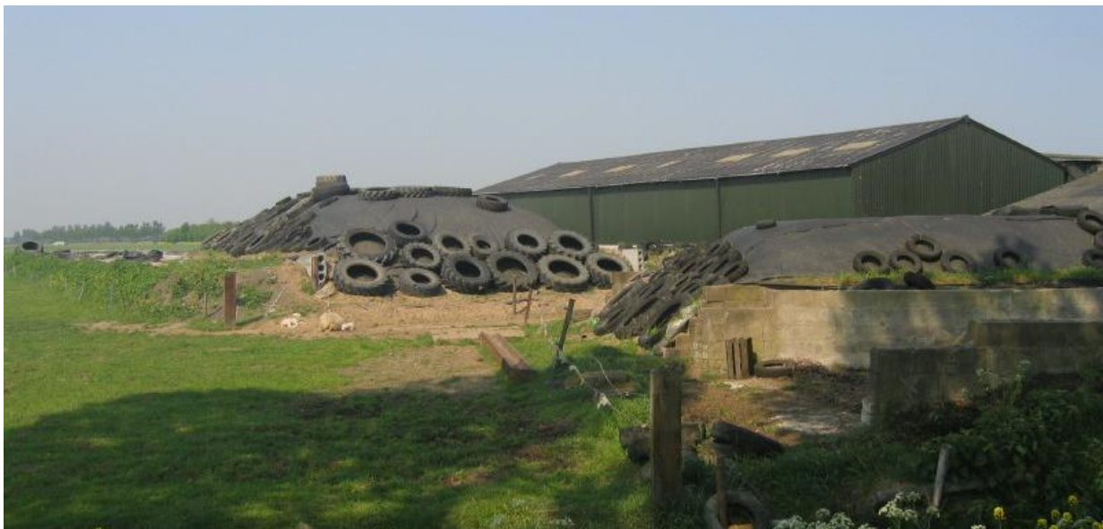
Landschappelijke kwaliteit buitengebied vergroten door sloop van landschapsontsierende agrarische bebouwing