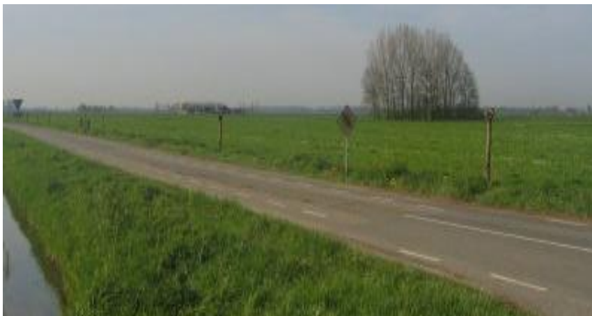
Karakteristiek open komgebied

De komgebieden worden gekenmerkt door hun landschappelijk open karakter. Het zijn laaggelegen en relatief natte gebieden die van oudsher niet geschikt waren voor bebouwing. De gebieden werden veelal gebruikt voor melkveehouderij. In de jaren vijftig en zestig van de vorige eeuw zijn als gevolg van de ruilverkaveling linten van boerderijen gebouwd door de kommen. De agrarische bedrijven die in de komgebieden zijn gevestigd zijn relatief omvangrijke melkveehouderijen. De agrarische bedrijfsgebouwen zijn relatief nieuw en bestaan uit een combinatie van bakstenen schuren en damwandloodsen. De verwachting is dat de agrarische sector in de komgebieden meer toekomstperspectief heeft dan op de oeverwallen. De meeste gronden zullen dan ook agrarisch gebruikt blijven worden. Wel zal door schaalvergroting een deel van de bedrijven verdwijnen waarna de agrarische bedrijfsgebouwen leeg komen te staan. Daarbij gaat het om relatief grote oppervlaktes in de vorm ligboxenstallen. Hergebruik is soms een goede optie maar niet altijd wenselijk vanuit ruimtelijk en landschappelijk oogpunt.