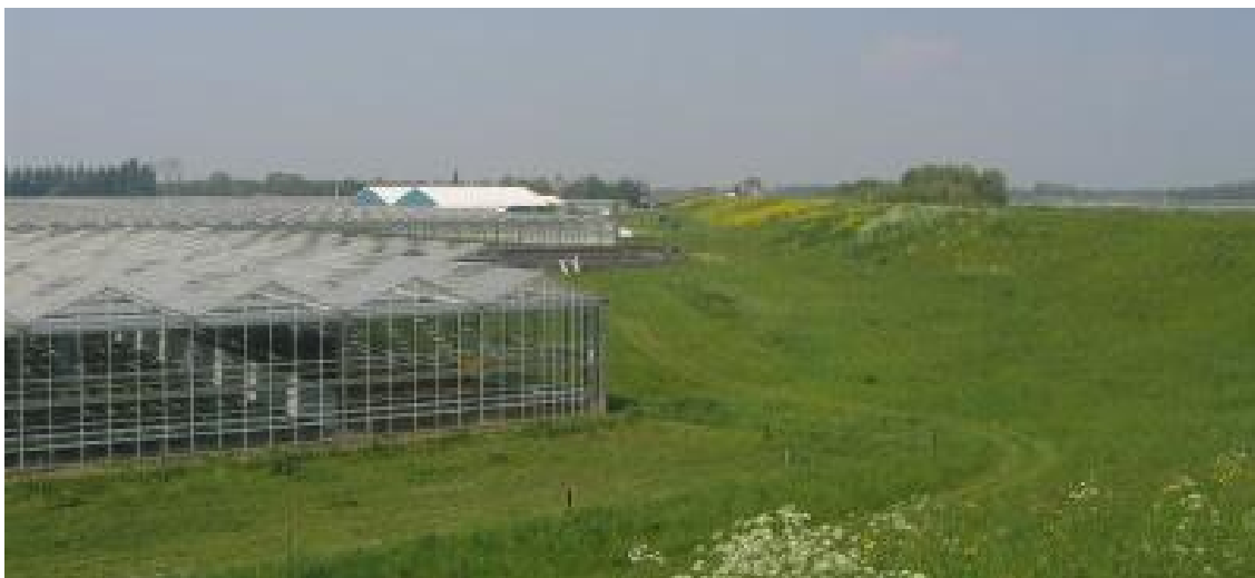
Sloop van kassen ten behoeve van het vergroten van de landschappelijke kwaliteit van het buitengebied

In gebieden die zijn aangewezen als (glas)tuinbouwconcentratiegebied, -intensiveringsgebied of -reserveconcentratiegebied worden geen mogelijkheden geboden voor het oprichten van nieuwe woon- en bedrijfsgebouwen in ruil voor de sloop van leegstaand glas. De bouw van woningen en bedrijfsruimte zou de ruimte voor de glastuinbouw beperken en de grondprijs opdrijven. In de regio Rivierenland zijn delen van de Bommelerwaard en gebieden rond Tuil en Est aangewezen als gebieden waar de (glas)tuinbouw in de toekomst geconcentreerd zal worden.