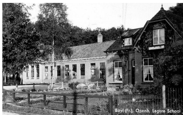
de naastgelegen school is inmiddels gesloopt