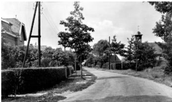
De Hoeve, links de woning, rechts de kerk, ca. 1930

De entree is in de linker zijgevel gelegen en bezit een gemetselde stoep en een verhoogd muurtje waarop een fraai bewerkte houten luifel staat. Door het trasraam en door de rode bakstenen decoratieve metselbanden ter hoogte van de vensters en de bakstenen lijst onder de dakgoot heeft de gevel een horizontale belijning.