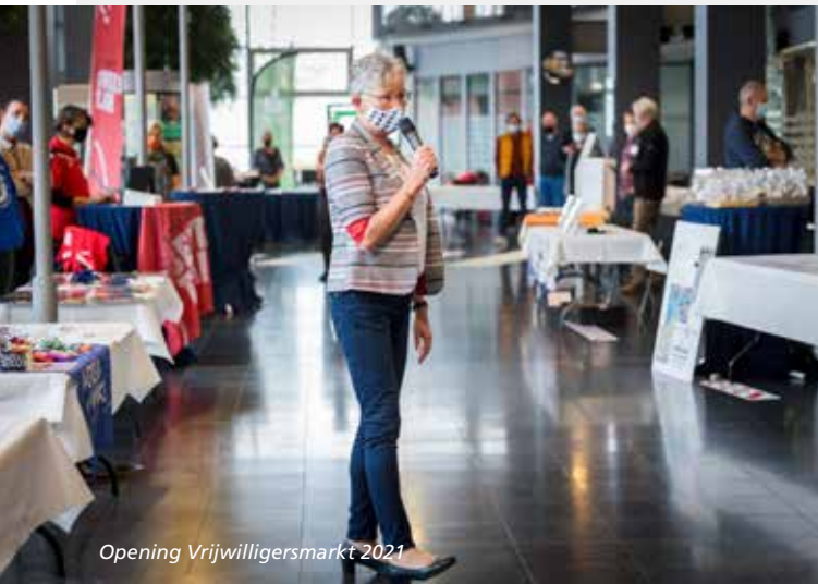
Opening Vrijwilligersmarkt 2021