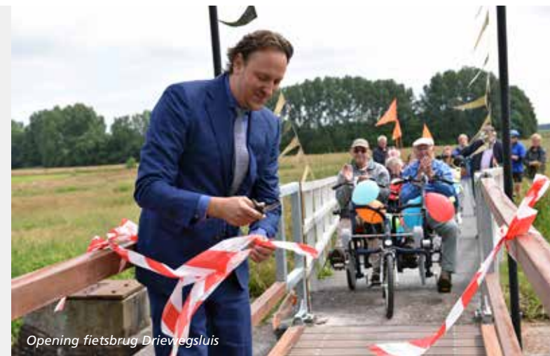
Opening fietsbrug Driewegluis

Weststellingwerf heeft in de provinciale overleggen met alle gemeenten continue aandacht gevraagd voor de snelheid binnen de bebouwde kom. Onder meer hierdoor krijgt het onderwerp snelheid binnen de bebouwde kom (30 is het nieuwe 50) breed de aandacht. Het is een onderwerp dat ook landelijk en op Europees niveau erg actueel is.