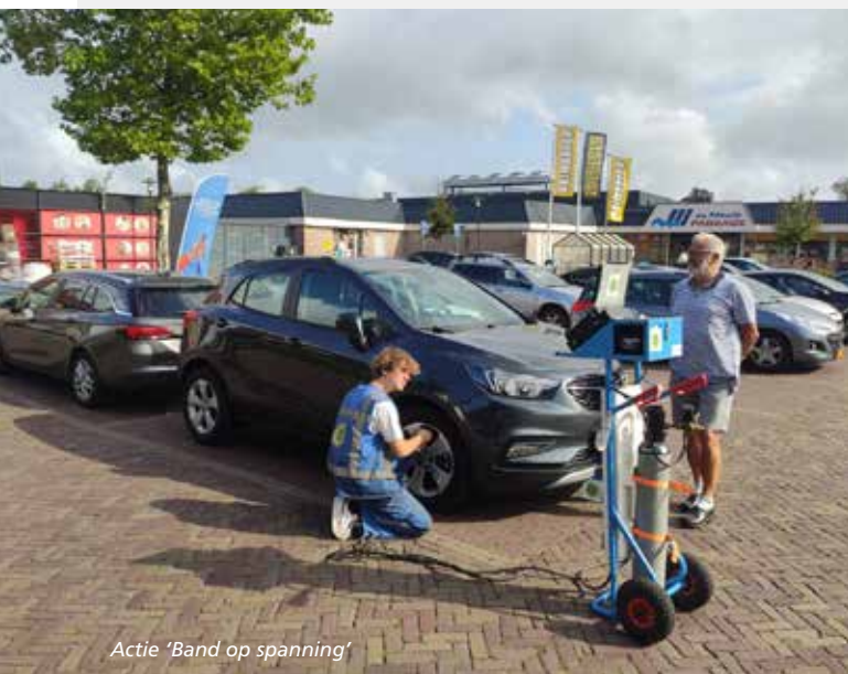
Actie 'Band op spanning'