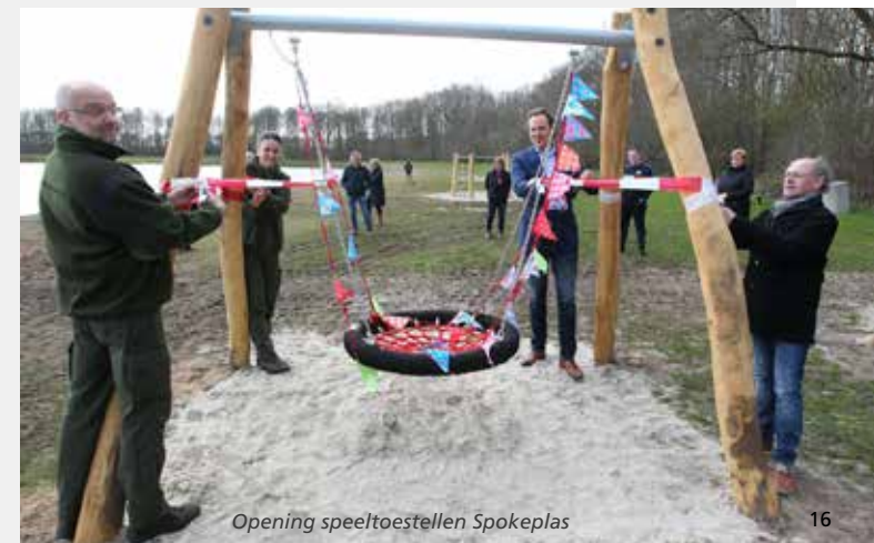
Opening speeltoestellen Spokeplas