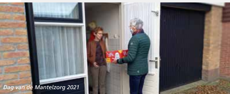
Dag van de Mantelzorg 2021

In de afgelopen periode is ook gewerkt aan het inrichten van een monitor sociaal domein. De informatie die we zo verkrijgen, geeft meer zicht op de kostenontwikkeling in het Sociaal domein.