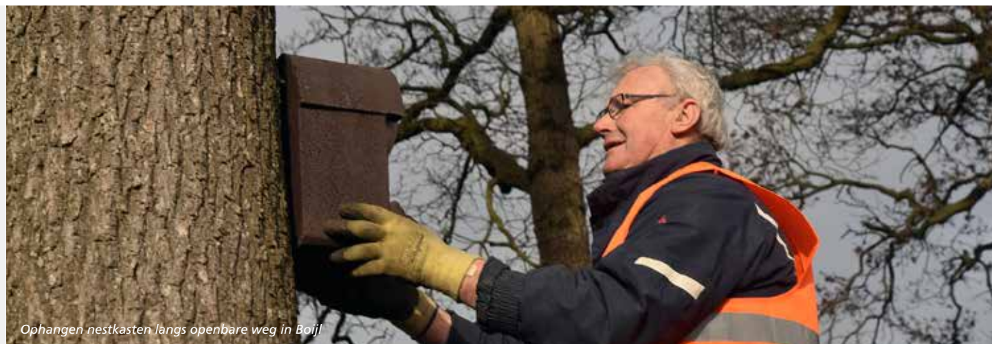
Ophangen nestkasten langs openbare weg in Boijl

bloemrijke streekeigen mengsels. Er zijn bloemenweides, natuurvriendelijke oevers en natuur aangelegd. Ook zijn meer dan 1000 nestkasten op erven en langs wegen opgehangen. We bestrijden de eikenprocessierups door natuurlijke vijanden aan te trekken.