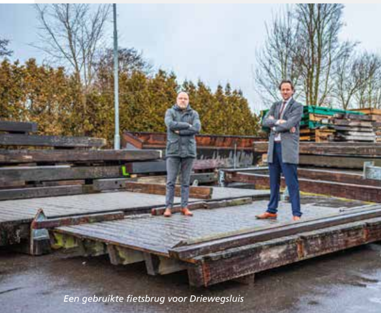
Een gebruikte fietsbrug voor Driewegsluis

Met het project Zuidelijke Poort willen we de aantrekkelijkheid van de locatie Driewegsluis en de omgeving vergroten. Begin 2021 besloot de raad om de bijdrage van € 300.000 uit de Regio Deal in te zetten voor een sluisroute. Ook besloot de raad om € 425.000 als cofinanciering beschikbaar te stellen voor andere werkzaamheden bij Driewegsluis. Deze werkzaamheden, waaronder het opknappen van de Lindesluis in Blesdijke, zijn inmiddels uitgevoerd.