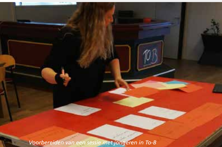
Voorbereiden van een sessie met jongeren in To-B

In de onderwijsvisie is de aansluiting op jeugdhulp geformaliseerd. Verdere uitwerking van de samenwerking met het onderwijs in een uitvoeringsprogramma bleek niet te realiseren vanwege corona.