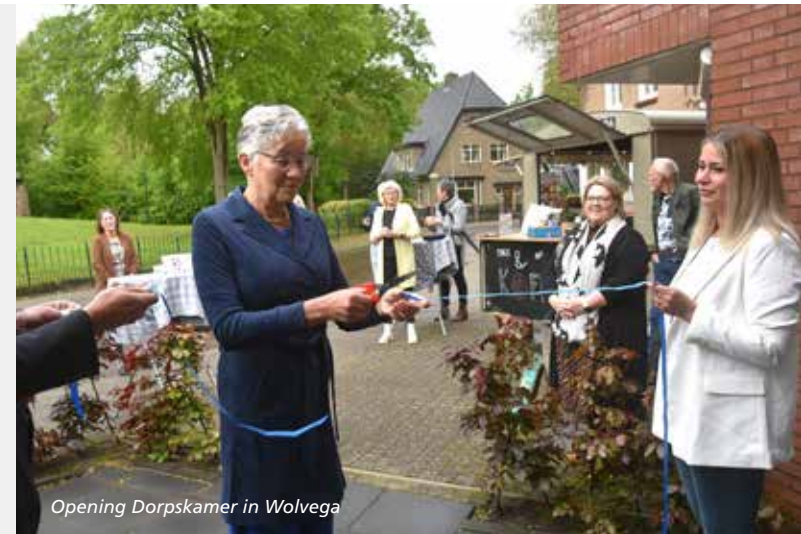
Opening Dorpskamer in Wolvega