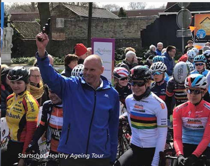
Startschot Healthy Ageing Tour

Vanuit de Regio Deal werken we ook aan Bestemming Wolvega. Er is geld beschikbaar om de sociale structuren en samenhang in Wolvega te versterken. Het initiatief ligt bij de inwoners. In de eerste fase van het plan van aanpak haalt de gemeente verhalen op van inwoners, ook met betrekking tot een dorpshuisfunctie in Wolvega.