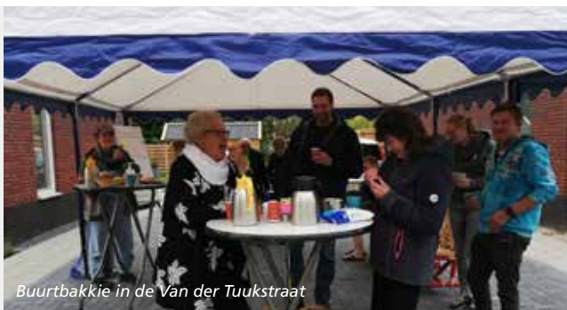
Buurtbakkie in de Van der Tuukstraat