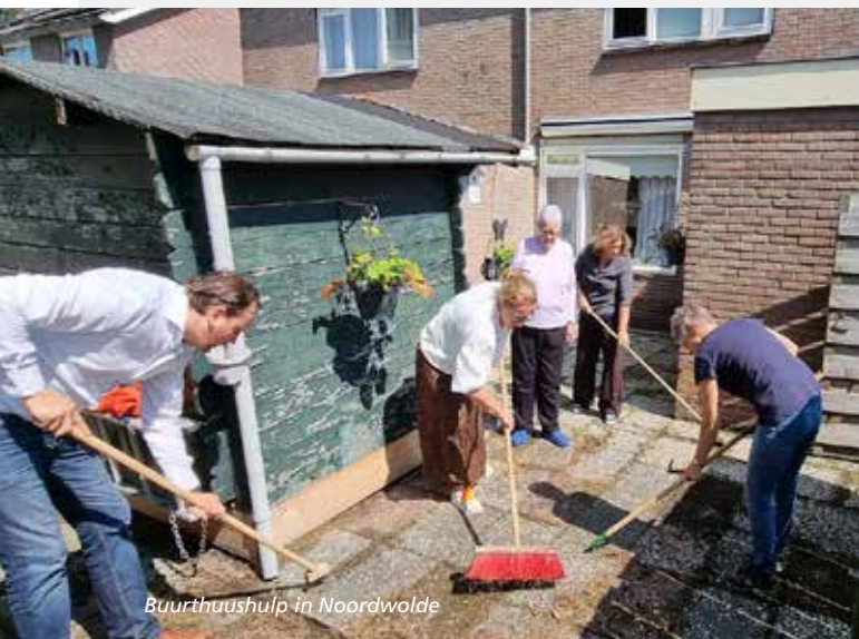
Buurthuushulp in Noordwolde

Fase 5 heeft bijgedragen aan positieve ontwikkelingen qua gezondheid, ondernemerschap, participatie en sociale cohesie in Noordwolde. In 2021 is fase 6 gestart. Deze loopt tot eind 2023. Na uitvraag van de behoeften van het dorp ligt de focus in 4 thema's op sociale aspecten: Maak werk van Noordwolde, Je straat en je buurt, Opgroeien en ouder worden in Noordwolde en Samen met anderen. Werkgroepen geven invulling aan de benoemde deelprojecten. Er is o.a. een Talentenplek voor jongeren opgezet en we versterken de sociale cohesie met Lief & Leedstraten.