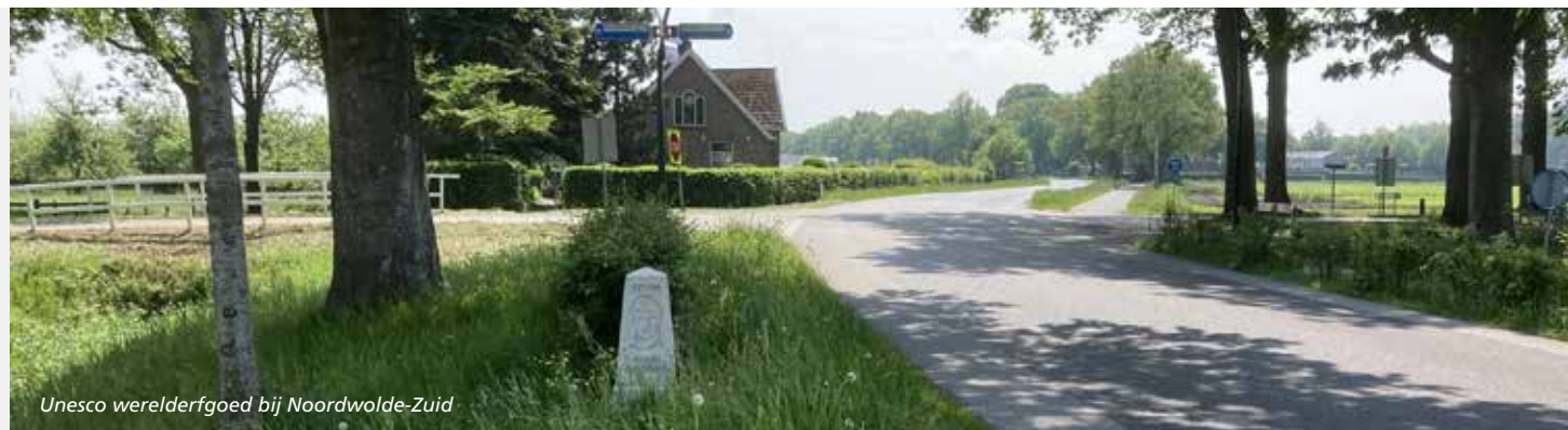
Unesco werelderfgoed bij Noordwolde-Zuid