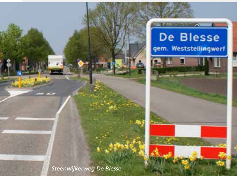
Steenwijkerweg De Blesse

Het voorlopig ontwerp is verder uitgewerkt naar een definitief ontwerp. De bijbehorende contractdocumenten zijn klaar. Wanneer de kabels en leidingen zijn verlegd en vernieuwd, start de uitvoering naar verwachting in 2023.