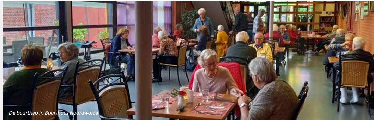
De buurthap in Buurthuis Noordwolde