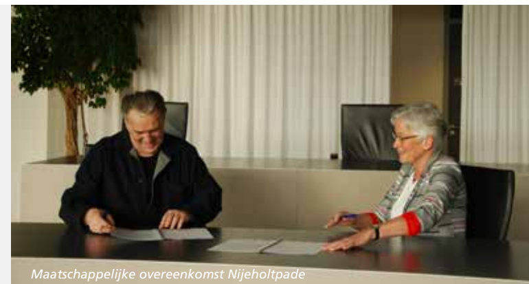
Maatschappelijke overeenkomst Nijeholtpade