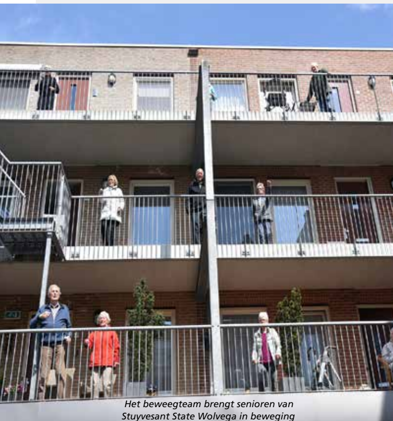
Het beweegteam brengt senioren van Stuyvesant State Wolvega in beweging