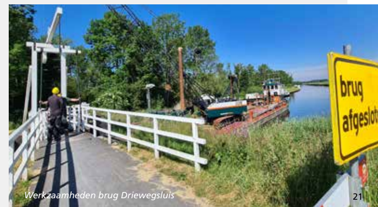
Werkzaamheden brug Driewegsluis

In de investeringskalender 2017 – 2027 is het project Rottige Meente in een andere benaming opgenomen: Meer ruimte voor cultuur en natuur in de Rottige Meente. Wij vinden het gewenst, dat de uitvoering van de in de gebiedsopgave genoemde projecten wordt vervolgd.