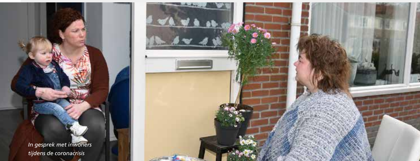
In gesprek met inwoners tijdens de coronacrisis

Er worden 25 projecten uitgevoerd in het kader van de Regio Deal. Sommige projecten zijn bedoeld voor alle deelnemende gemeenten, zoals het Regiofonds en de dorpsontwikkelingsmaatschappijen (DOM's). Deze projecten zijn specifiek gericht op het realiseren van levendige kleine kernen. Andere projecten zijn specifiek voor Weststellingwerf. Zo bereiden we het project Bestemming Wolvega voor dat in 2022 van start gaat. Verder voeren we in Weststellingwerf een aantal (deel) projecten voor een vitaal landschap uit. Dit zijn gebiedsontwikkeling Beekdal Linde en water voor natuur en landbouw in Oldelamer. Vanuit het thema 'het gastvrije andere Friesland' wordt de monumentale Lindesluis gerenoveerd. Dit is een onderdeel binnen de Zuidelijke poort Friese Wouden.