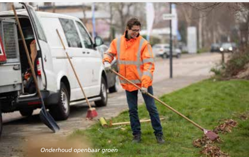
Onderhoud openbaar groen

Op 7 oktober 2021 heeft er een verkenning van de kaders plaatsgevonden in een informatieve sessie met de raad. Inmiddels ligt er een ambtelijke conceptversie van de DIOR. In 2022 bieden we de DIOR ter vaststelling aan de gemeenteraad aan. Daarmee hebben we een richtlijn voor de inrichting van de openbare ruimte voor toekomstige projecten en ontwikkelingen.