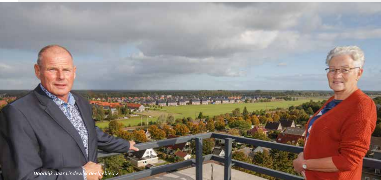
Doorkijk naar Lindewijk deelgebied 2

Tot en met 2029 bouwen we gefaseerd 200 nieuwe woningen in de Lindewijk. We willen ruimte bieden voor met name starters en senioren (hofjes), koop- en huurwoningen. In februari 2022 zijn we gestart met het bouwrijp maken.