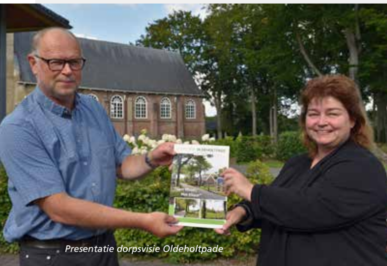
Presentatie dorpsvisie Oldeholtgade