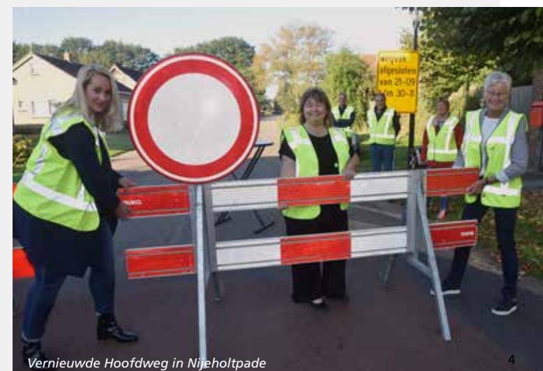
Vernieuwde Hoofdweg in Nijeholtpade

Om als gemeente beter in te kunnen spelen op de steeds veranderende vraag van de samenleving is de gemeentelijke organisatie opnieuw ingericht. Zodat we in de toekomst wendbaar en professioneel met inwoners en partners kunnen blijven samenwerken.