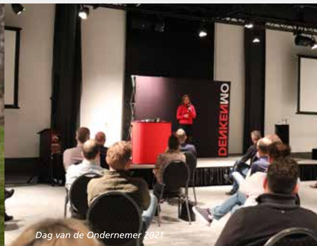
Dag van de Ondernemer 2021