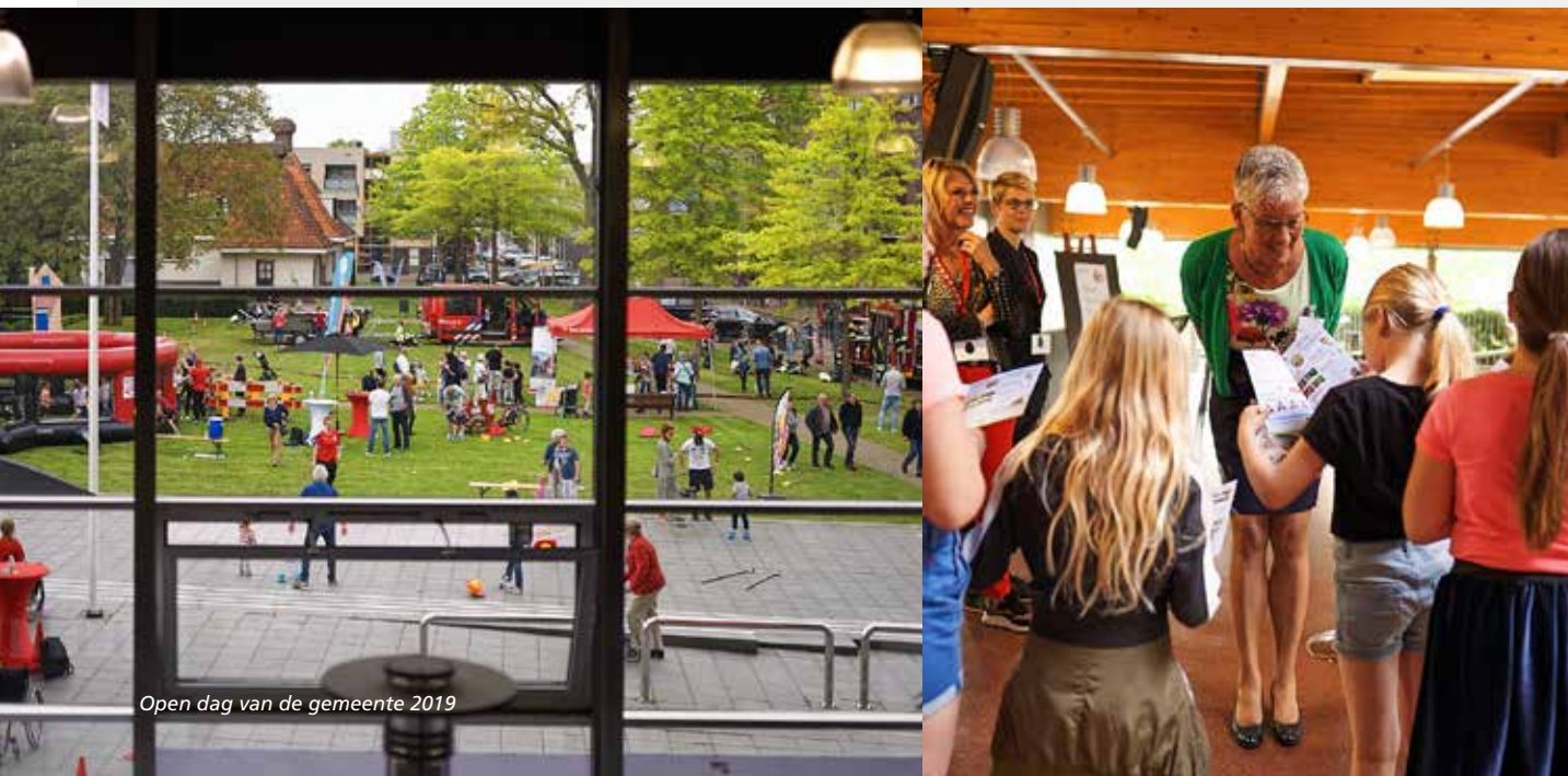
Open dag van de gemeente 2019