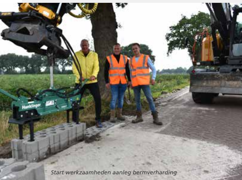
Start werkzaamheden aanleg bermverharding

We zijn regelmatig in gesprek met de agrariërs en de bewoners over het gebruik van het buitengebied. Iedereen heeft eigen belangen en die zijn soms tegengesteld. In de gesprekken vragen wij om begrip voor elkaar. De plattelandswegen moeten door iedereen op een veilige manier kunnen worden gebruikt. In de reguliere overleggen met het bestuur van LTO en de besturen van plaatselijk belang vragen wij aandacht voor een veilig gebruik van de plattelandswegen.