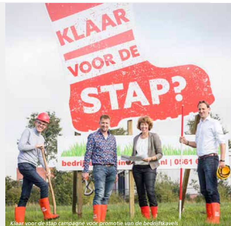
Klaar voor de stap campagne voor promotie van de bedrijfskavels