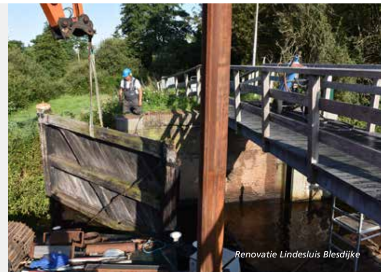
Renovatie Lindesluis Blesdijke

De coronacrisis heeft veel flexibiliteit gevraagd van de medewerkers. Zij moesten er voor zorgen dat crisis zo beheersbaar mogelijk bleef en de genomen maatregelen werden uitgevoerd. Tegelijkertijd moesten de reguliere werkzaamheden zoveel mogelijk doorgaan. En dat terwijl de meeste medewerkers lange periodes thuis moesten werken en hun werk vaak moesten combineren met het helpen en opvangen van hun kinderen bij thuisonderwijs. Mede omdat het thuiswerken snel en goed is gefaciliteerd, konden veel werkzaamheden doorgaan. Toch was het noodzakelijk te prioriteren. Daardoor zijn bepaalde projecten en beleidsnota's vertraagd of niet gemaakt.