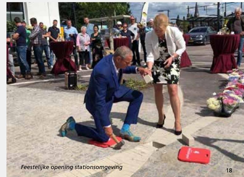
Feestelijke opening stationsomgeving

Een herinrichting van de stationsomgeving, waarbij deze weg beter is ingericht op de ontsluitingsfunctie die zij heeft. Het voorplein van het station is ingericht op gemengd gebruik door de vele weggebruikers. Ook is het station nu veilig per fiets bereikbaar. Het plan voor de herinrichting is samen met ondernemers en omwonenden gemaakt. Op 3 juli 2019 heeft de feestelijke opening van de nieuwe stationsomgeving plaatsgevonden.