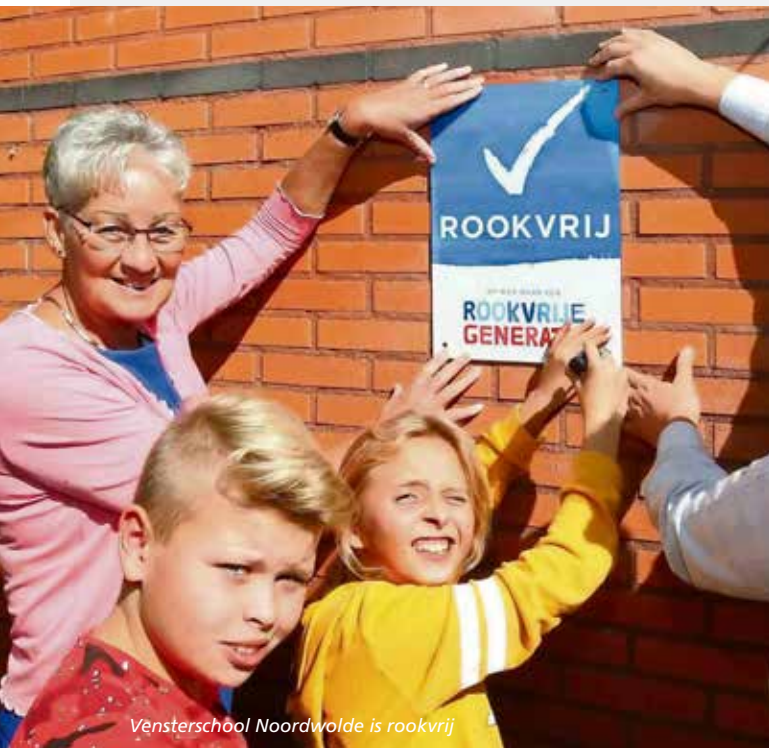
Vensterschool Noordwolde is rookvrij