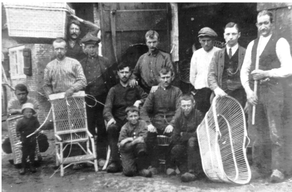
van de Stellingwerven met de rest van het land. Daarnaast komt de recreatie en toerisme op gang.

Na de oorlog verandert er veel in Weststellingwerf. Echte welvaart begint eigenlijk pas in 1958. Mede dankzij de ruilverkaveling worden onbegaanbare zand- en modderpaden moderne asfaltwegen, plaggenhutten vervuuld voor nieuwe gerieflijke huur- en koophuizen. De industrie groeit. De gemeenten Oost- en Weststellingwerf worden aangewezen als ontwikkelingsgebieden bij wet van 23 juni 1952. In 1959 komt er een nieuwe industrialisatiepolitiek met stimuleringsregelingen. Dat stimulerend nodig is blijkt uit de achterstand van inkomsten van de bevolking