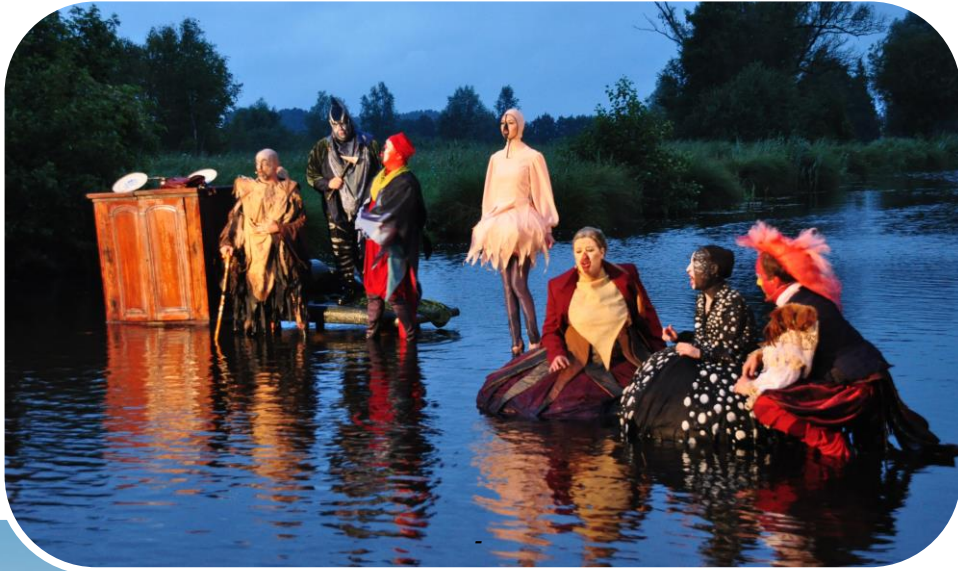
Fragment uit Opera Nijetrijne in de Rottige Meente

Boeiend en toeristisch interessant zijn zeker de verhalen over de Koloniën van Weldadigheid, de rietvlechtgeschiedenis van Noordwolde en de verdediging van de Friese Waterlinie bij bijvoorbeeld de Blessebrugschans.