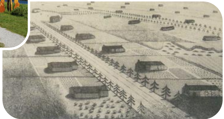
Schets van de Koloniën van Weldadigheid