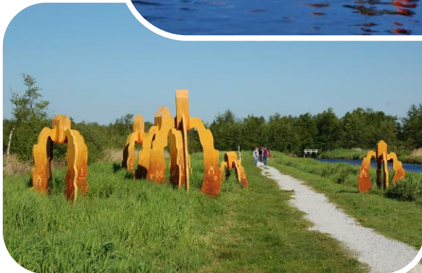
Kunstobject in de Rottige Meente als onderdeel van het project 'Out of Space'