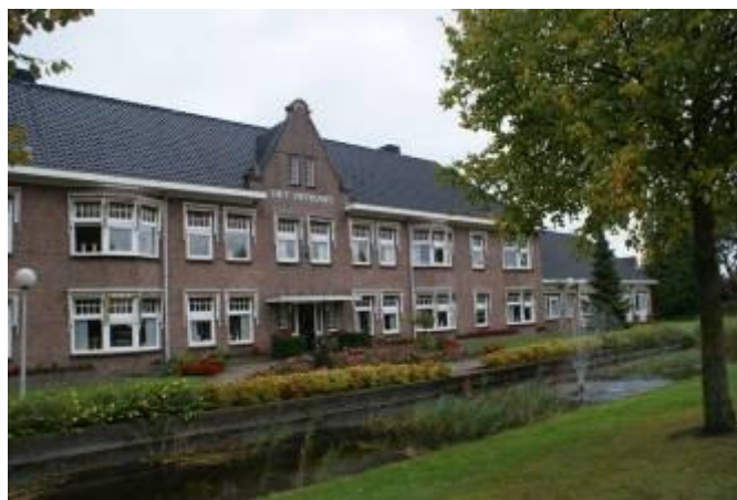
Het St. Franciscus Gesticht Huize Lycklama te Wolvega , tehuis voor ouden van dagen, hulpbehoevenden en gebrekkigen, dat gisteren officieel geopend is,