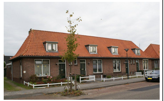
Vier blokjes van vier woningen

Gemeente: Weststellingwerf Plaats: Wolvega Adres: Lycklamaweg 51 / 81