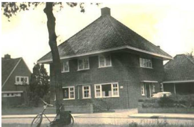
Woning in ca. 1950