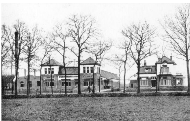
Zuivelfabriek met directeurswoning in 1913