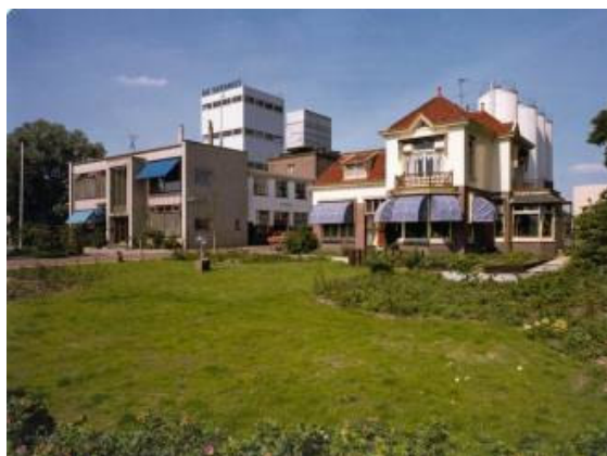
Zuivelfabriek met directeurswoning, ca, 1980