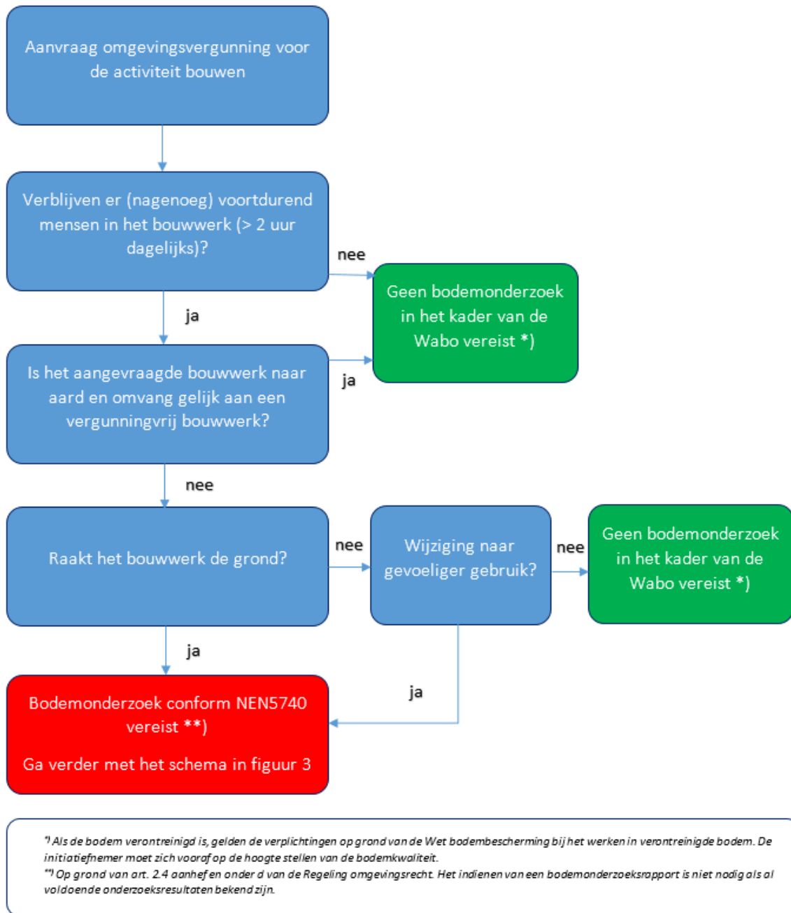
Figuur 2: Bodemonderzoeksplicht bij de omgevingsvergunning voor de activiteit bouwen.