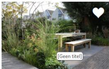
TEGELS ERUIT, GROEN ERIN!