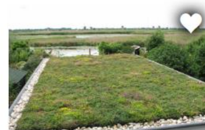
VERGROEN JE DAK