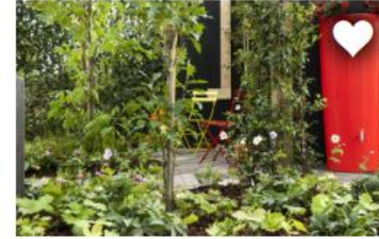
PLAATS EEN REGENTON OF REGENSCHUTTING