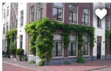
VERGROEN JE GEVEL