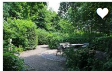
HAGEN EN GROENE ERFAFSCHIEDINGEN