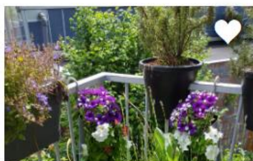
VERGROEN JE BALKON OF DAKTERRAS