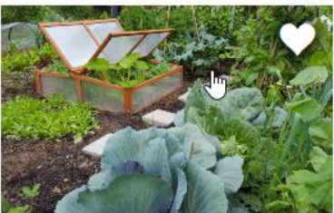
BEGIN EEN MOESTUUNTJE