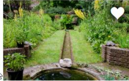
MAAK EEN GOOT