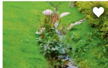
MAAK EEN INFILTRATIE GREPPEL OF WADI