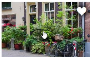
MAAK EEN GEVELTUUNTJE