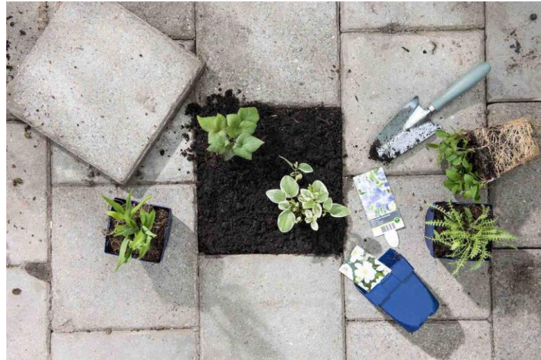
Tegel eruit - - plantje erin