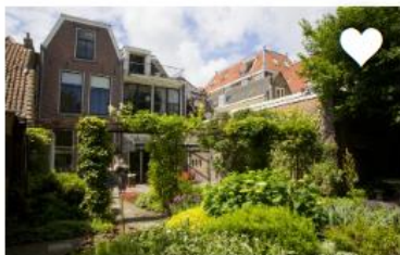
ZONWERING VOOR IN DE TUIN