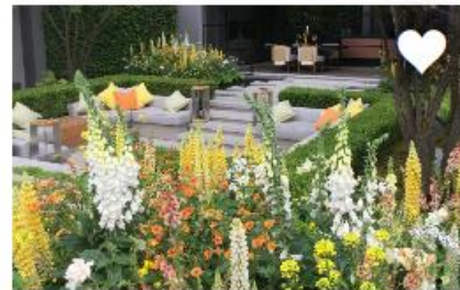
MAAK EEN ZITKUIL VOOR WATERBERGING