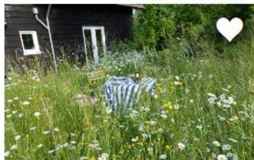
LEG EEN GAZON AAN, MAAK EEN BLOEMRIJK GRASLAND