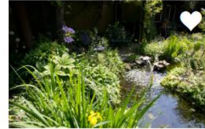
MAAK EEN REGENWATERVIJVER