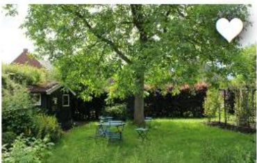
PLANT EEN BOOM