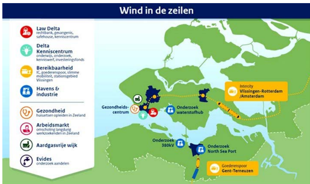
Figuur 1: Een overzicht van de diverse projecten uit het pakket Wind in de Zeilen

Zo maakt het totale pakket het voor de regio mogelijk een sprong in verdien- en concurrentievermogen te maken, die weer leidt tot nieuwe aantrekkingskracht, nieuwe vestigingskansen en banen. Dit moet leiden tot een groeiend aantal jongeren en jonge professionals dat zich in de regio vestigt en zo een positieve invloed heeft op onderwijs, sociale voorzieningen, cultuur, kwaliteit van leven en bestedingen in de regio.