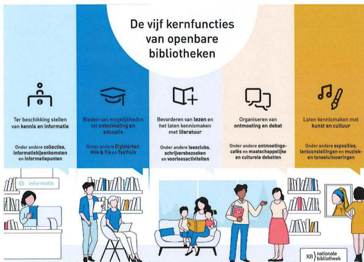
Schema 1. Wettelijke taken bibliotheek

Voor de inzet op deze maatschappelijke opgaven is het nodig dat elke bewoner van de acht betrokken gemeenten binnen een redelijke afstand toegang heeft tot een volwaardige openbare bibliotheek. Deze bibliotheken dienen de vijf wettelijke bibliotheekfuncties te vervullen om vanuit die hoedanigheid een relevante bijdrage te leveren aan de maatschappelijke opgave. Deze vijf wettelijke functies van de openbare bibliotheek worden beschreven in de Wet stelsel openbare bibliotheekvoorzieningen (Wsob). Die staan in bijgevoegd schema. Ontwikkeling en educatie staan als functie centraal. De overige wettelijke taken leveren daar een bijdrage aan.