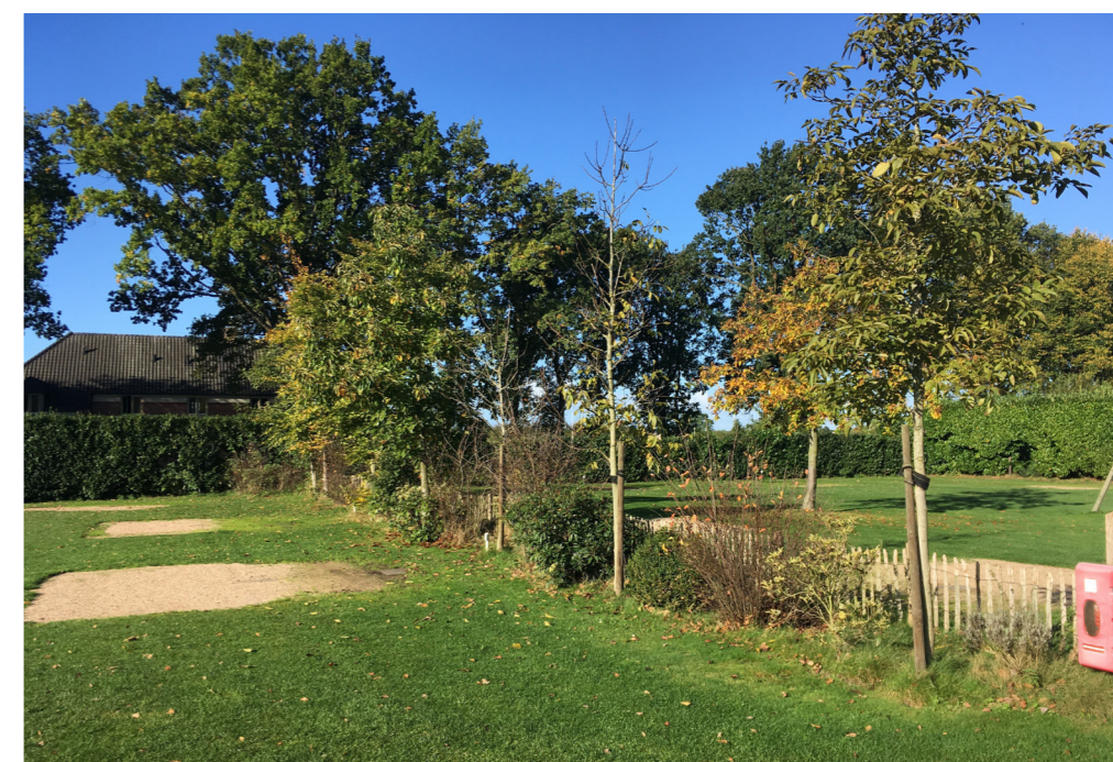
1. SINGEL TUSSEN KAMPEERVELDEN

X = voorkomende en evt. toe te passen soorten andere gelijkwaardige soorten zijn tevens toegestaan