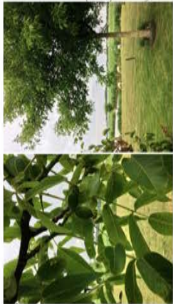
WEIDE AANVULLEN MET JUGLANS REGIA EN CASTANEA SATIVA