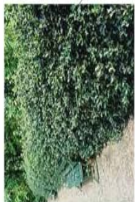
AANPLANT HAAG VAN HULST