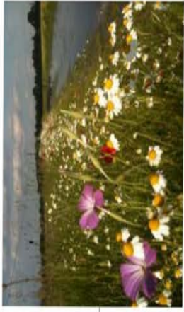
AANLEG KRUIDENRIJKE VEGETATIE