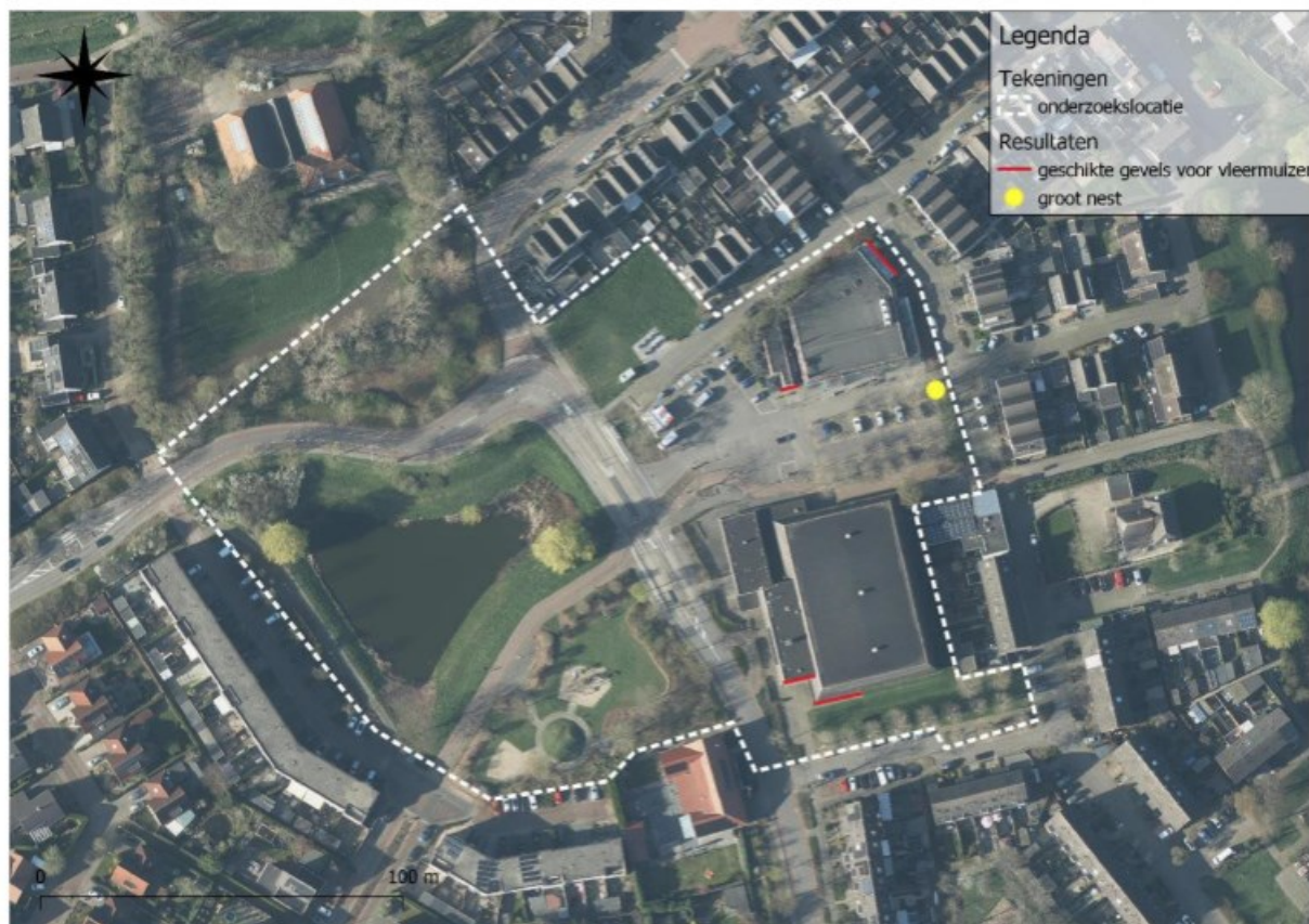
Figuur 5.7 Geschikte gevels voor vleermuizen en locatie van het grote nest op de onderzoekslocatie..

De aanwezige bomen op de onderzoekslocatie zijn onderzocht op holtes, spleten en/of loshangend schors, die kunnen dienen als potentiële vaste rust- of voortplantingsplaats voor boombewonende vleermuizen. Deze zijn niet aangetroffen en daarmee zijn verblijfplaatsen van boombewonende vleermuizen uit te sluiten.