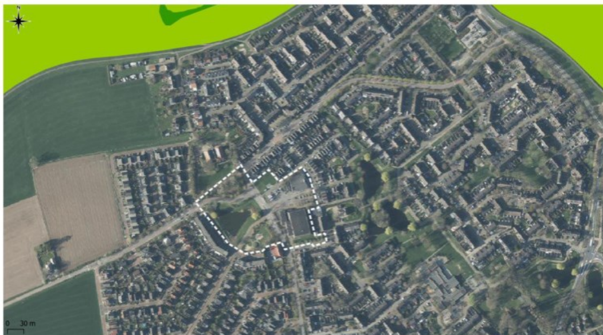
Figuur 7.2 Ligging onderzoekslocatie ten opzichte van het Natuurnetwerk Nederland.

De onderzoekslocatie maakt geen deel uit van het Natuurnetwerk. De onderzoekslocatie ligt ook niet in de nabijheid van een gebied, behorend tot het Natuurnetwerk Nederland. Het meest nabijgelegen gebied bevindt zich circa 245 meter ten noorden van de onderzoekslocatie. In figuur 7.2 is de ligging van de onderzoekslocatie ten opzichte van het Natuurnetwerk Nederland weergegeven.