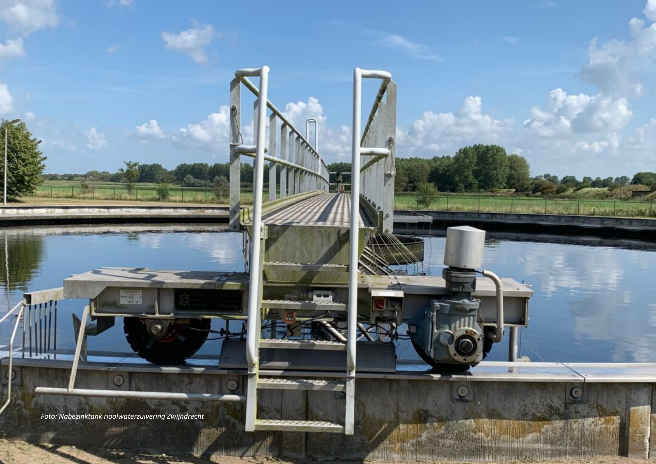
Foto: Nabezinktank rioolwaterzuivering Zwijndrecht