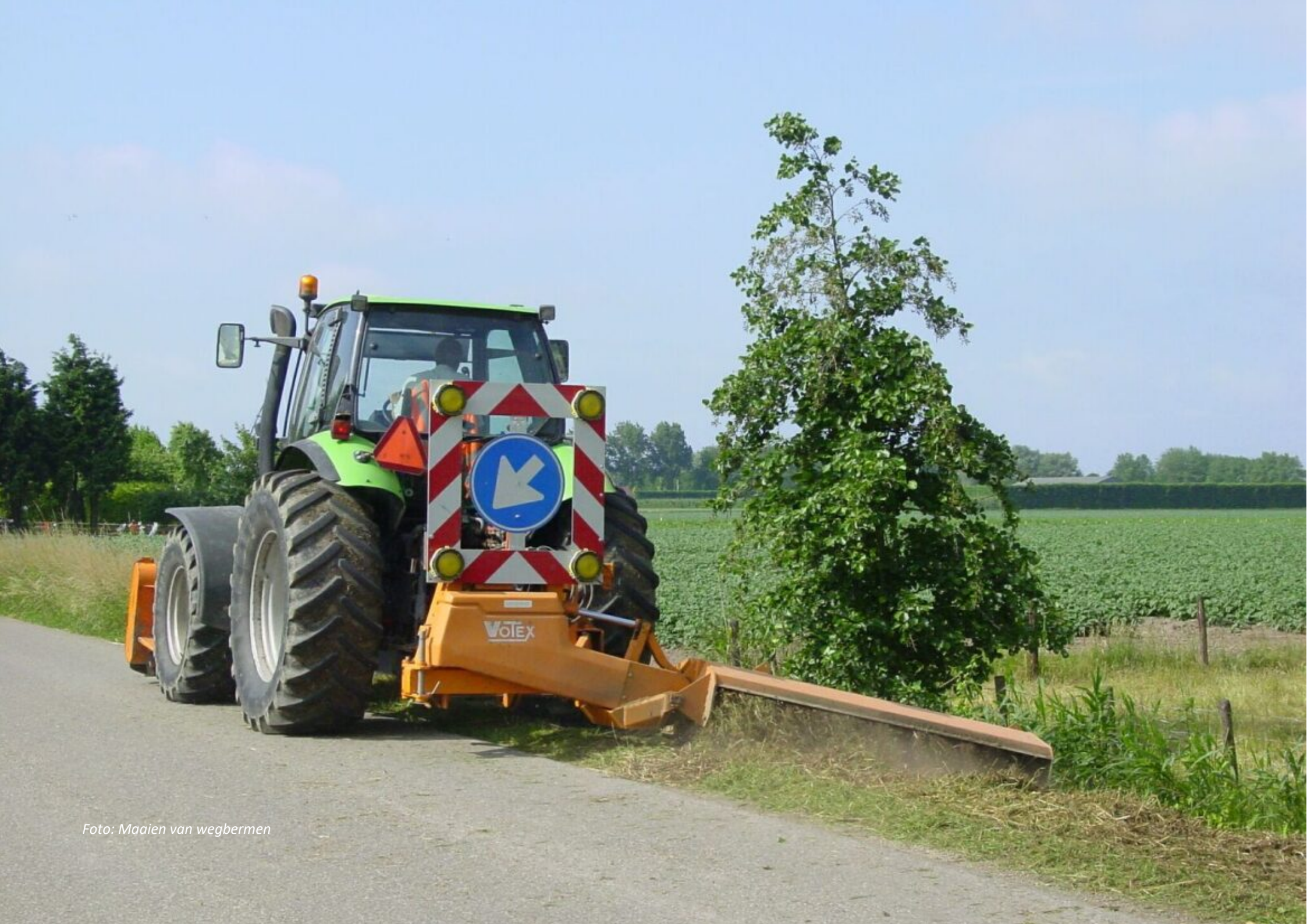
Foto: Maaien van wegbermen