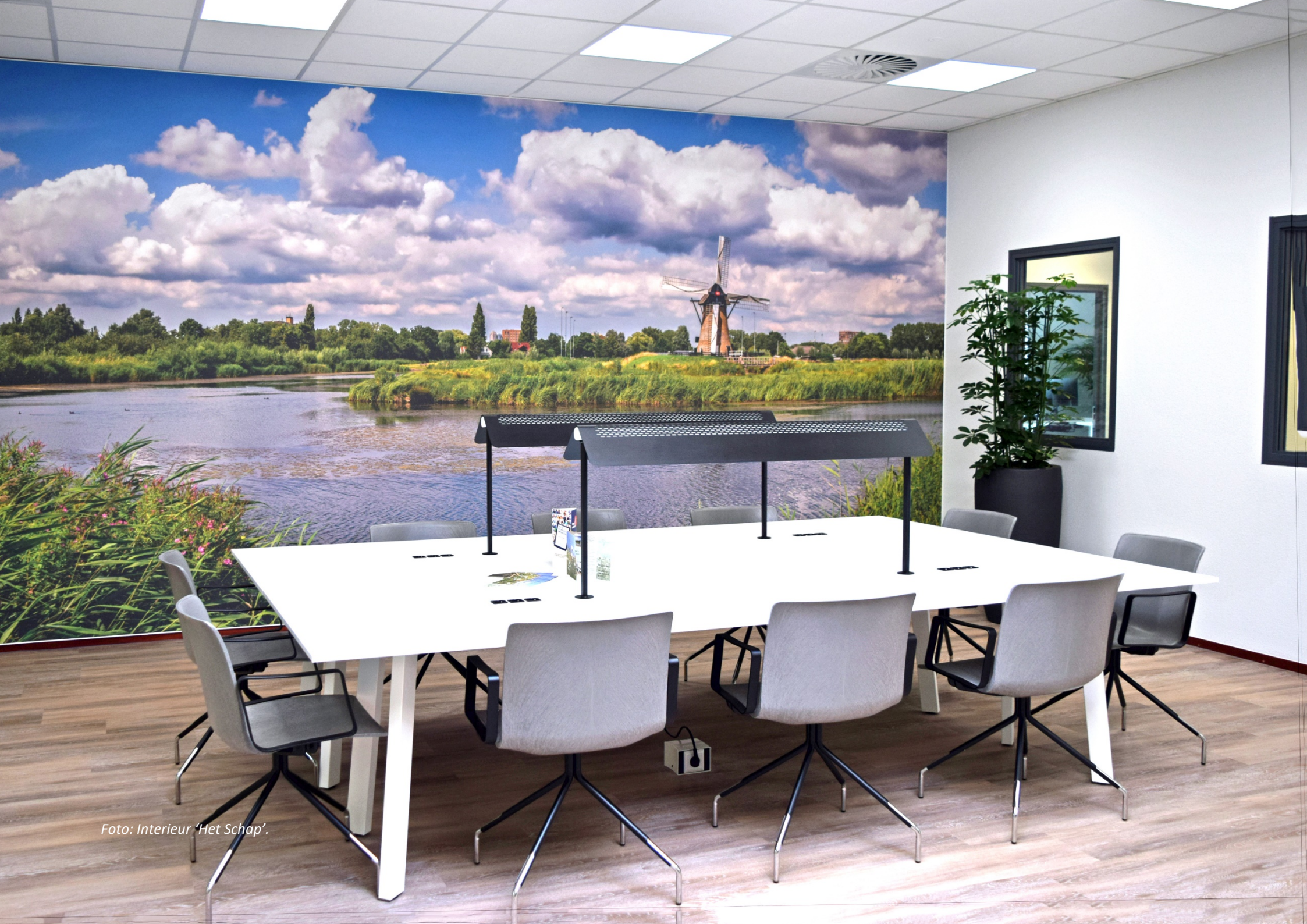
Interieur 'Het Schap'.