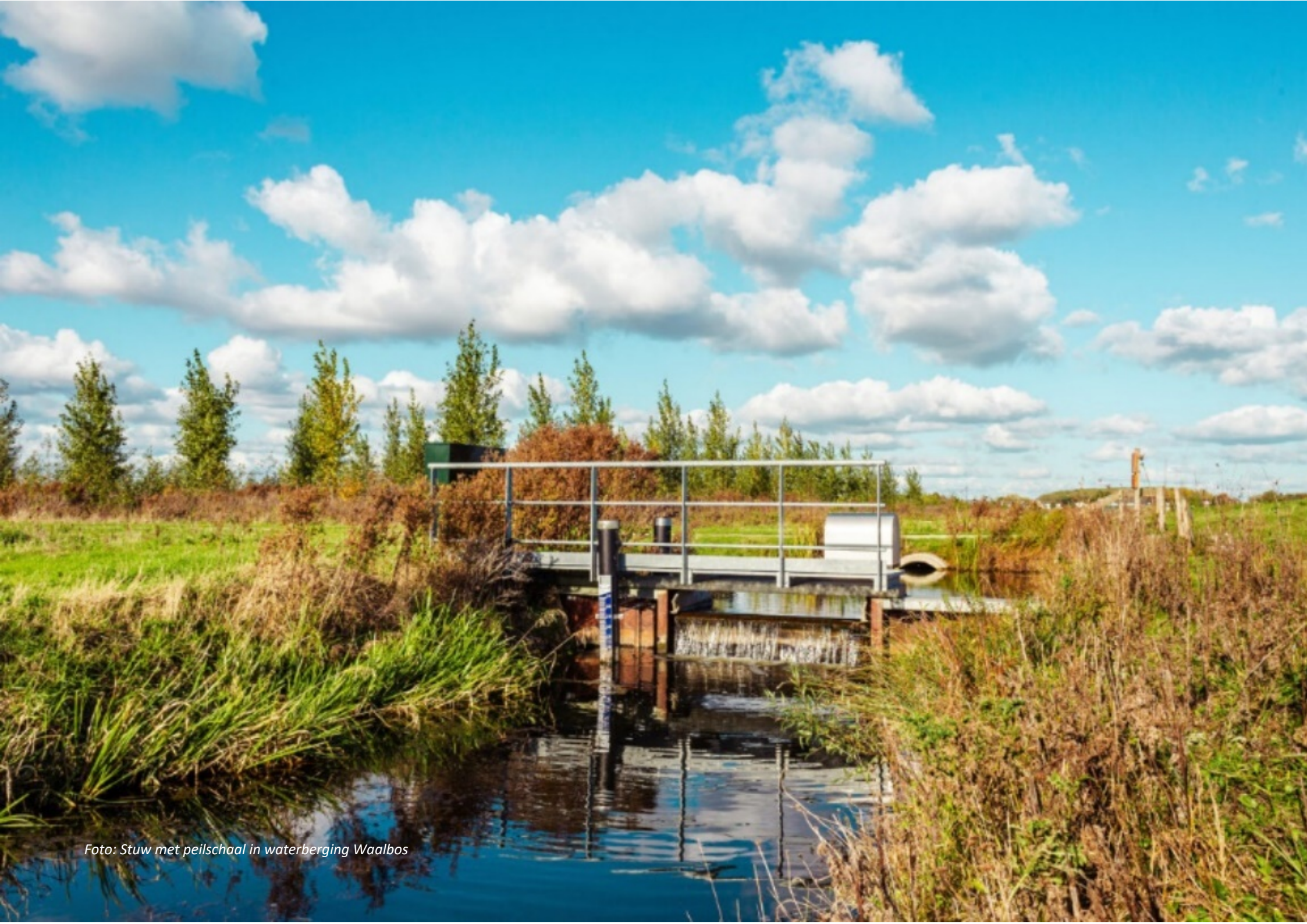
Stuw met peilschaal in waterberging Waalbos