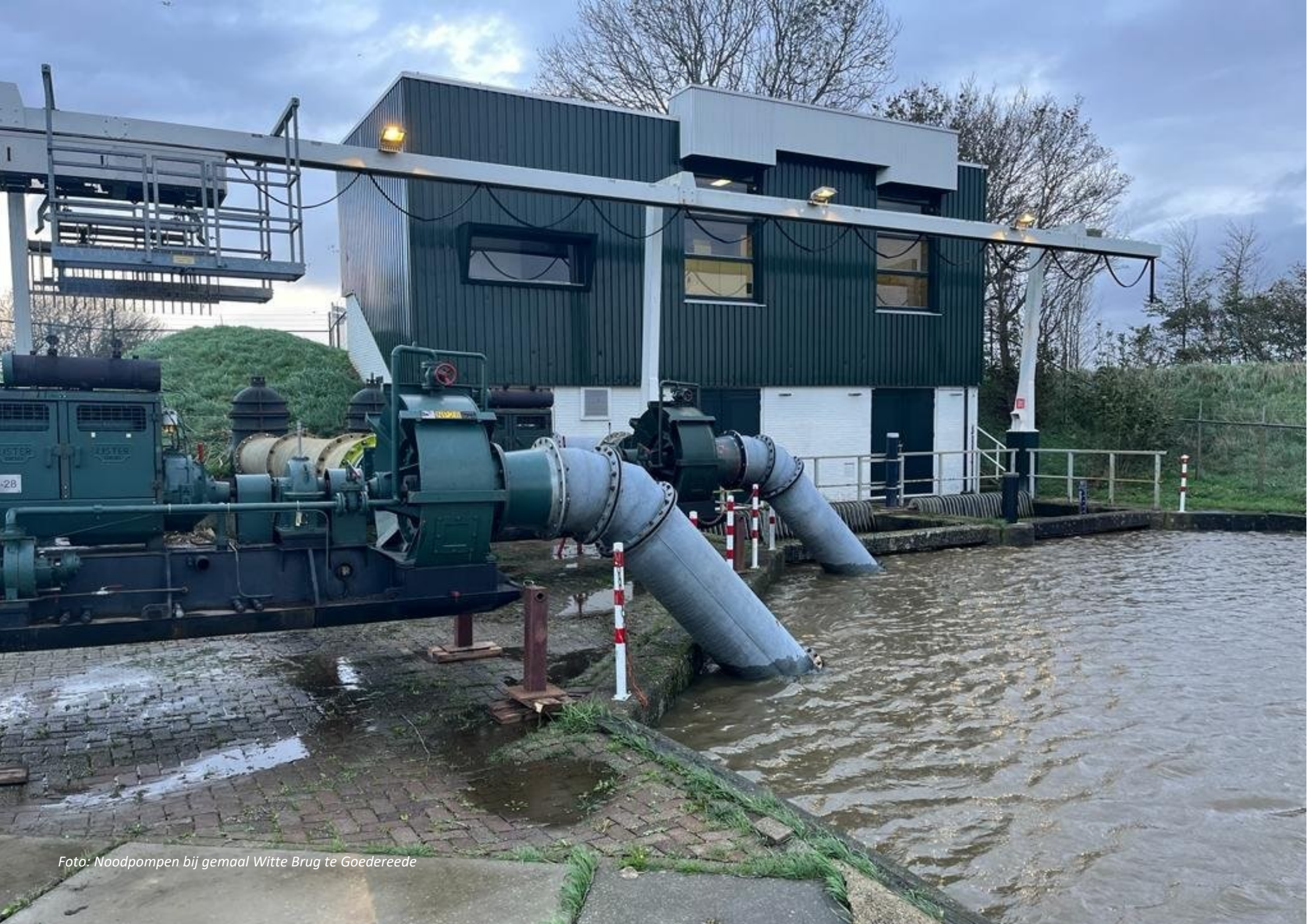
Foto: Noodpompen bij gemaal Witte Brug te Goedereede