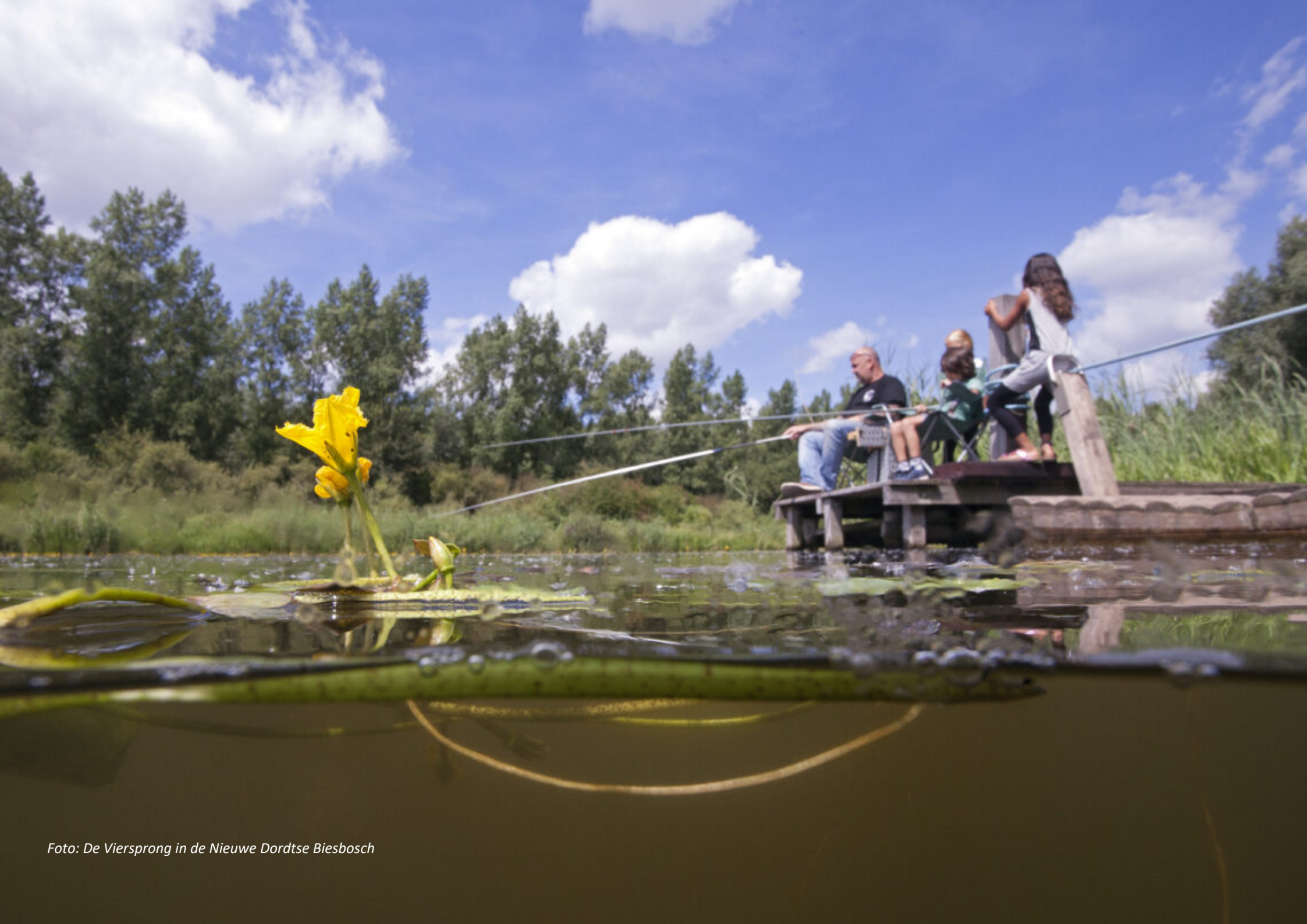
Foto: De Viersprong in de Nieuwe Dordtse Biesbosch