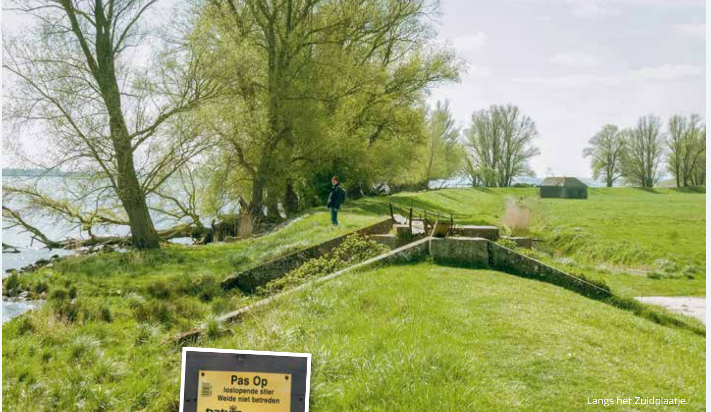
Langs het Zuidplaatje.