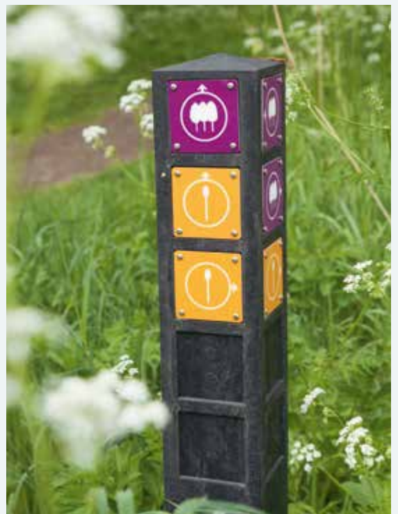
↗ Routepaaltje met tekens voor de Bolbakenroute en Route De Elzen Noord.