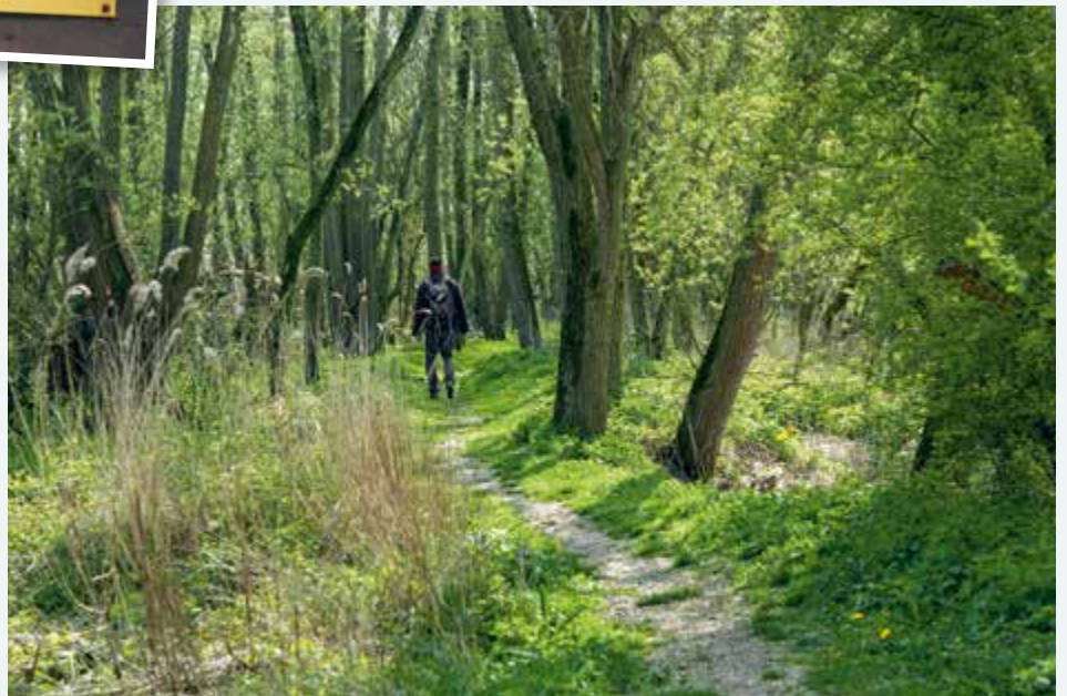
^ Langs het laarzenpad.

teld. We bereiken de Tongplaat, die enkele jaren geleden weer is teruggeven aan de dynamiek van het rivierwater. Op slikplaten en in ondiepe krekken zoeken eenden, knob- belzwanen en steltlopers naar voedsel. In de verte een schim van een zeearend, die er de laatste jaren broedt. Uit het jonge en dichte griendbos langs het pad is een flinke hap genomen. Niet het zaag- en kap werk van Staatsbosbeheer, maar het resultaat van actieve bevers.