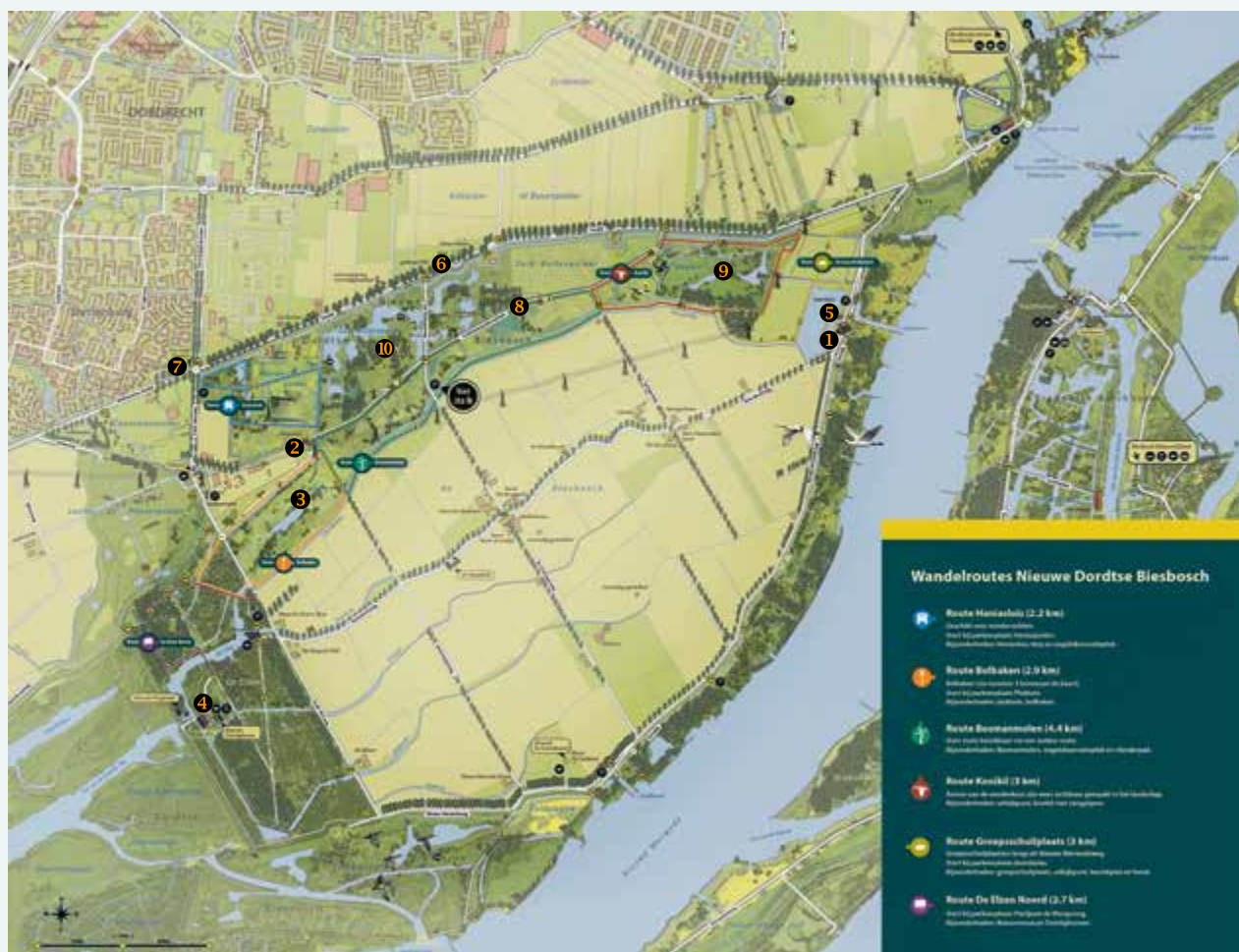
Cartografie & ontwerp Buro GLAAP

In de jaren '30 werden meerdere pachtboerderijen in het nieuw ingepolderde deel gebouwd als eigendom van Vereniging de Biesbosch (feitelijk de gemeente Dordrecht). Hoeve Jong Dordrecht werd door de vereniging zelf geëxploiteerd, eerst als gemengd bedrijf, later als fruitbedrijf met eigen koelhuis. In 1988 werd