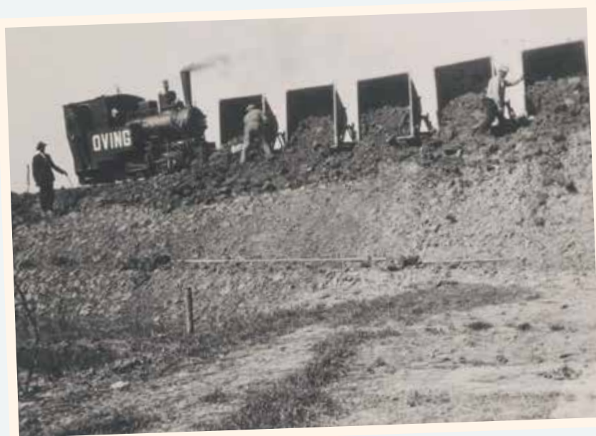
⤴ Inpolderingswerkzaamheden van de Biesboschpolder.

dat erlangs stroomde, werd in eerste instantie afgevoerd via een eb en vloedsluis. Bij eb gingen de sluisdeuren voor het polderwater open, bij vloed werden diezelfde deuren weer dichtgedrukt. Maar door inklinking van de polder nam de druk af en kon het water niet goed meer weg. In 1955 werd daarom het Johannes Visgemaal gebouwd om de polder leeg te kunnen trekken. Het water dat nu de Nieuwe Dordtse Biesbosch verlaat wordt ook via het gemaal richting de Dordtse Biesbosch afgevoerd. Daarmee is de brug tussen de Sliedrechtse Biesbosch in het noorden en de Biesbosch in het zuiden een feit. ■