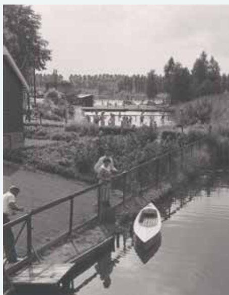
▲ Natuurbad de Viersprong in 1960 met op de groepsschuilplaats (bunker) een picknickplek voor badgasten.

Ik ben toe aan een moment van reflectie en sluit de toer af bij huiskamercafé Fluitekruid, een van de horecagelegenheden in het gebied en de winnaars van de AD Terrassentrofee. Je kunt er even op adem komen na een enerverende tocht. ■