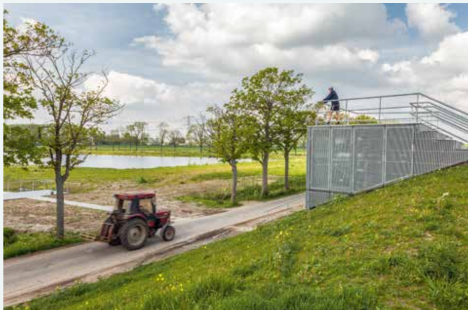
⤴ Uitzichtpunt Hevel met zicht op de bezinkplas. ⤵ Johannes Visgemaal.

Staatsbosbeheer houdt de natuurontwikkelingen in het gebied goed in de gaten. “Je ziet nu al heel veel nieuwe vogelsoorten zoals de dodaars, roodborsttapuut en zwartkopmeeuw. Die laatste heeft een schitterende rode snavel en rood-witte mascara rond de ogen. Dames zouden er jaloers op worden. Verder zie je veel libellen en amfibieën.”