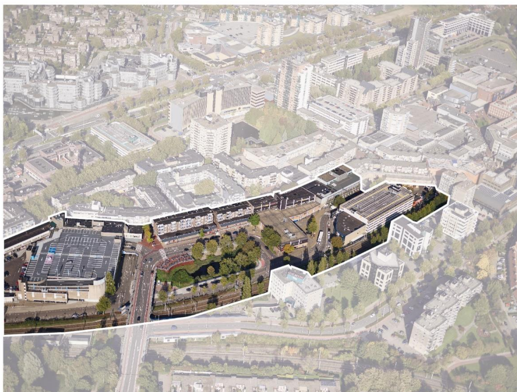
Deelgebied 5a (Zuidflank/Nederlandlaan)