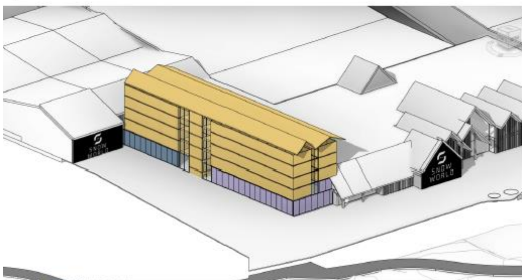
Opties voor hotel naast bestaande bebouwing