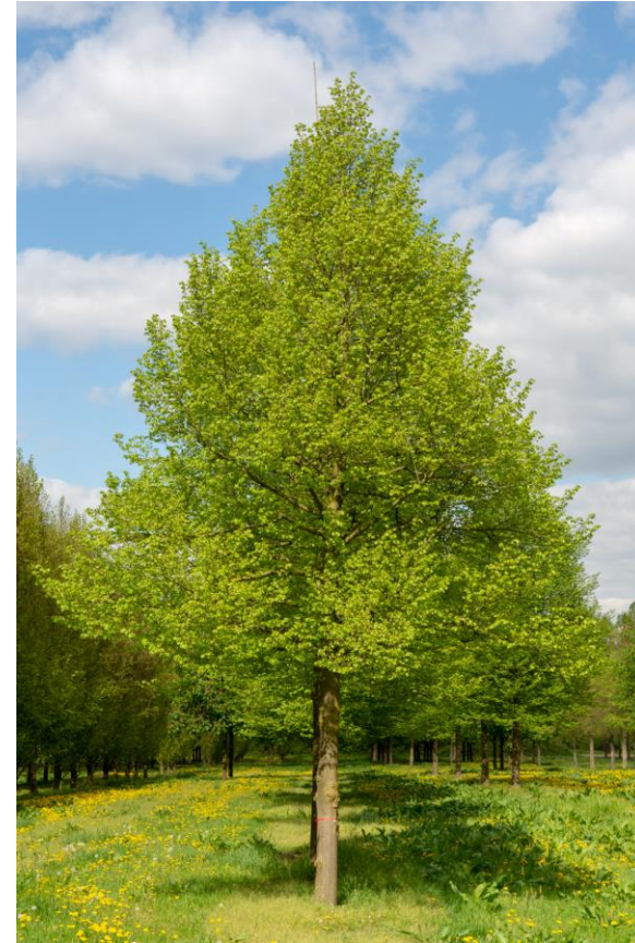
Nieuw te planten bomen