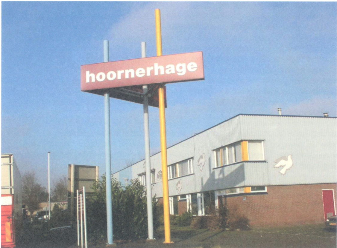
Hoornerhage is het eerste bedrijventerrein van groeikern Zoetermeer.