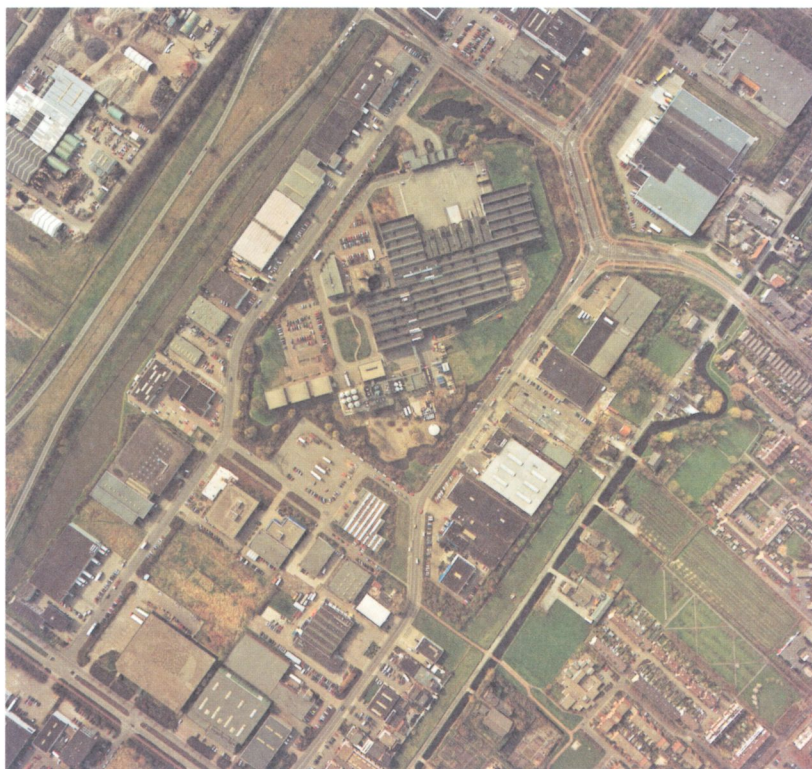
Luchtopname van Zoeterhage. De diagonale ligging van de gebouwen van de Bols-vestiging binnen de interne ringweg is goed herkenbaar.