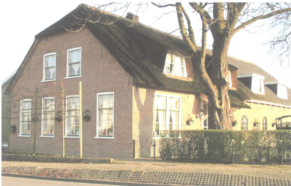
De boerderij aan de Edisonstraat stond voorheen aan het eind van een oprijlaan aan de Zegwaartseweg en vormt op Zoeterhage een herinnering aan het agrarisch verleden.