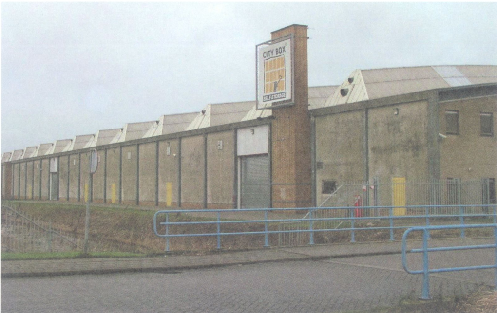
Fabriekshal uit 1961 met een lange rij lichtkappen aan de Industrieweg.