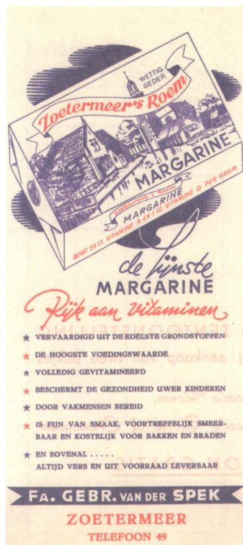
Zoetermeer's Roem, een 'kunstboter', was een eigen merk van Van der Spek. Folder met spaarkaart uit het begin van de jaren vijftig.