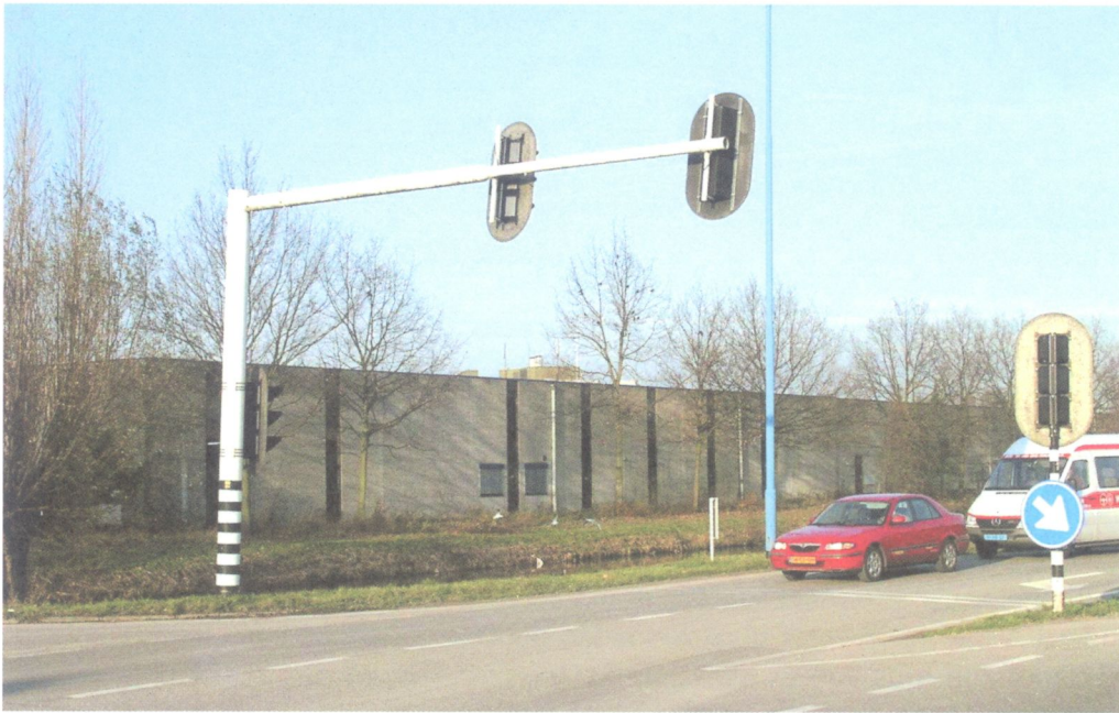
De bebouwing keert zich over het algemeen af van de doorgaande wegen, zoals hier aan de Oostweg in Zoeterhage.