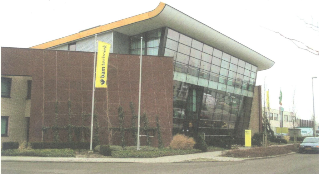
Op Langsinghage Zuid staat langs de Oostweg representatieve bedrijfsbebouwing, zoals dit ontwerp van K3D Design uit 1998 (zijde Edelgasstraat).