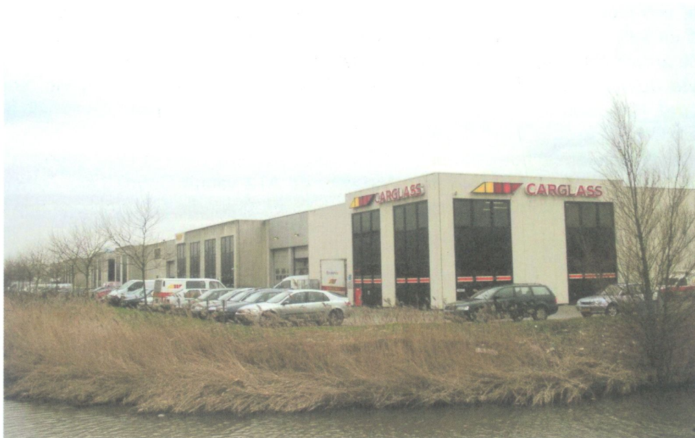
Bedrijvenpark aan de Argonstraat op Lansinghage Zuid, bestaande uit drie in een L-vorm gesitueerde verzamelgebouwen (1990).