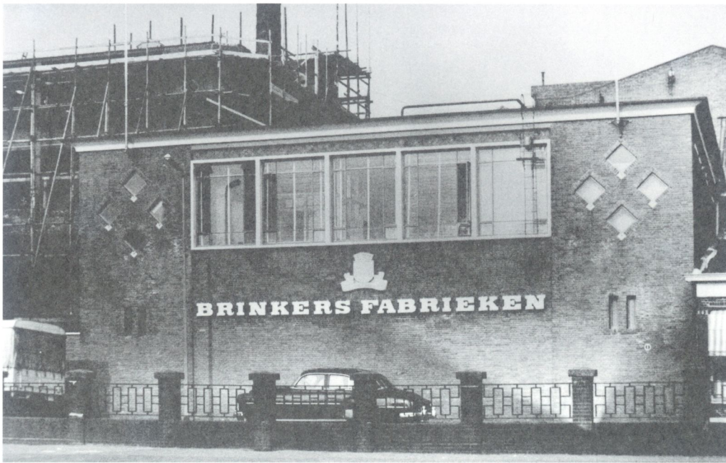
Brinkers Fabrieken aan de Dorpsstraat, kort voor de sloop in 1968.