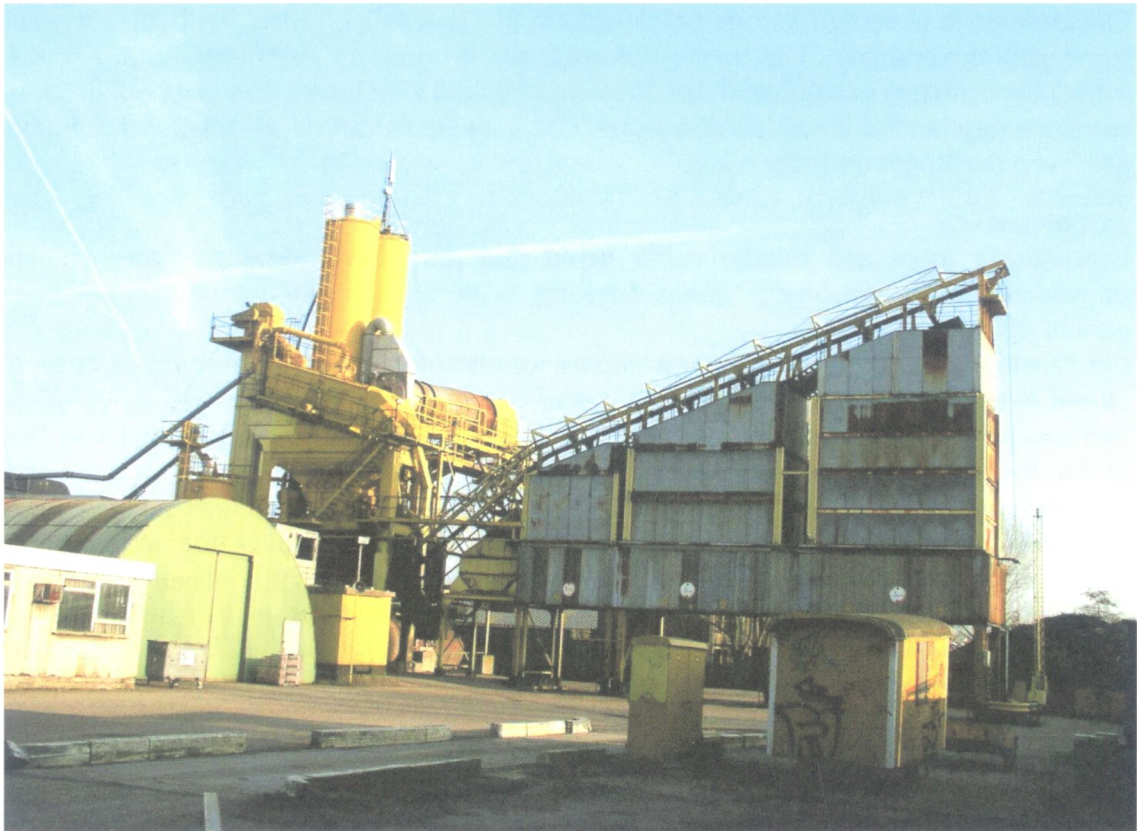
De bedrijven op Dwarstocht zoals de asfaltcentrale Asko passen niet bij een woonomgeving.