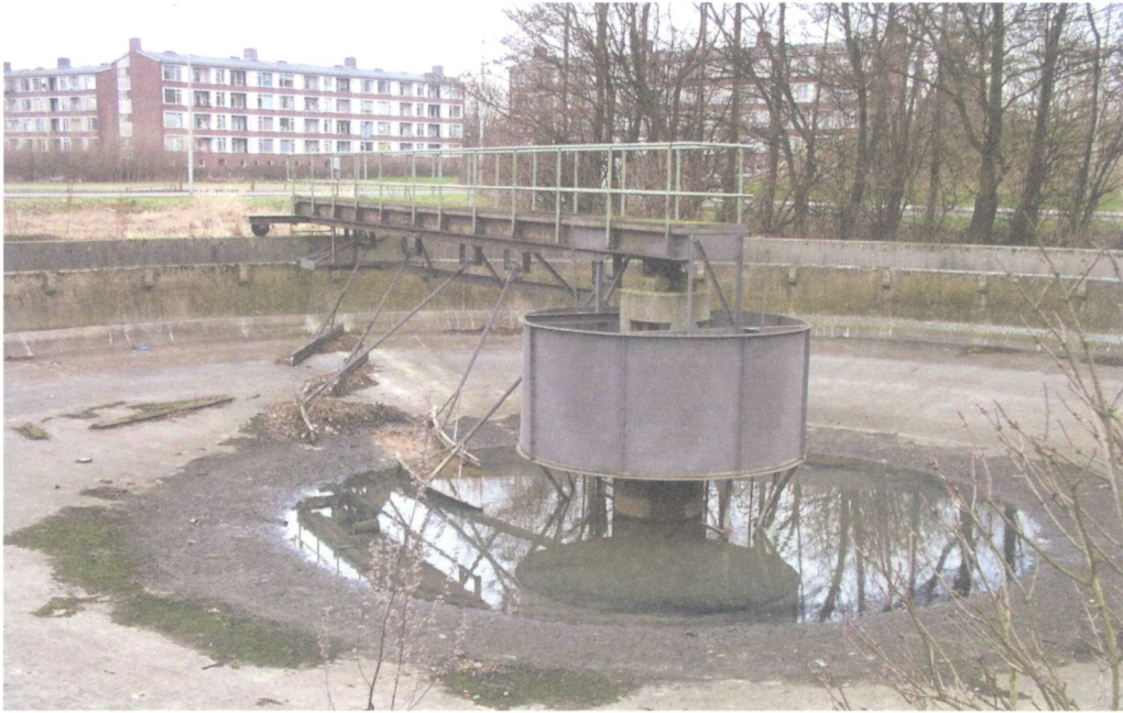
De restanten van de nabezinktank van de rioolzuivering op Rokkehage.