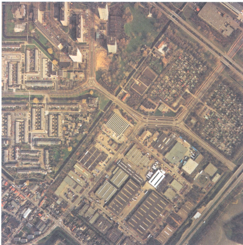
Luchtopname van Hoornershage. De bedrijven worden ontsloten door een interne ringweg. Rechtsboven zijn de volkstuinen te zien. Linksonder een stukje van Rokkehage, met het Wilgenplein en de begraafplaats. De Zegwaartseweg met weterring links vormt de begrenzing met de wijk Palenstein.