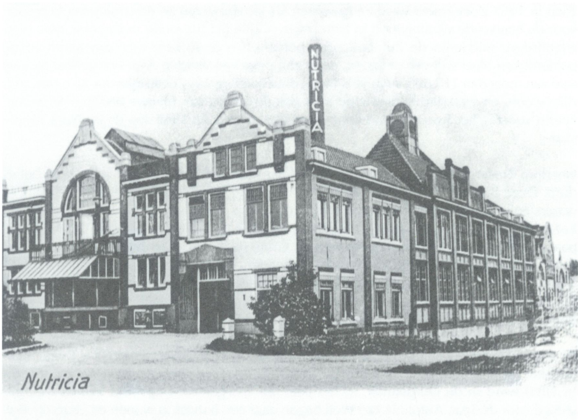
De oude fabriek van Nutricia aan de Eerste Stationsstraat.