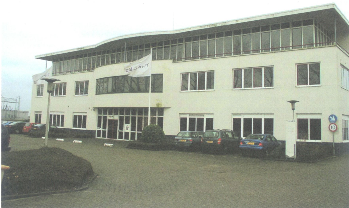
Kantoor met bedrijfshal aan de Bleiswijkseweg, naar ontwerp van architectenburo Rondeltap -Oosterheert.