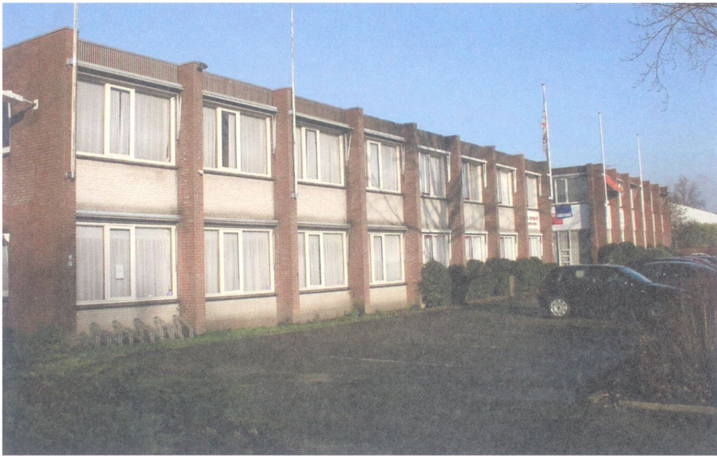
Bedrijfsgebouw uit 1975 aan de Wiltonstraat in Hoornershage, naar ontwerp van architect D. Huurman. Het vooruitspringende deel rechts is later aangebouwd.