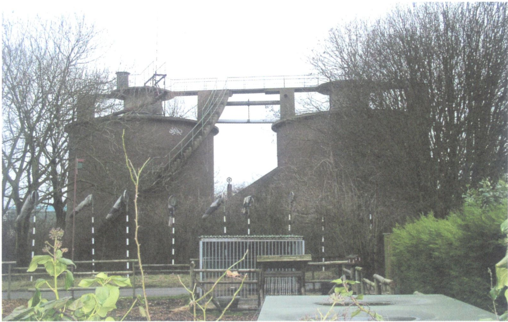
Het markante silhouet van de slijkgistingstanks op Rokkehage.