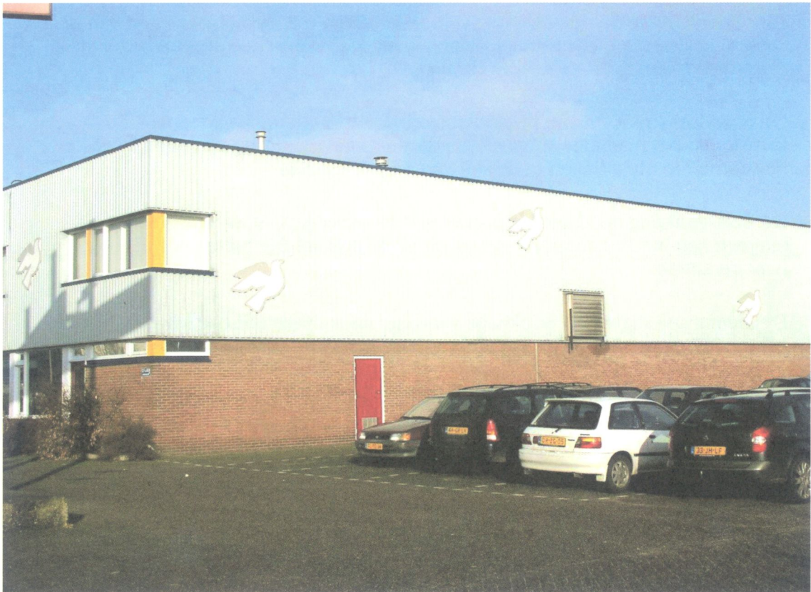
Functionele doosvormige gebouwen bepalen veelal het beeld van de bedrijventerreinen (Philipsstraat, Hoornrhage).