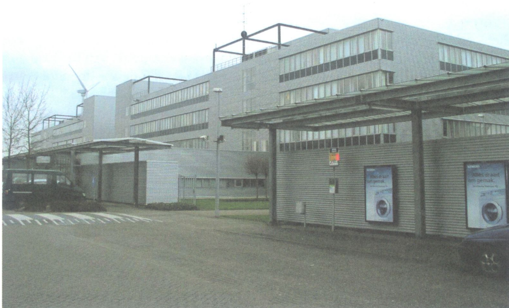
De gebouwen van Siemens op Brinkhage, op de achtergrond de windturbine.