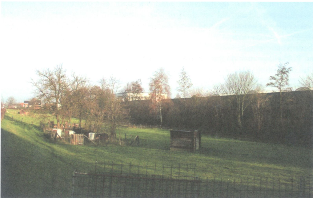
De afstand tussen de bedrijven op Zoeterhage en de historische Zegwaartseweg is ruim gehouden. Een brede groenstrook vormt de scheiding.