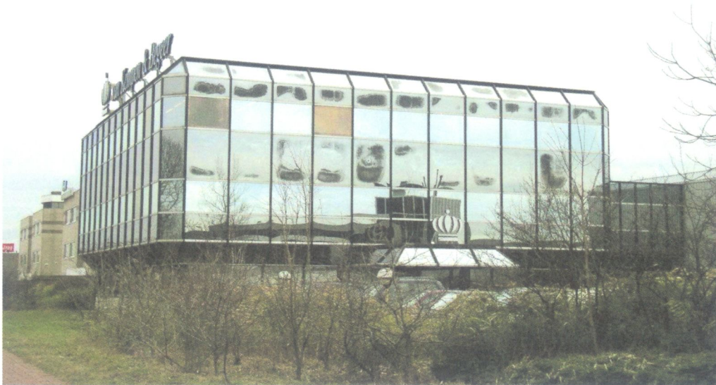
Het kantoor van Van Kempen & Begeer (1985) op Lansinghage Noord is een vroeg voorbeeld van representatieve bedrijfsarchitectuur.