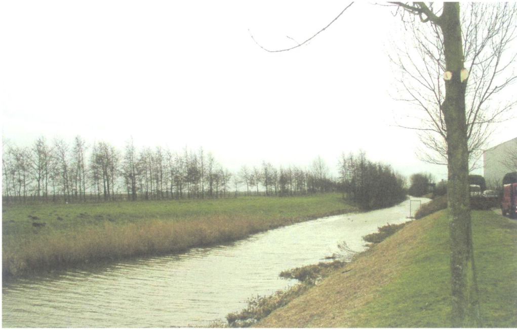
Lansinghage wordt begrensd door een brede poldersloot en door de Landscheidingsdijk.