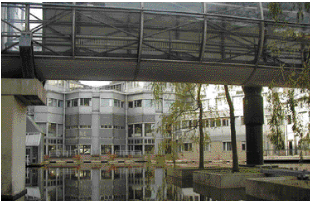
Het gebouw van het ministerie aan de Europaweg is een gaaf voorbeeld van structuralisme.