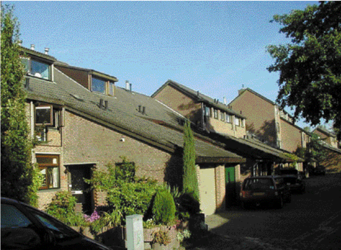
De kleinschalige en gevarieerde wijken uit de jaren zeventig kregen het predikaat Nieuwe Truttigheid. Afgebeeld zijn woningen van architect A. Alberts uit 1974.