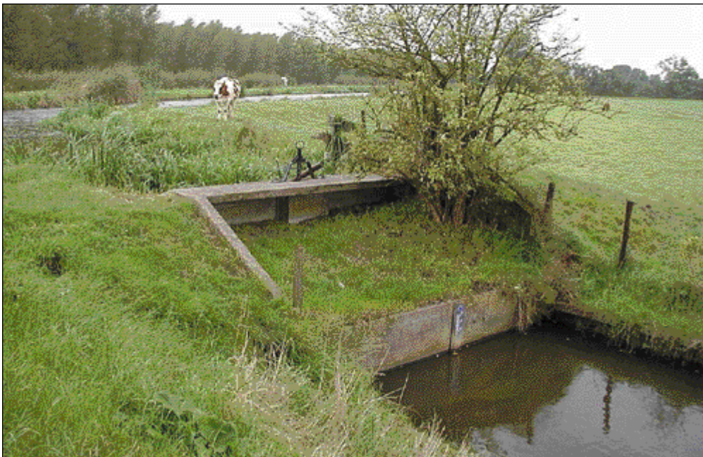
Het voormalige Benthuizer verlaat, een kleine sluis die het niveauverschil tussen de Benthuizervaart en de Elleboogse Wetering overbrugde.