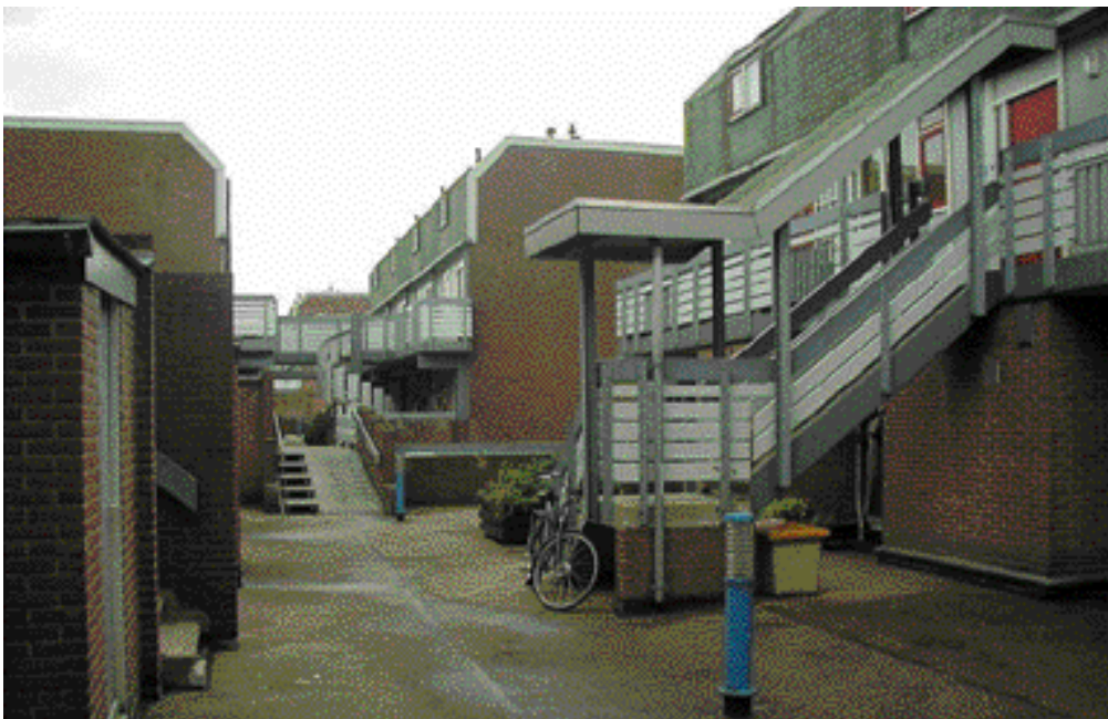
Woondek Fats Wallerode, één van de twee dekken van architect J.J. Sterenberg.