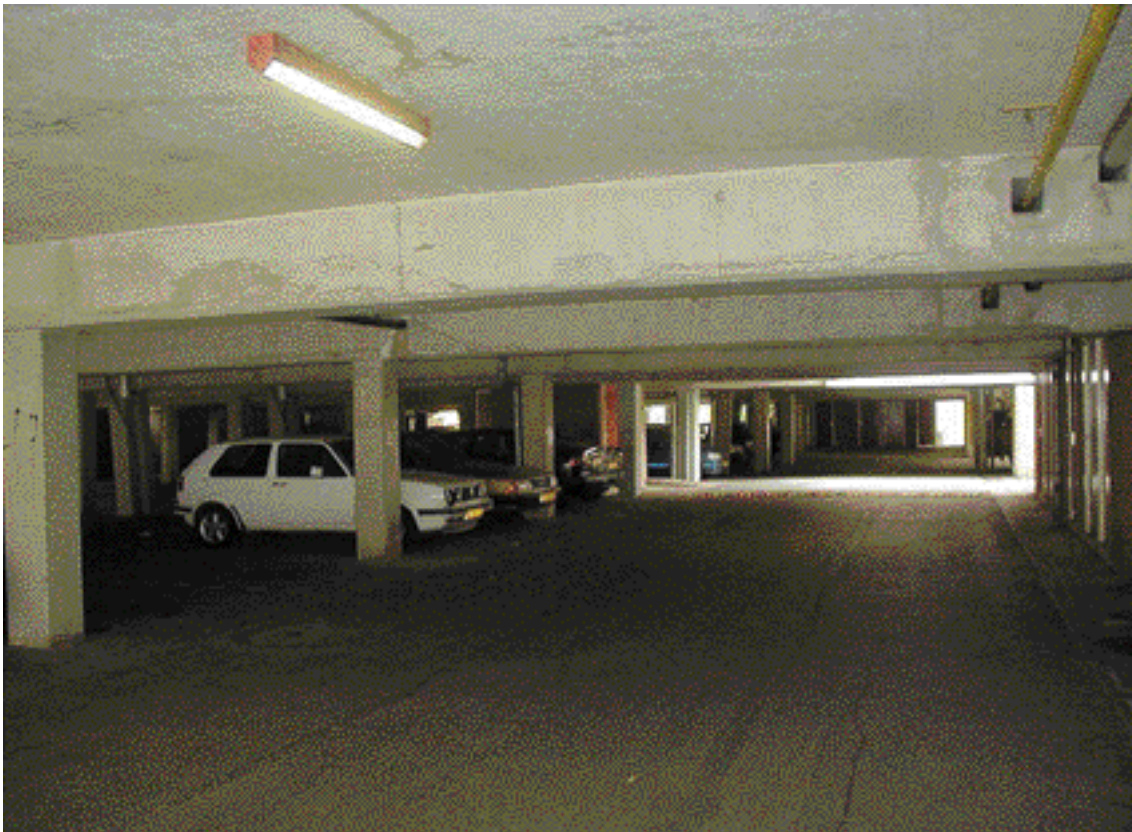
De parkeergarage onder het woondek van de Ravelrode.