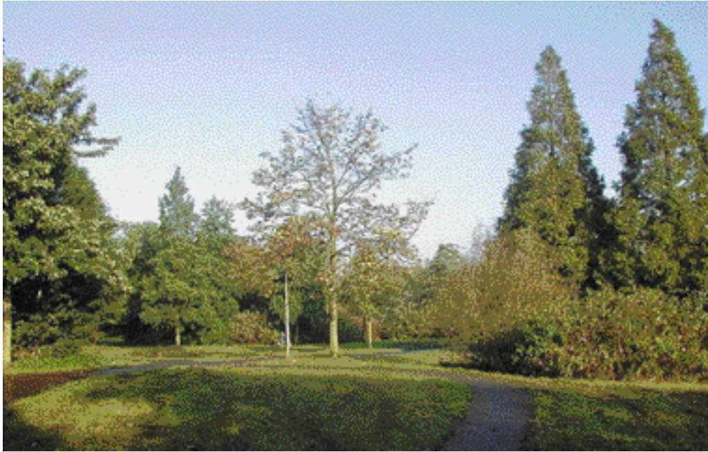
Het Binnenpark bevindt zich als centrale groenvoorziening tussen Buytenwegh en De Leyens in.