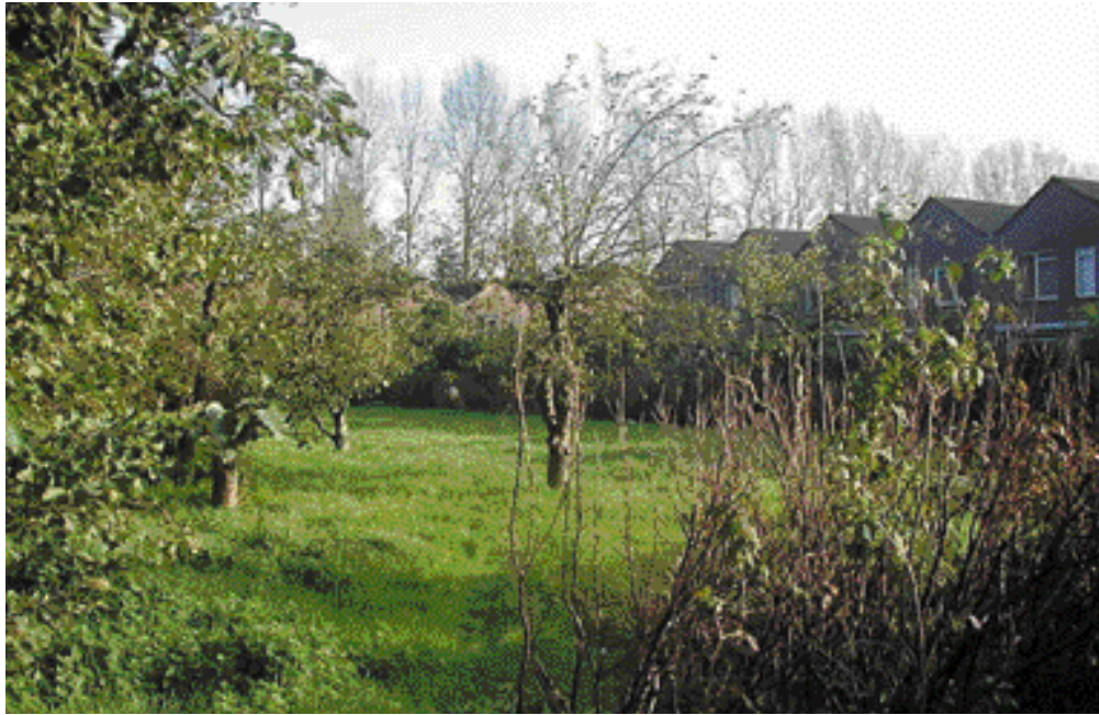
Boomgaard bij de Olivier Hardystrook.