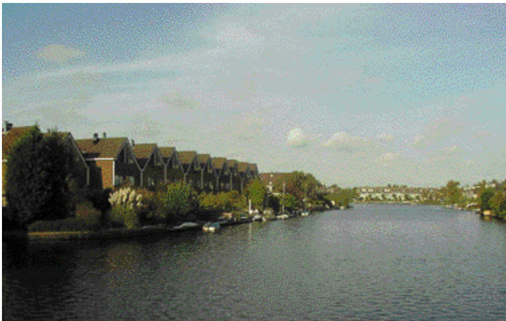
De woningen in het noordelijke deel van De Leyens liggen aan brede waterlopen die uitlopers vormen van de Zoetermeerse Plas.