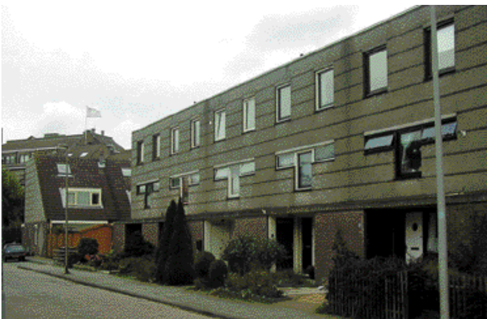
In de jaren tachtig wordt het architectuurbeeld strakker van lijn, zoals hier in deze woningen van Carel Weeber tot uitdrukking komt.