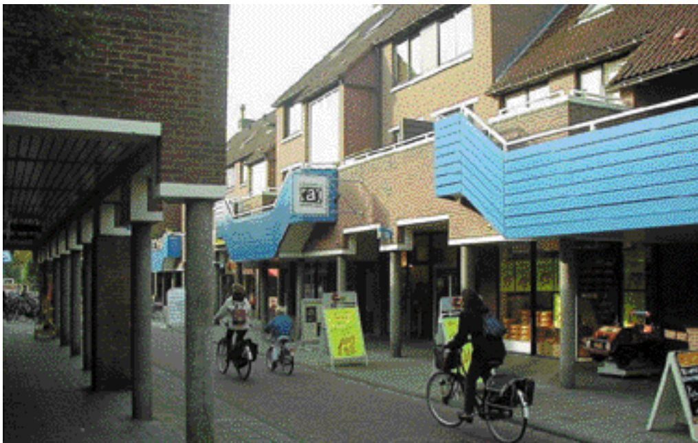
Het winkelcentrum van De Leyens, een ontwerp van architectenburo Spruit, De Jong en Heringa uit 1979, aan de Broekwegzijde.