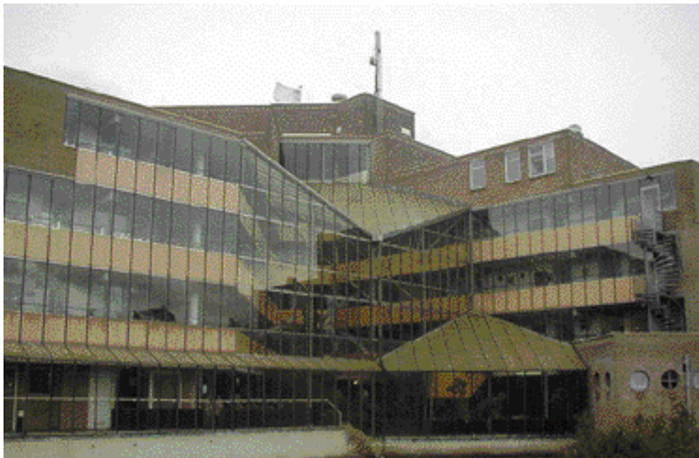
Blikvanger van het dienstencentrum aan de Gondelkade, een ontwerp van architect Hans van Beek, is de glasgevel.