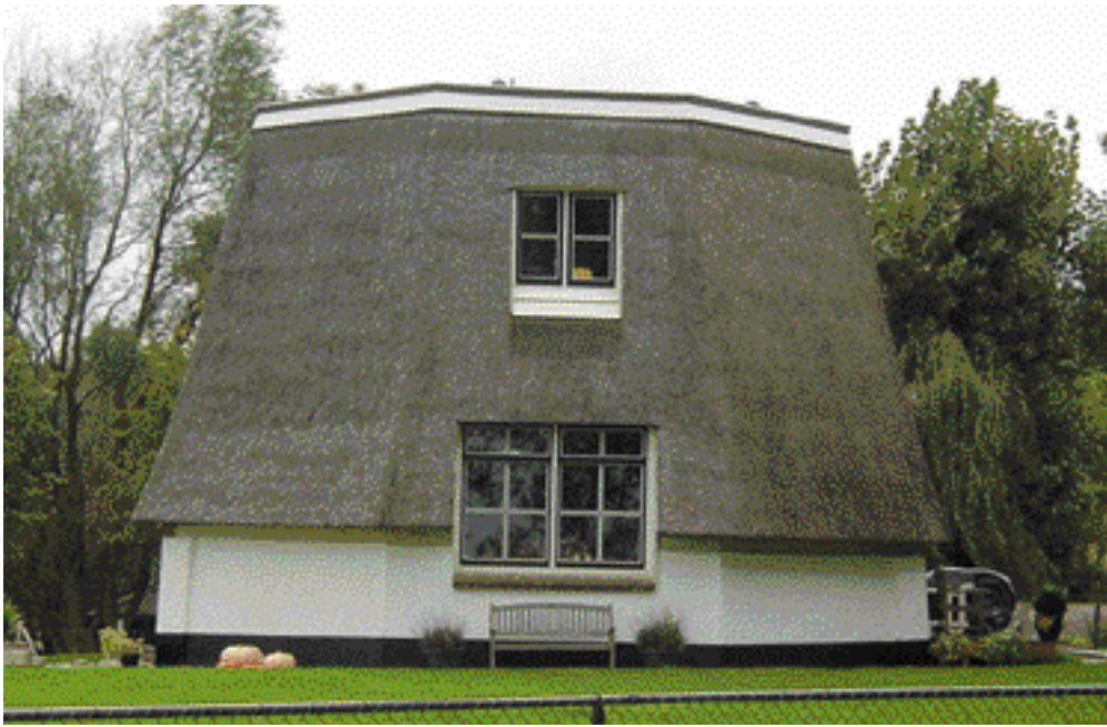
Eén van de drie afgeknotte molens aan de Slootweg.