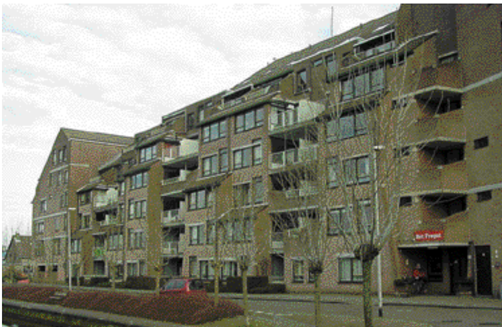
Serviceflat Het Fregat van architect A. Alberts.