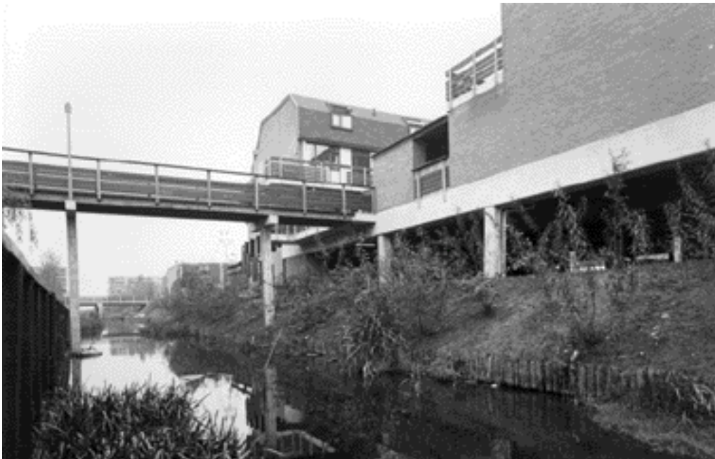
Hier kruist het woondek de tochtsloot.