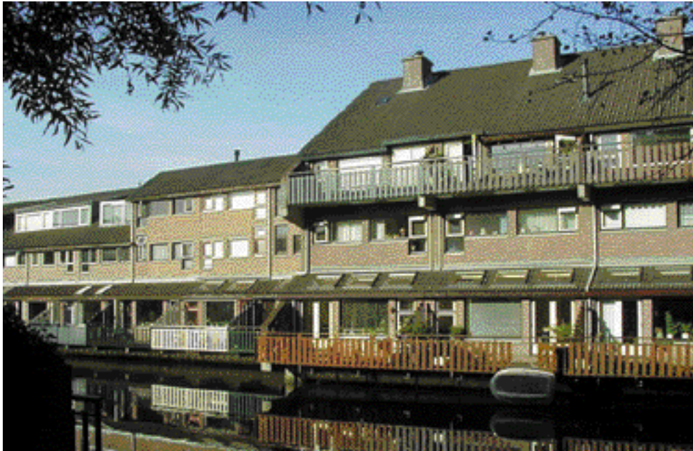
Het wijkje van architect A. Alberts rondom de Penninghove is gebouwd in relatie tot de Hoofdtocht. De woningen zijn met hun achterzijde op het water georiënteerd.