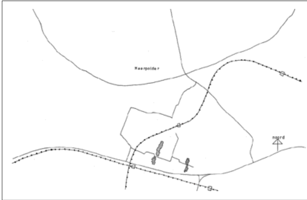
De dijkwoningen in de Hovenbuurt langs de Bloemhove/Blamanhove en de Coornherthove/Couperushove zijn naar ontwerp van architectenburo Coen Bekink uit Groningen.