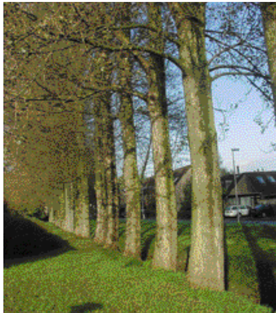
Een windsingel van populieren langs de Hitchcockstrook. In Buytenwegh de Leyens werden onderdelen van het oude landschap zoveel mogelijk in de stedenbouwkundige opzet ingepast.