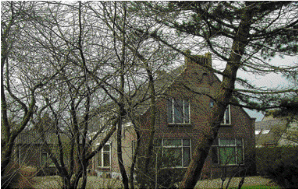
De boerderij 'Ora et Labora' (bid en werk) is de enige overgebleven boerderij aan de Broekweg.