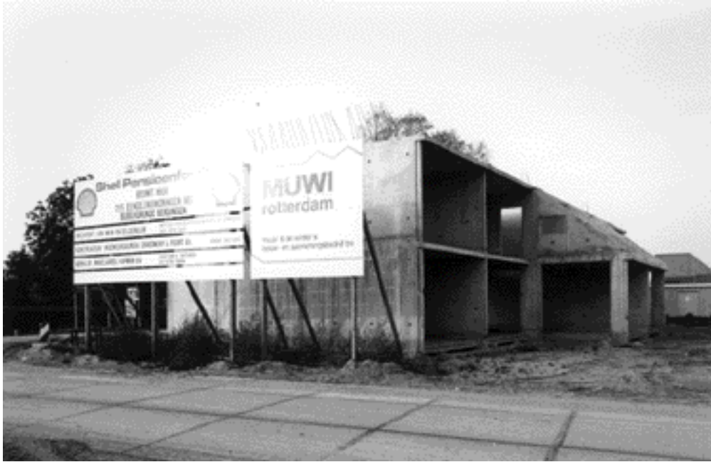
De 295 woningen van Shell Pensioenfonds in aanbouw in 1976.