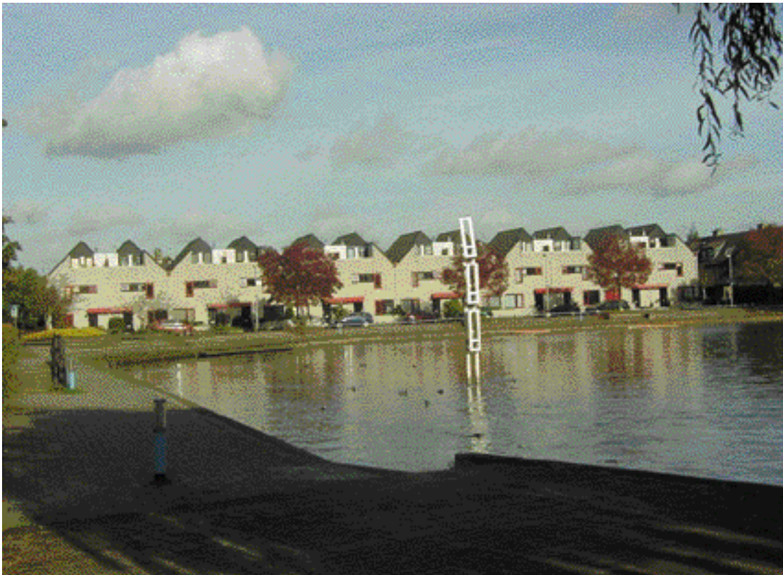
Bouwplan van Groosman & Partners, architect Ron Forrer, aan de Broekwegwetering. In het water een sculptuur van Dick Box.