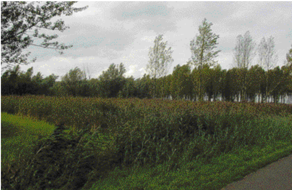
Aan de noordkant van de Zoetermeerse Plas ontstond 'per ongeluk' het Prielbos, een elzenbroekbos met een rijk planten- en dierenleven.