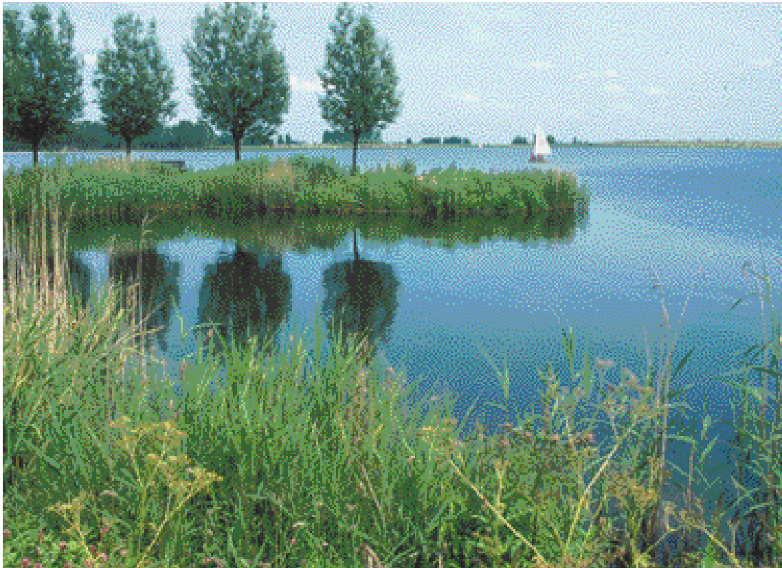
Nadat de polder ten behoeve van zandwinning weer onder water was gezet, ontstond de Zoetermeerse Plas, een geliefd recreatiegebied.