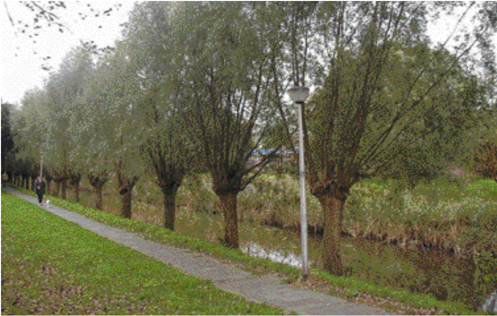
Oude tochtsloten zoals hier de Hoofdtocht, bleven als historische landschapselementen gehandhaafd. Dit in tegenstelling tot de bouw van Palenstein, Driemanspolder en Meerzicht waar het oude landschap werd uitgevlakt.