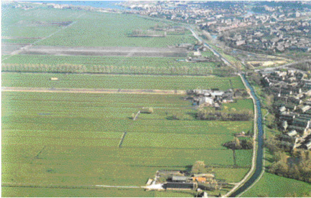
De aftekening van de Meerpolder in het landschap is goed herkenbaar. Aan de rechterkant grenst de bebouwing van Buytenwegh de Leyens aan de Meerpolderdijk.