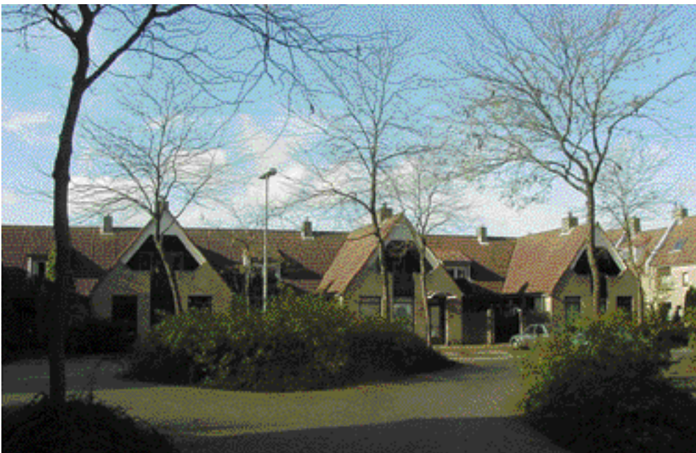
Nieuwe huizen uit 1979 met de sfeer van ouderwetse hofjeswoningen aan de Hoekerkade.