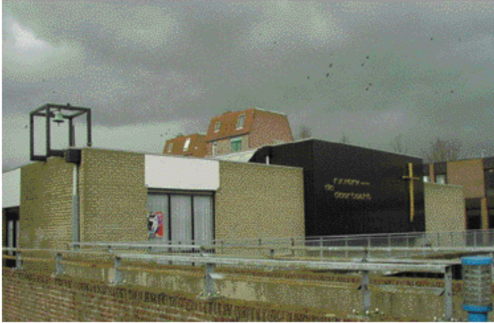
De katholieke kerk De Doortocht uit 1975 is in het bezit van een historisch klokje uit 1768.