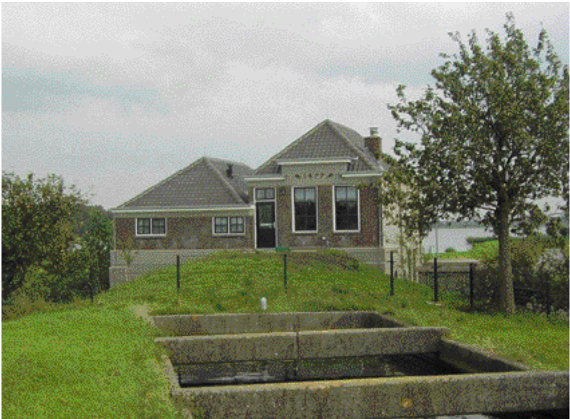
Het voormalige stoomgemaal De Nieuwe Polder uit 1877, met op de voorgrond de uitstroom naar de Noord-Aasche Vliet. Dit gemaal verving vier molens die tussen 1767 en 1771 de Zoetermeerse of Nieuwe Drooggemaakte Polder hadden drooggemalen.