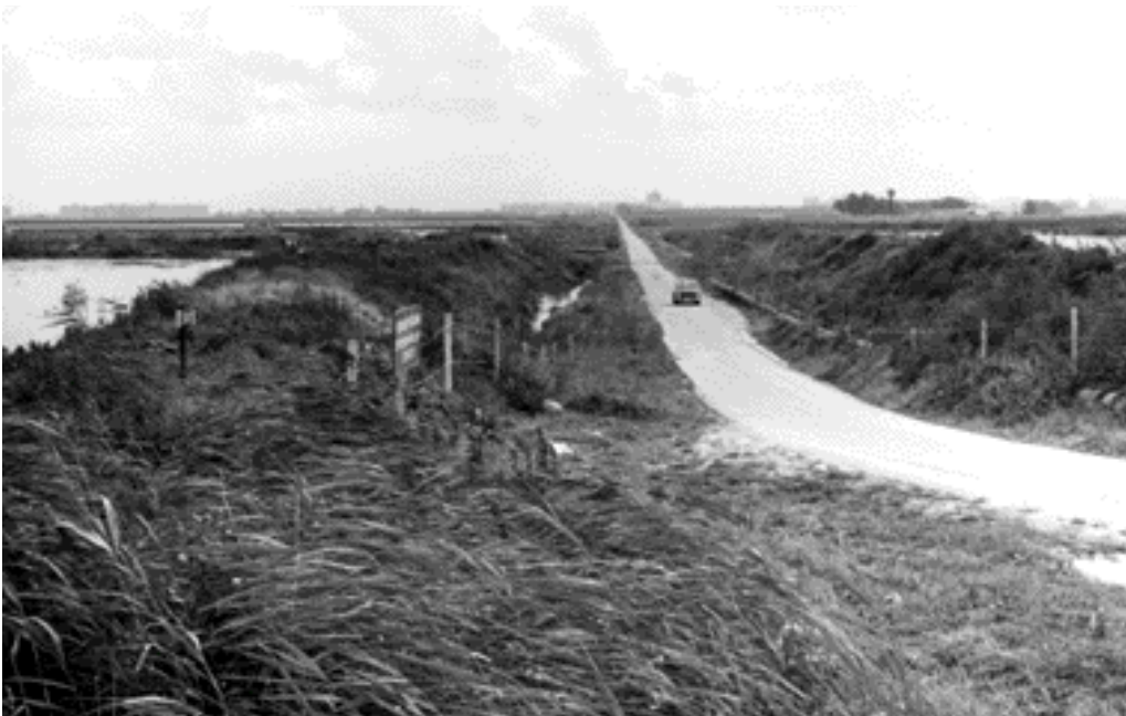
De Broekweg in 1972, ter hoogte van de Zoetermeerse Plas die toen in aanleg was. Gezien in de richting van Zoetermeer.