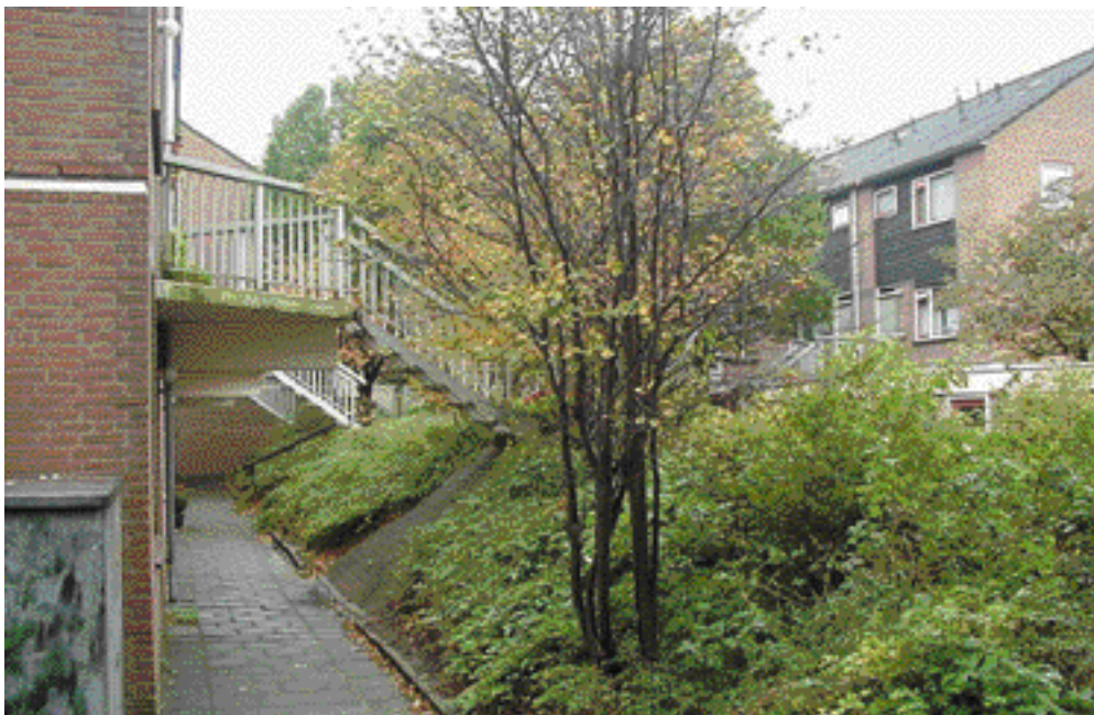
De dijkwoningen zijn gelegen aan een kunstmatig verhoogde dijk en via buitentrappen bereikbaar.