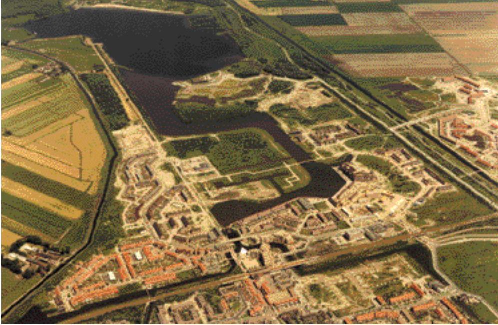
Luchtfoto van het Plassengebied, voor de uitbreiding van de Plas aan het eind van de jaren tachtig. Rechts loopt de Leidsewallenwetering nog ononderbroken door tot aan de oude molengang. Op de voorgrond De Leyens, rechts de wijk Seghwaert en links de Meerpolder.