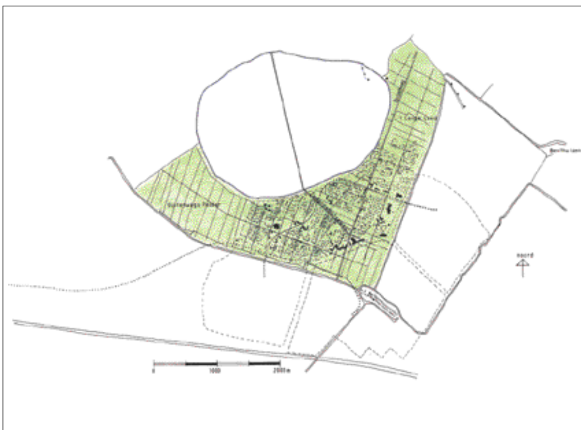
In Buytenwegh de Leyens zijn diverse structurerende onderdelen te herkennen, zoals de naar het noorden lopende Broekweg uit 1295, de Zwaardslootseweg en de Hoofdtocht die van het Buytenpark naar de Van Eedenhove loopt.