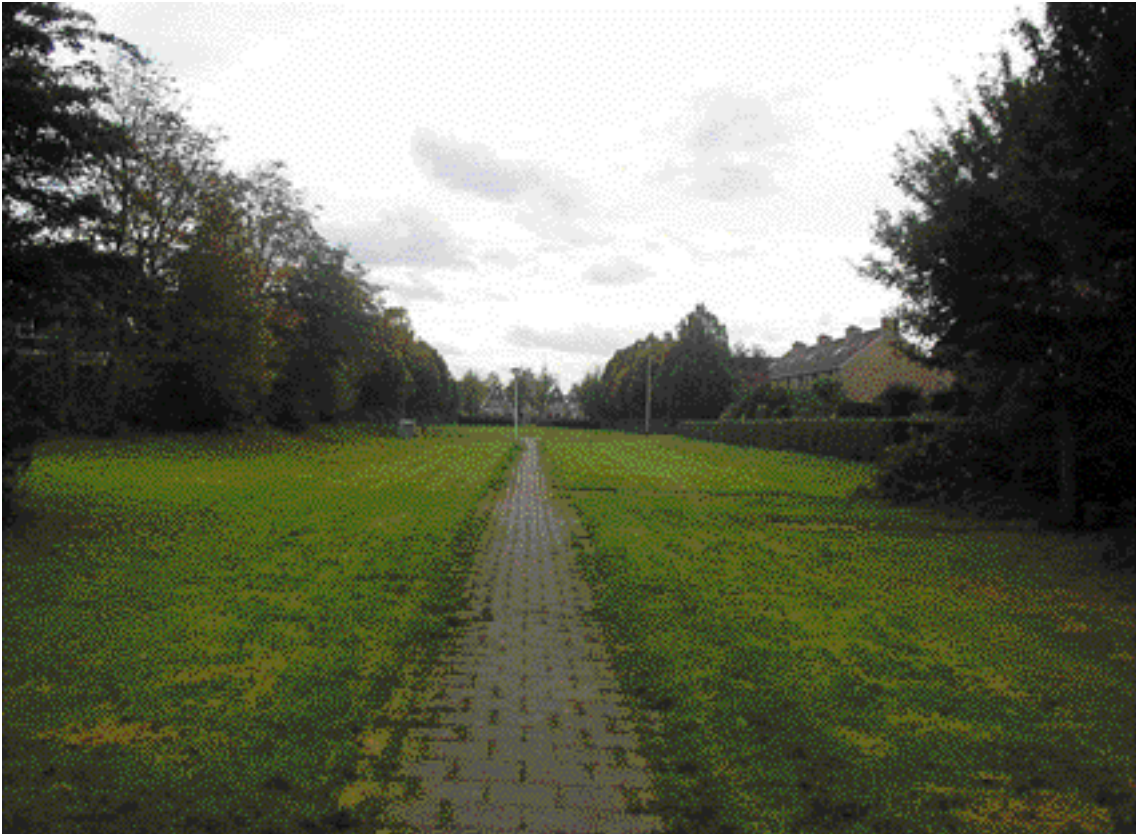
Tussen de Aziëweg en de Columbusrede ligt een brede groenas, die ongeveer in het midden doorsneden wordt door de Jachtwerf. De groenas vormt in De Leyens de scheiding tussen de Werven- en de Kadenbuurt.