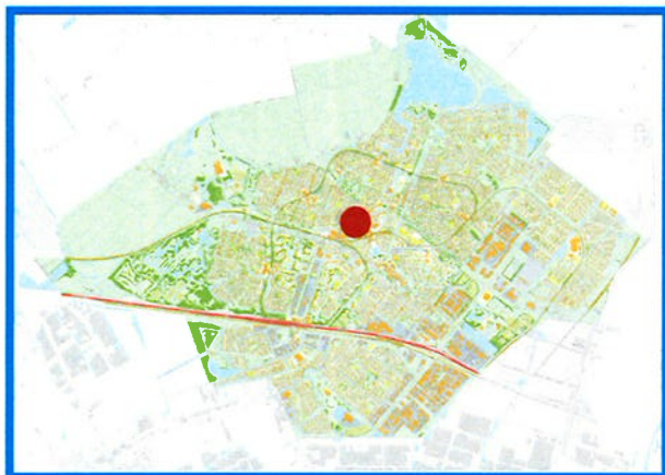
ligging in Zoetermeer