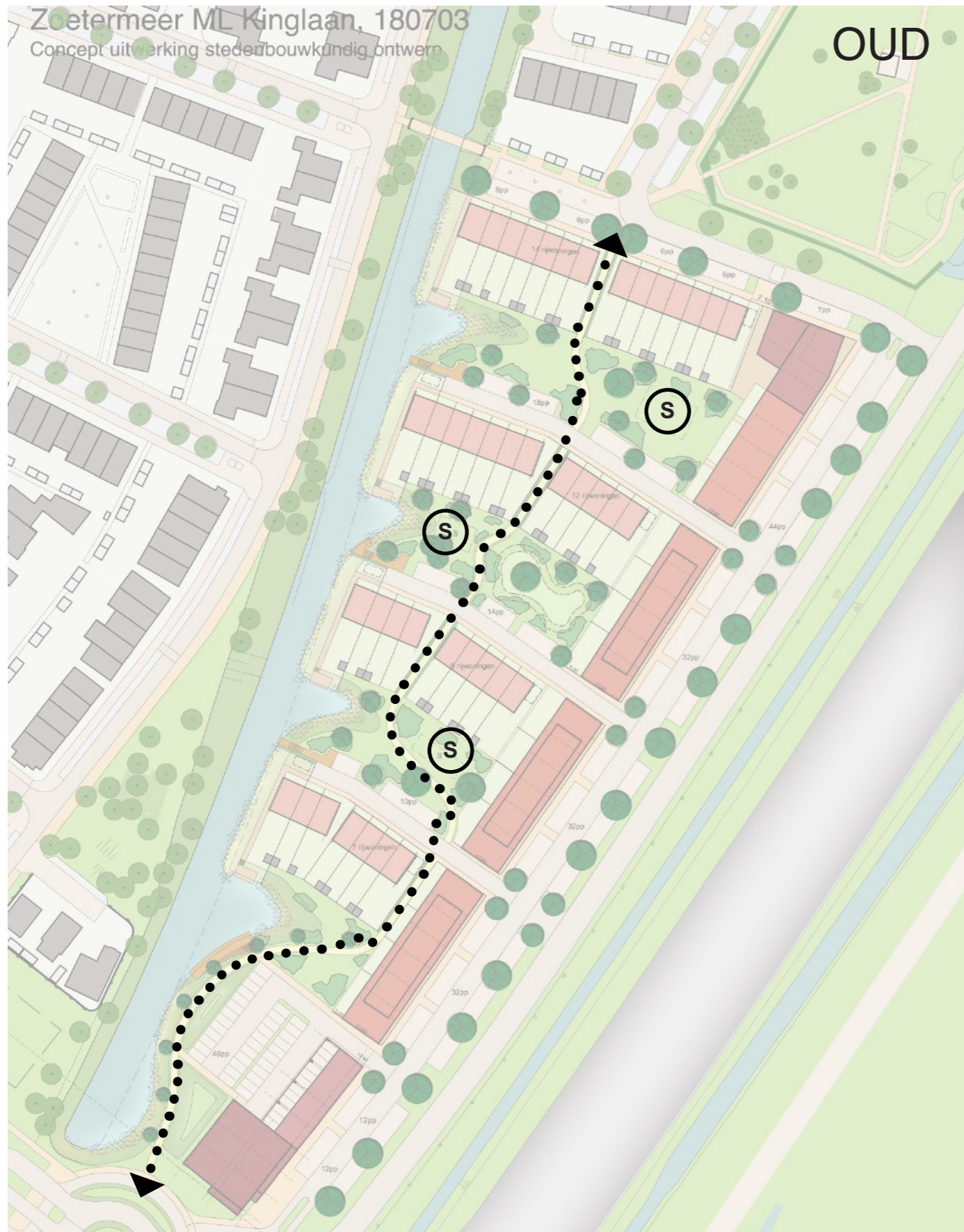
Plan juli 2018