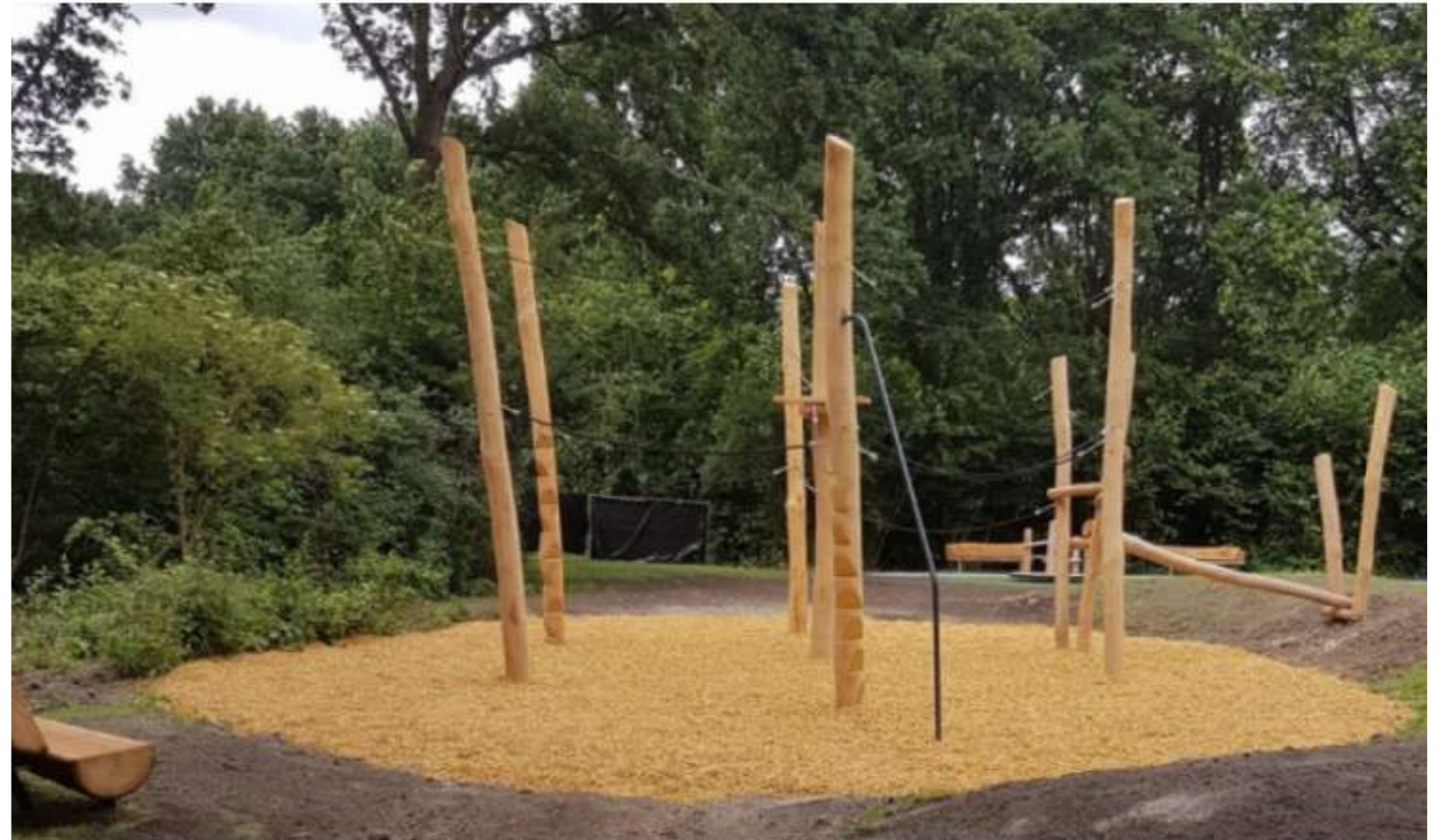
Drie plekken met 'natuurlijk spelen'