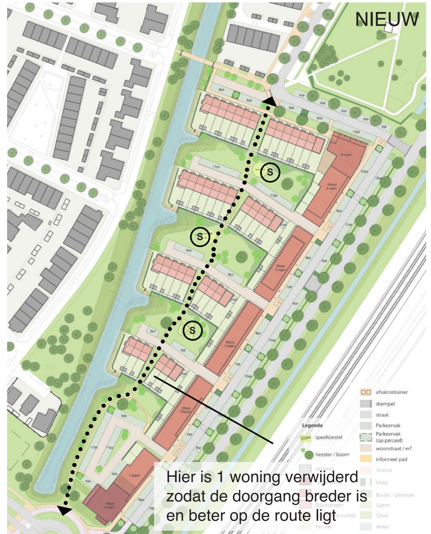
Plan februari 2019