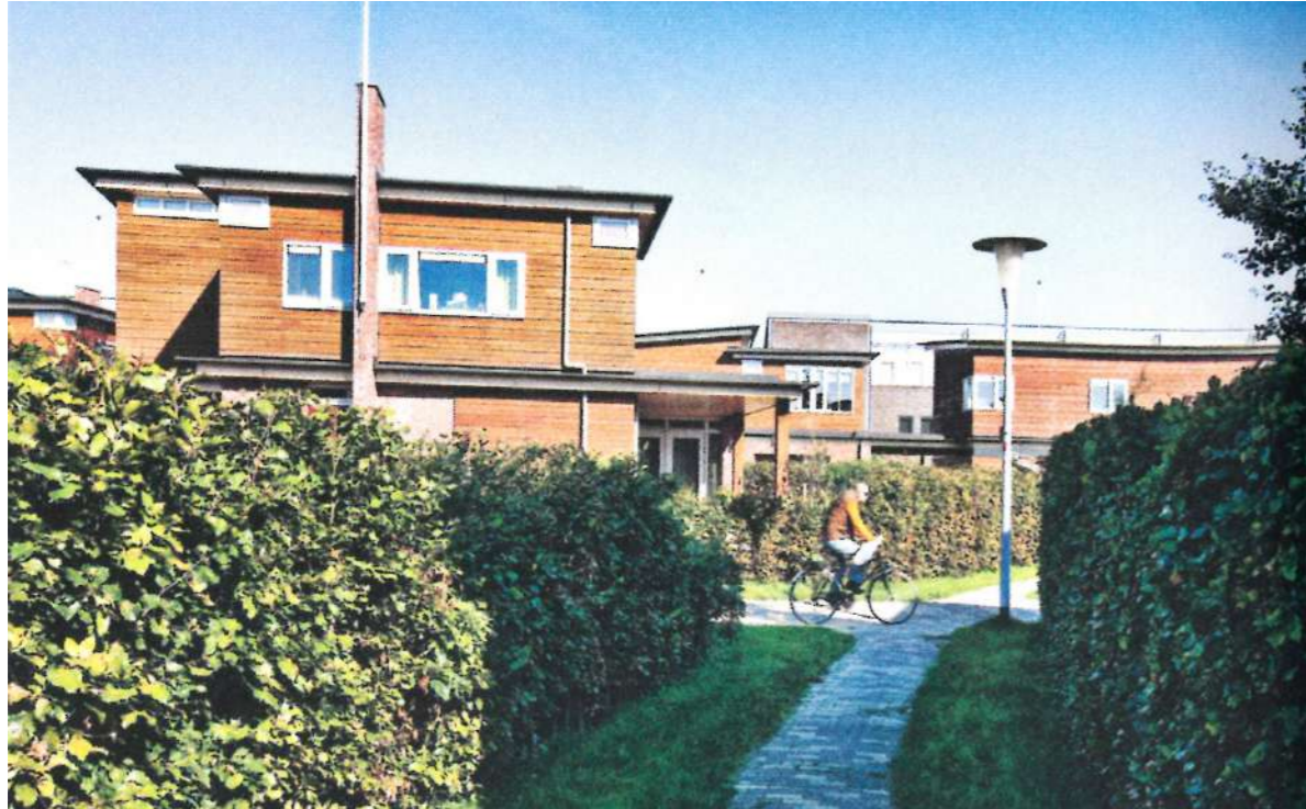
Karakter van de informele route