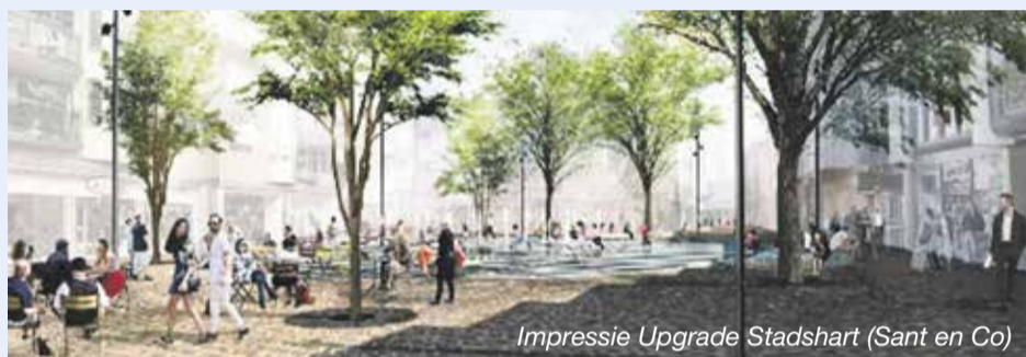
Impressie Upgrade Stadshart (Sant en Co)

om extra natuursteen te bestellen in China. Door de coronapandemie duurt de levering langer dan verwacht. Hierdoor kunnen niet alle werkzaamheden op het Promenadeplein afgemaakt worden. Daarom is het Promenadeplein nu tijdelijk dicht gestraat met noodbestrating, zodat het Promenadeplein toch bereikbaar is. Naar verwacht wordt het nieuwe natuursteen in april 2022 geleverd en kunnen de resterende werkzaamheden weer worden opgepakt. Zodra de werkzaamheden weer worden opgepakt en wanneer er iets verandert in de bereikbaarheid van het Promenadeplein, wordt u hierover geïnformeerd in de BouwApp. Meer informatie is ook te vinden op www.zoetermeer.nl/upgradestadshart