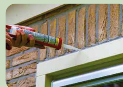
double glass HR+++