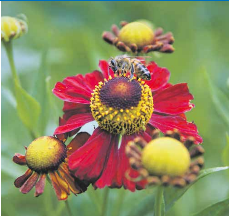
Een wilde bij

In mei zijn honingbijen en andere (wilde) bijensoorten erg actief en gaan ze zwermen. Een prima moment om op World Bee Day stil te staan bij het belang van deze nuttige diertjes. Want zonder bijen en hommels blijft ons winkelwagentje in de supermarkt leeg. Als bijen en hommels onze zaden en vruchten niet zouden bestuiven, door van bloem naar bloem te vliegen, dan kunnen wij niet genieten van appels, kersen en andere soorten fruit. Hoe kunnen we de bijen en hommels helpen? De gemeente Zoetermeer draagt bij door bermen in te richten met veel bloemen die vol zitten met voedsel voor