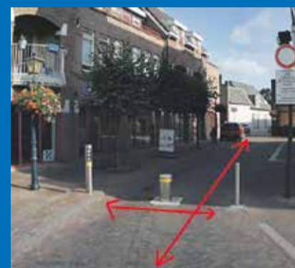
De rode pijlen geven aan waar er gegraven gaat worden. De bestrating wordt dezelfde dag nog hersteld.

Op maandag 21 augustus kan er via de Eerste Stationsstraat geen verkeer in en uit de Dorpsstraat. De toegang is tussen 7.00 en 18.00 uur afgesloten. Dat komt omdat de poller wordt gerepareerd. Dit is de paal die wegzakkt in het wegdek om de toegang van auto's tot de Dorpsstraat te controleren. De poller op de locatie Pilatusdam/Dorpsstraat staat op 21 augustus naar beneden, zodat auto's hier wel kunnen passeren richting Dorpsstraat.