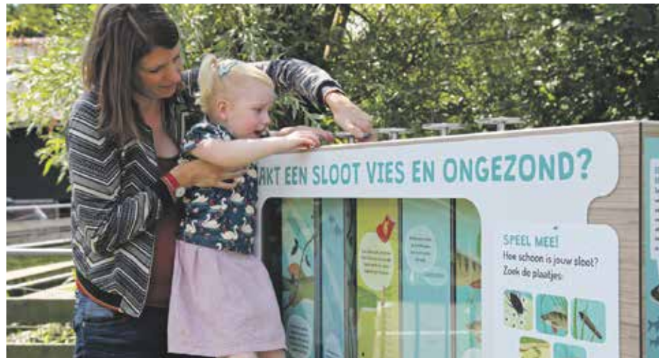
Slootspel stadsboerderij de Weidemolen

Iedereen kan bijdragen aan droge voeten en gezond water. Wilt u een steentje bijdragen of meer leren over gezond water? Lees hier wat u in de Week van Ons Water kunt doen!