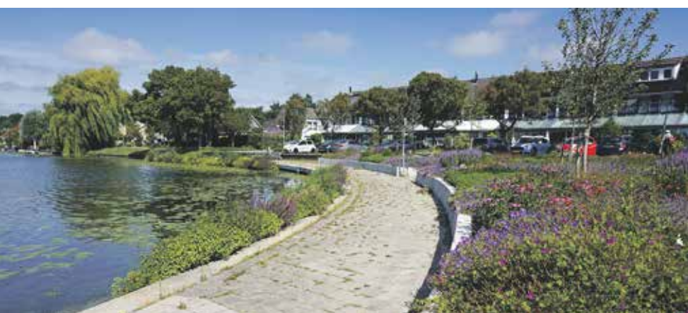
Drijvend planteneiland bij de Broekwegwetering

Ook veel vogelsoorten voelen zich er thuis. De groene oevers dragen ook bij aan een betere waterkwaliteit. Riet en onderwaterplanten halen namelijk overbodige voedingsstoffen uit het water. Daarom maken de gemeente en Rijnland de oevers van Zoetermeer groener dan ooit.