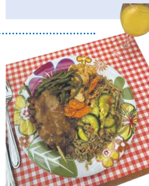
Eetinitiatief Teamwerk Eetclub bij Eetcafé de Leyens