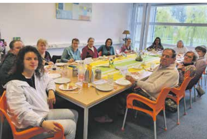
Wijkdiner van Piëzo in Buytenwegh

Het hele interview leest u op www.zoetermeertegeneenzaamheid.nl .