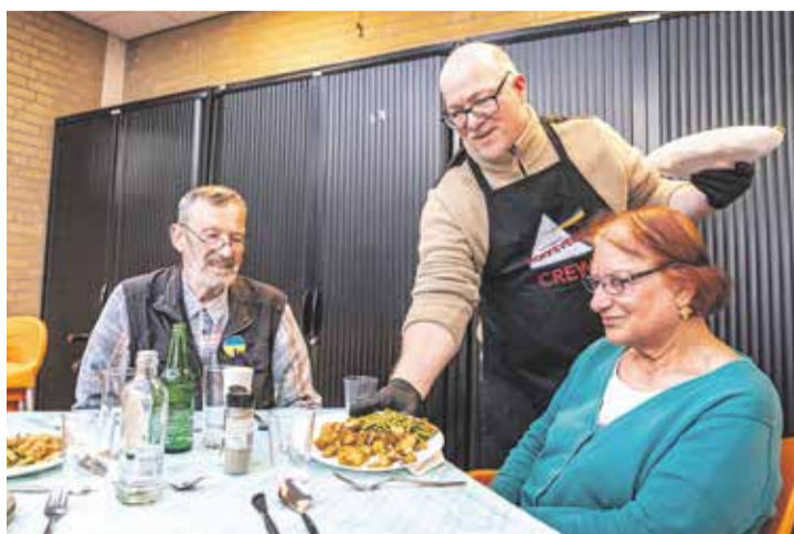
Eten en ontmoeten bij Wijkvereniging Rokkeveen