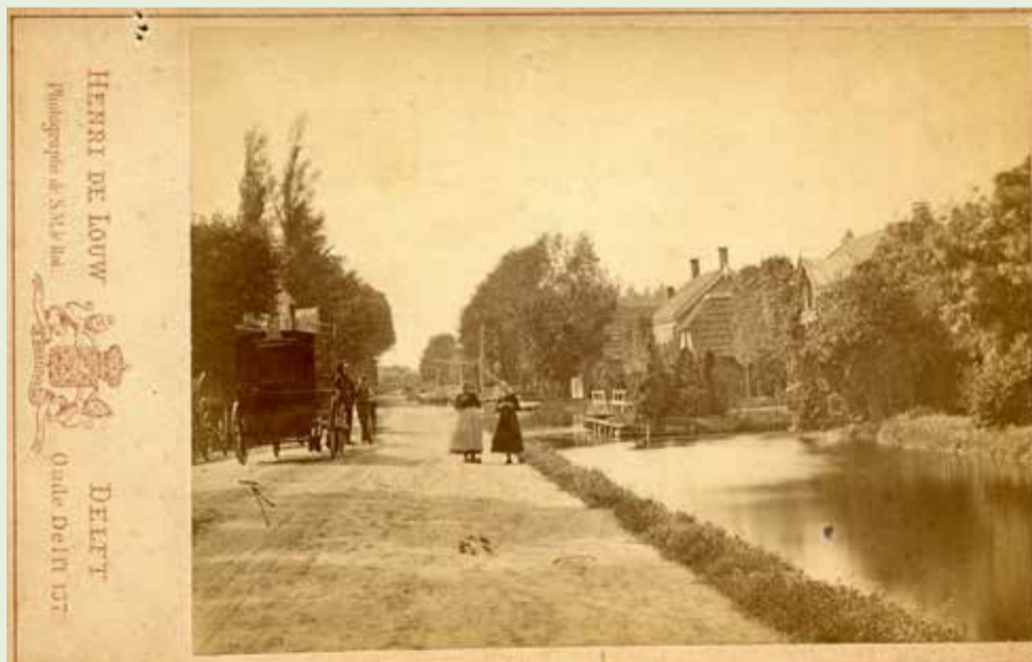
Vlamingstraat ter hoogte van nummer 6, 8 en 10 met op de weg een postkoets.

Hiervoor hebben wij uw hulp nodig! Het Stadsarchief en het HGOS komen graag in contact met de volgende fotografen: