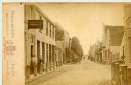
De Dorpsstraat in Zegwaart richting Lagereinde.