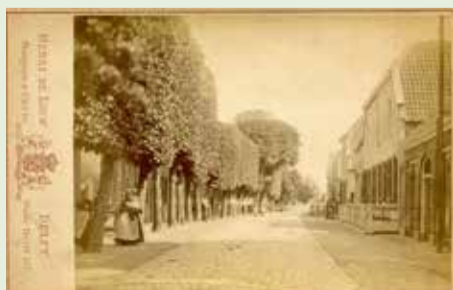
De Dorpsstraat in Zegwaart met rechts het brandspuithuis/wachthuis.