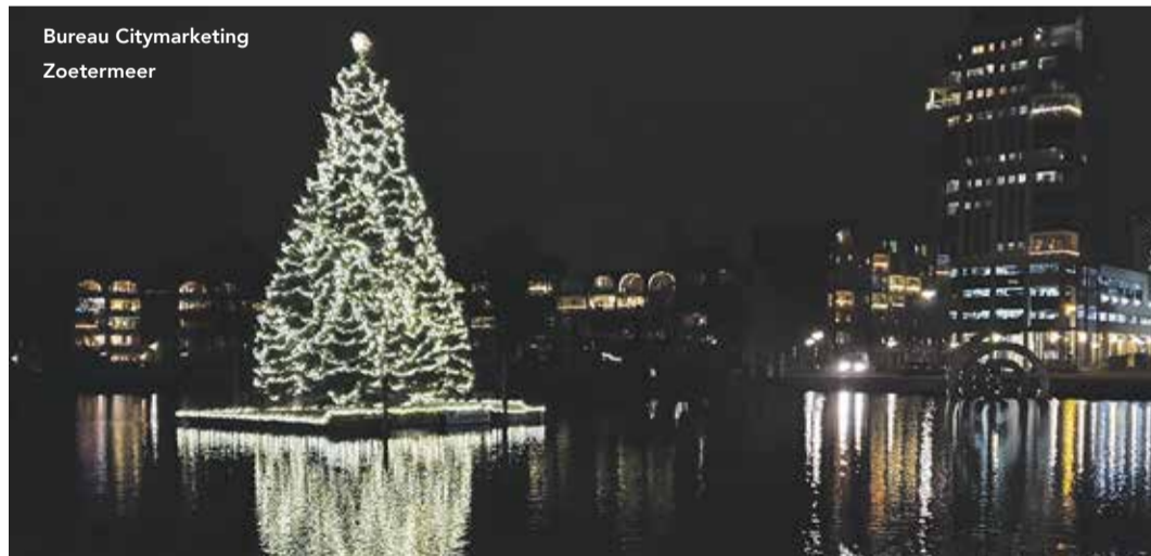
Bureau Citymarketing Zoetermeer

Op dinsdag 13 december vindt het jaarlijkse lichtjesfeest aan de Dobbepas en in de Dorpsstraat plaats. Burgemeester Michel Bezuijen steekt om 18.50 uur de maar liefst zeventien meter hoge stadskerstboom met 60.000 led-lampen bij de Dobbepas aan.