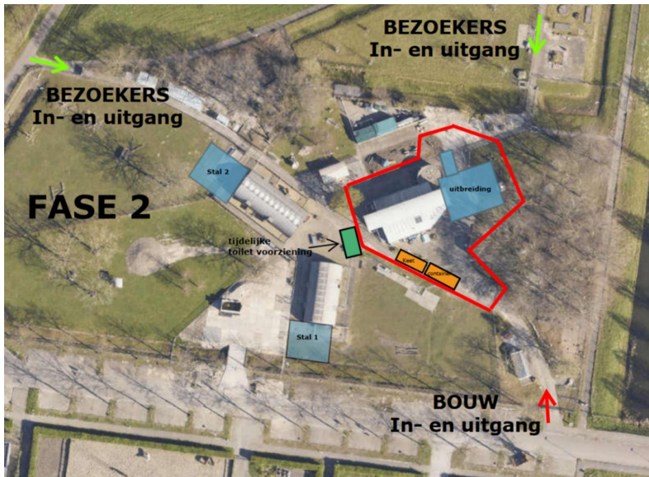
Fase 2: Oktober 2021 tot April 2022.