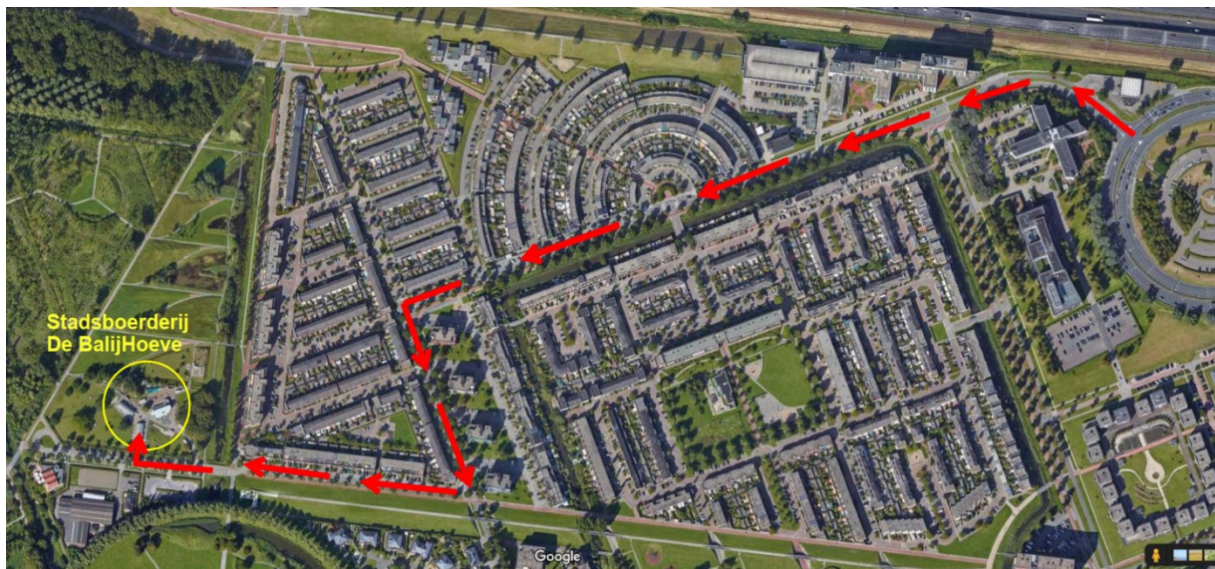
Aanrijroute bouwverkeer naar stadsboerderij Balijhoeve

De aanrijroute voor al het verkeer (personeel, materiaal en materieel) is via de A12, Zuidweg, Houtsingel, Woudlaan en Kurkhout. De auto's en bedrijfsbussen zullen worden geparkeerd buiten het bouwterrein op de parkeervoorzieningen langs de Kurkhout. De aannemer geeft aan dat er bij verkeersbewegingen van, naar en nabij de bouwlocatie rekening gehouden wordt met de omwonenden. Zeker waar onze aanrijroute de fiets en wandelpaden kruist, zal de aannemer de leveranciers er dan ook op wijzen dat hier stapvoets moet worden gereden. Achteruitrijden buiten de bouwplaats geschied zoveel mogelijk onder toezicht en begeleiding.