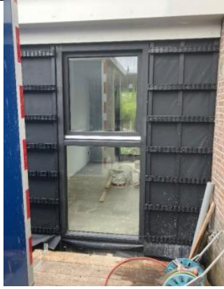
Huidige situatie