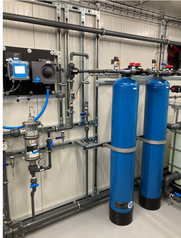
DEXfilter pilot onderzoek op AWZI Lelystad.

Als waterschap zijn we actief betrokken bij de Programmacommissies Waterketen en Afvalwatersystemen van STOWA. Vanuit deze programmacommissies worden diverse onderzoeken vanuit STOWA geïnitieerd en opgestart. Afhankelijk van nut en noodzaak voor ons waterschap zijn we daarbij soms actief betrokken. We zoeken steeds naar mogelijkheden om onderzoeken c.q. pilots in onze regio plaats te laten vinden zodat we niet alleen kennis kunnen opdoen maar tevens regionaal / lokaal de toepassingen kunnen uitproberen.