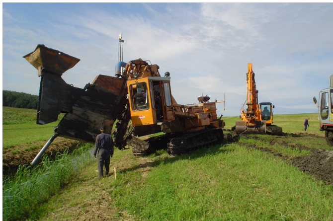
Aanleg drainage binnenzijde primaire kering

In de Noordoostpolder zijn meer dan 80 jaar geleden de eerste waterstaatswerken aangelegd. Sommige onderdelen van deze werken lopen op het einde van hun levensduur. Inspecties laten zien dat de damwanden van veel kunstwerken in de komende decennia vervangen moeten worden. Met inspecties prioriteren we deze werkzaamheden.