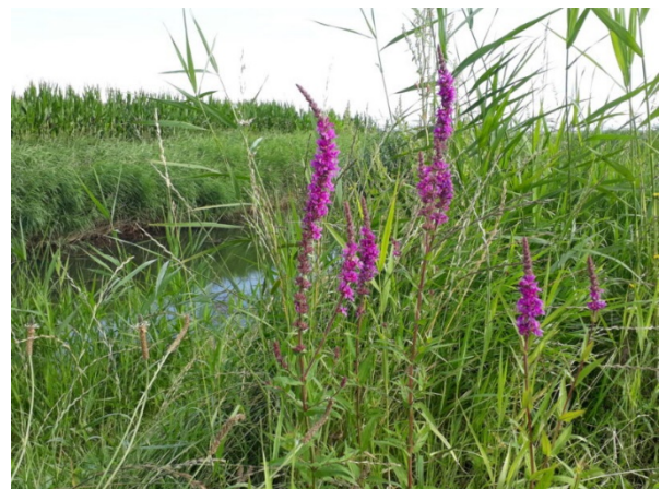
Natuurvriendelijk slootkantenbeheer en afvoeren maaisel langs tochten door BoerenNatuur Flevoland

Daarnaast evalueren we in 2024 tussentijds de Agenda Biodiversiteit en rapporteren we over de voortgang aan de Algemene Vergadering. We bereiden ons daarbij ook voor op het wegvallen van de subsidie van de provincie Flevoland vanaf 2026 en vervolgen de uitwerking van het groeimodel tot 2030. Biodiversiteit heeft daarmee een plek gekregen in ons reguliere werk. In 2024 onderzoeken we, in samenhang met de evaluatie van de Agenda, wat er nodig is op het gebied van aanpak, activiteiten, kennis en capaciteit om biodiversiteit ook op lange termijn te borgen in de lijnorganisatie.