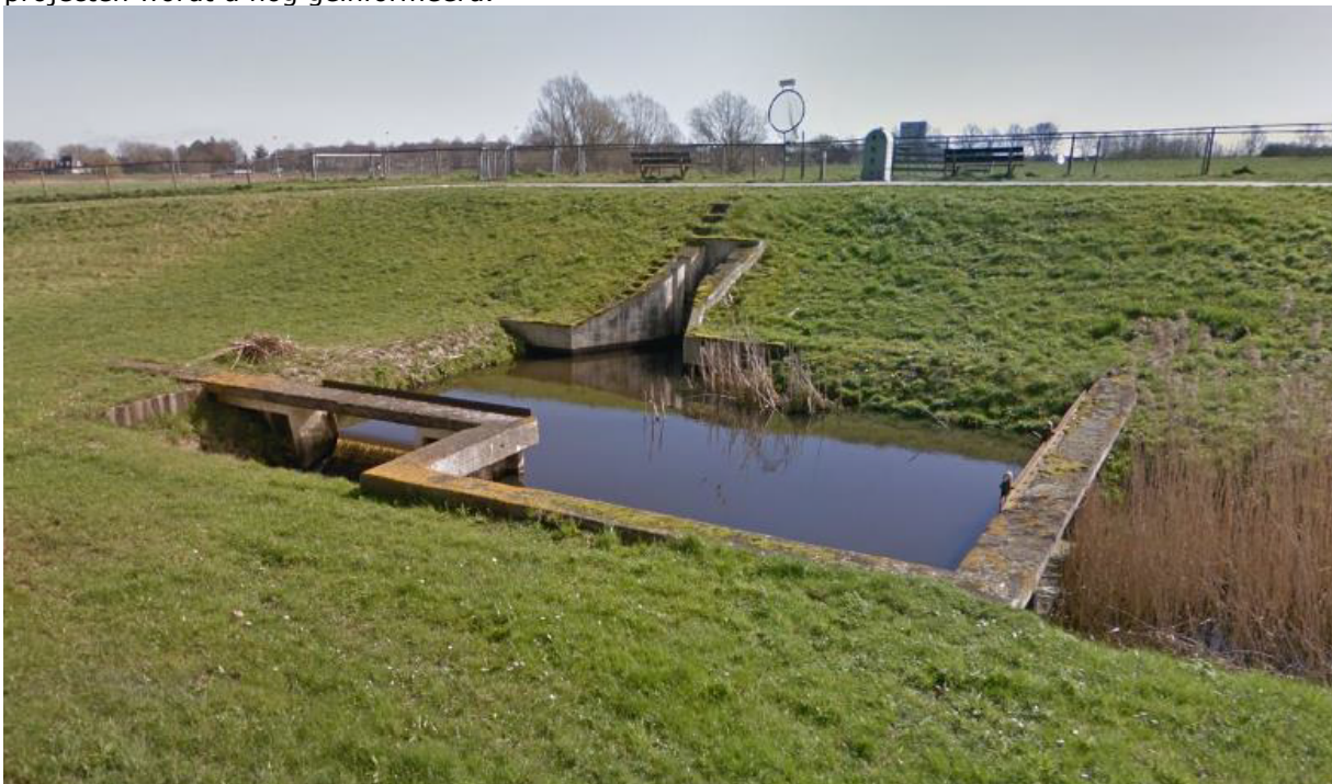
Inlaat Repelweg op Hoogwaterbeschermingsprogramma voor versterking

De toetsing van regionale en overige keringen wordt afgerond in 2023. Over de resultaten van deze toetsing wordt u begin 2024 geïnformeerd. Op basis van een eerdere toetsing wisten we al dat er twee kunstwerken, als onderdeel van de regionale kering, niet voldeden aan de norm. Omdat deze twee kunstwerken oude primaire keringen zijn, mogen ze nog één keer versterkt worden vanuit het HWBP. Daarom zijn deze kunstwerken als project opgevoerd op het HWBP-programma. Op dit moment wordt in een preverkenningfase nadere scopeanalyses uitgevoerd. Na deze analyses kan blijken dat een kunstwerk toch aan de norm voldoet. Ook zijn we in gesprek met HWBP over hoe we een efficiënte subsidieaanvraag kunnen doen. De formele verkenningfase, planfase en uitvoering zijn voorzien in 2024 en mogelijk 2025. Voor de start van het project of de projecten wordt u nog geïnformeerd.