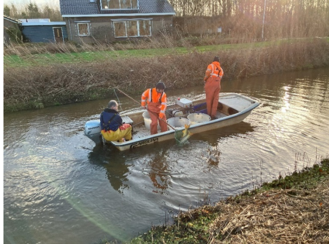
Afvissen karpers Stobbentocht

De aanleg van vijf vispassages bij de stuwen met subsidie uit het Gemeenschappelijk Landbouwbeleid is (naar verwachting) in 2023 afgerond. Deze vispassages zijn voorzien van een monitoringsysteem. Daarnaast zijn in 2023 de karpers uit de Stobbentocht verplaatst. De komende jaren wordt het effect van de maatregel op de visstand en vissamenstelling gemonitord. Hiermee beoordelen we of het huidige KRW-doel voor vis in deze tocht (blijvend) haalbaar is.