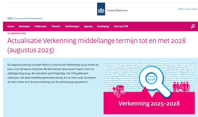
Actualisatie Centraal Planbureau augustus 2023

De afgelopen twee jaar wijzigden de economische omstandigheden sterk. Na een decennium van lage inflatie en loonontwikkeling zien we de afgelopen twee jaar een toename van de inflatie die voor ons waterschap merkbaar is in de toegenomen prijzen voor energie en materialen. Ook de lonen en rente stegen. Er is onduidelijkheid waar het in de toekomst naar toe gaat. Gaan we weer terug naar lagere inflatie of blijven de prijzen ook in de komende periode fors stijgen? We houden hierbij de vinger aan de pols, zodat we gelijk kunnen anticiperen wanneer er zich nieuwe ontwikkelingen voordoen. In de begroting en meerjarenraming is de laatste CPB prognose van de inflatie- en loonontwikkeling verwerkt. Het is daarom zaak om te zorgen voor een goed evenwicht tussen enerzijds het lastenniveau en anderzijds de noodzaak om de taakuitvoering op orde te houden en te blijven werken aan een toekomstbestendig waterbeheer.