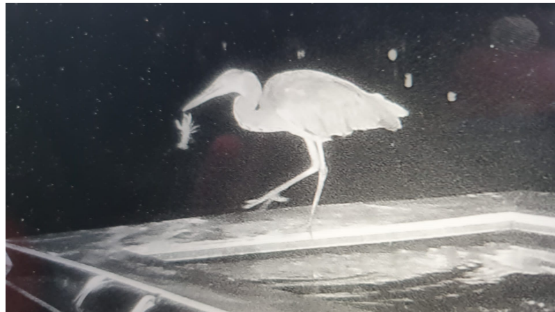
Reiger eet exotische rivierkreeft uit innovatieve kreeftenval Dronten.

In Emmeloordse wijk De Erven loopt een pilot van de hengelsportvereniging. Hierbij wordt met een harkboot het ongelijkbladig vederkruid geharkt. Het waterschap monitort de effecten op de waterkwaliteit. 2024 is het derde en laatste jaar van de pilot.