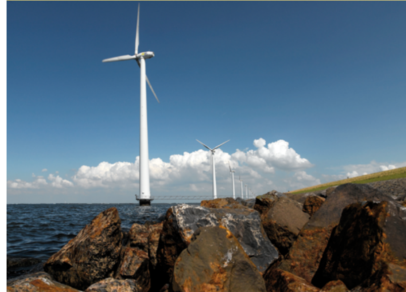
Groene energie willen we opwekken uit bijvoorbeeld windmolens, zoals hier bij de IJsselmeerdijk

We nemen klimaatmitigatie op in onze kerntaken. Net als bij klimaatadaptatie gaat het hierbij om groot onderhoud, vervanging en ontwikkeling. Bij nieuwe investeringsprogramma's en nieuwe programma's voor groot onderhoud worden de klimaatdoelen meegenomen. Per keer zal een afweging worden gemaakt wat mogelijk is en welke ambitie wordt gekozen. Er wordt een nieuwe energiestrategie vastgesteld. Hierin stellen we een eigen ambitie op voor de energiedoelen tot 2050 en dragen we bij aan een fossielvrije toekomst. Er wordt gekeken naar het opwekken en de opslag van duurzame energie én we werken energie-efficiënt. We monitoren onze CO 2 -uitstoot via de Klimaatmonitor van de waterschappen om de effecten van onze inspanningen te volgen.