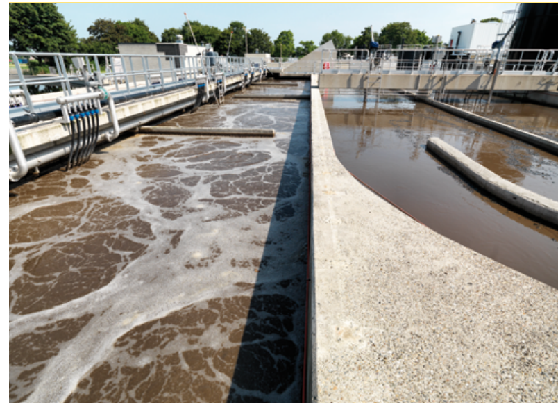
Op onder andere AWZI Dronten produceren we brandstoffen en energie uit het afvalwater

Heftige buien, meer droogte en hittegolven zullen vaker voorkomen. Dit maakt het verbouwen van voedsel moeilijker en na een heftige bui blijft het water op sommige plekken in de straten staan. Heeft u een tuin? Dan kunt u ook helpen! Hier kunt u tips vinden: www.zuiderzeeland.nl/tips-en-ideeen-voor-een-groene-tuin/