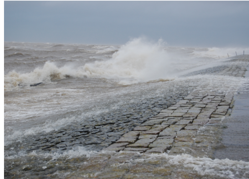
Extremere weersomstandigheden, zoals hevige regenbuien en storm, vragen om een robuuste dijk

We verankeren klimaatmaatregelen in onze kerntaken. Het gaat hierbij bijvoorbeeld om groot onderhoud en de ontwikkeling of vervanging van objecten. Bij nieuwe investeringsprogramma's en nieuwe programma's voor groot onderhoud worden de klimaatdoelen meegenomen. Per keer zal een afweging worden gemaakt wat mogelijk is en welke ambitie wordt gekozen. Programma's voor beheer en onderhoud die voor 2023 al klaar staan, worden hierop indien nodig aangepast. Ook gaan we een kantelpuntenanalyse uitvoeren om aan de hand van verschillende scenario's te ontdekken waar de toekomstige knelpunten liggen.