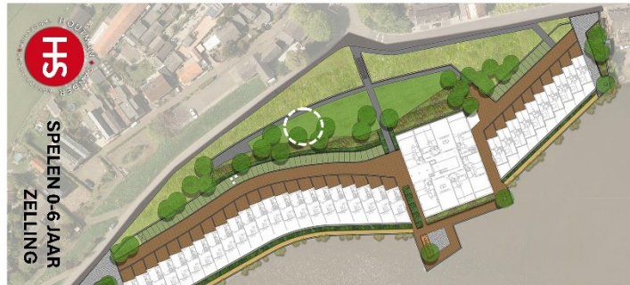
H5 SPELEN 0-6 JAAR ZELLING