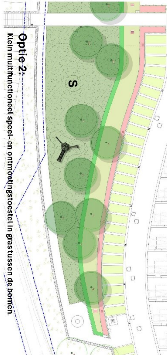
Optie 2: Klein multifunctioneel speel- en ontmoetingsstoelstel in gras tussen de bomen.