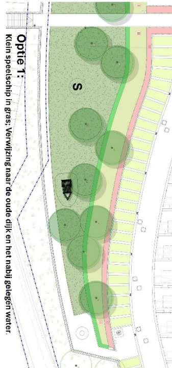
Optie 1: Klein speelschip in gras. Verwijzing naar de oude dijk en het nabij gelegen water.