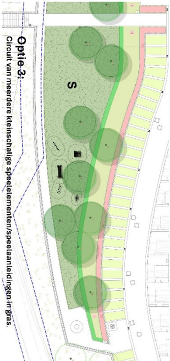
Optie 3: Circuit van meerdere kleinschalige speelelementen/speelaanleidingen in gras.